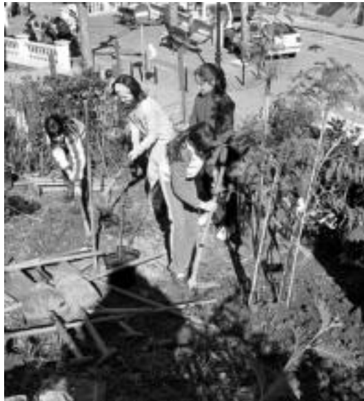
Autobideko soinuari hesia egiten lagundu zuten gaztetxoek. J. ASTIBIA

tian zehar hau ikusi, hura erosi, honetaz galdetu, hartaz ikasi... Larunbatero lanean hortxe aritzen direnetako mintegizale batek zioenez, beraiek ere gustura zeuden: «Gaurko salmenta oso ondo joan da. Jendea egun honetarako erreserbatzen da eta asko saltzen da, eta gustura gaude. Baina, akaso, larunbatero etortzen garenontzat ez da oso ona. Azkenik egun honen zain egoten baikara gu ere». Bestalde, aurreko asteetako elurteek ere eragina izan omen dute. «Azoka atzeratu egin da eta aldarioak egiteko berandutzen ere ari zela-eta kezkatuta geunduen», argitu zigun.