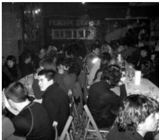
80 lagun bildu ziren, atzo, Gaztebako bazkarian. I.TERRADILLOS