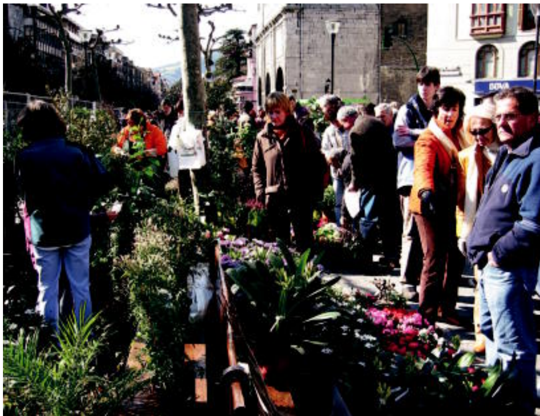
Askotariko landareak eta zuhaixkak ikus zitezkeen atzo goizean Trianguloan, Zuhaitz Egunaren harira egindako azokan. JAIONE ASTIBIA

BIGA ENKANTEA ▶ 45etik 40 buru saldu zituzten; garestiena, 1.620 eurotan: Pirenaika arrazakoa ▶ 6