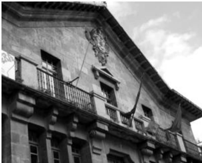
Leitzako udaletxeko balkoia horrelaxe ageri zen atzo goizean, Leitzako ikurra Nafarroakoa alde batean eta beste aldean, ikurrinaren lekua, hutsik zituela. JAIONE ASTIBIA

Ikurren legea delakoaren ezarpenaren inguruan 10 eguneko epean ikurrina kentzeko aginduz iritsitako erabaki sendoa betetzea erabaki dute