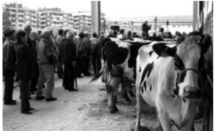
Biga Enkantea, iaz, Ferialekuan; arrazako 47 abelburu izango dira bihar enkantean. o. e.