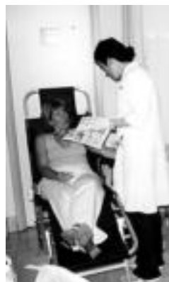
Odola ematen, iaz. HITZA

Sendagilearen Etxean jarriko dute postua eta bi orduz ariko dira bertan