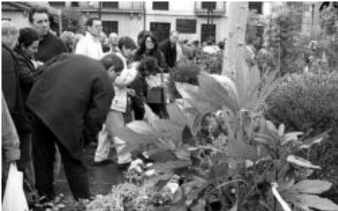
Iazko Zuhaitz Eguna; 16 erakusle eta Fraisoreen postua izango dira aurten. o. ESKITXABEL