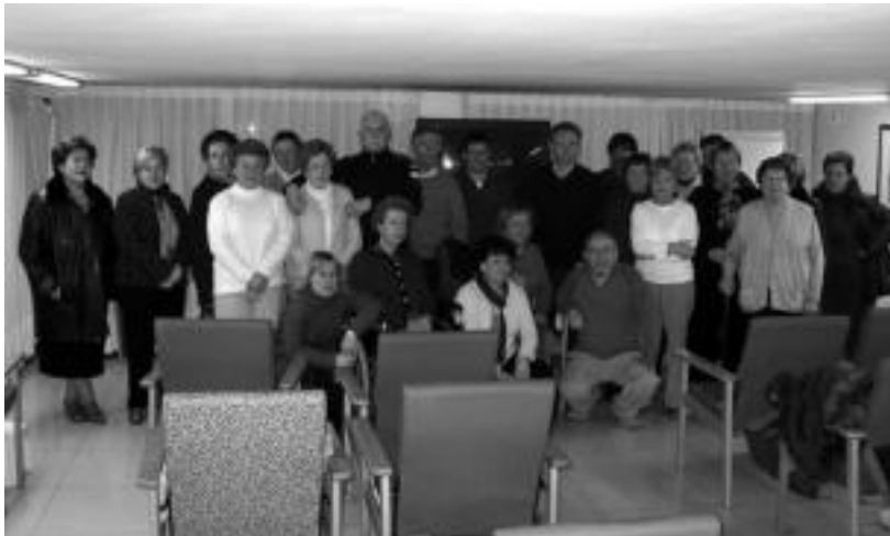
Gerontologikoan bertan egin zuten bilera erabiltzaileen senideek.