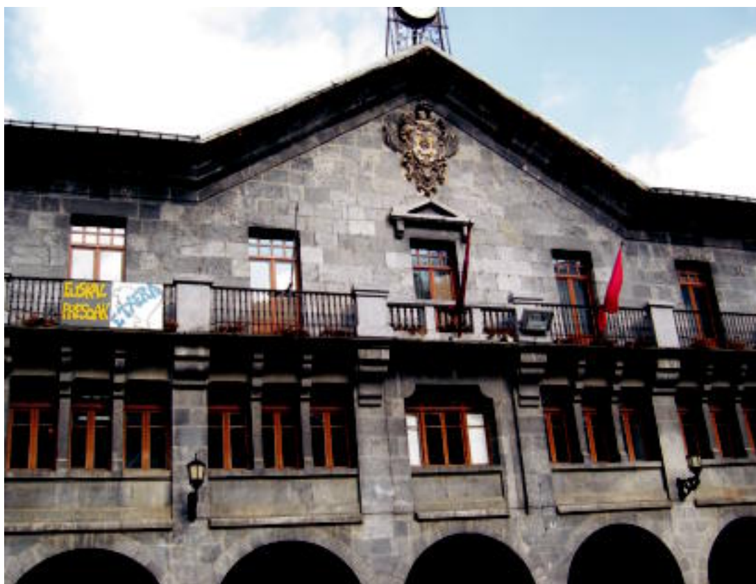
Leitzako udaletxea atzo goizean, ikurriña falta dela herriko eta Nafarroako banderen artean. JAIONE ASTIBIA

ERABAKIA ▶ Ez bada betetzen alkatea inhabilitatuko dutela dio erabakiak; horregatik bete dute ▶ 7