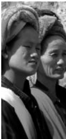
Emakumeak. Myanmarreko emakume batzuk. Jantziak eta kolore biziak erabiltzen dituzte. F.JUBIN

Irribonig izenekoa herrian aurkitu genduzen lehen aldiz Mekong ibaila, Lancang ibaila txinatarrekin. Lehorte garaia izanik, ur gutxi zerraman ibailak eta are bankuen artean agertzen zuten bere itxura ur korronteak. Baina hala ere, bere inguruan bitxia zen nagusi! Arrantzaileak, egurrezko kanpotan merkaturu hurbiltzen ziren nekazariak, atropa garbitzen zireen emakumeak, uretan jolasean zireen umeak... Guztiak biz ziren Mekong indartsuaren babesean! Dai etriakok dira batez ere hurrengo herrialde biziak. Mekong ibailako urak sakratuak dira berantzetan eta urteko ospakizun bereziena uraren festa da. Bertan, zahar eta gazte, gizon eta emakumeak, elkarri ura botatz bedekintzen dira ur sakratuetan. Ur bizi-tza eta biz sortzaile! Unerik