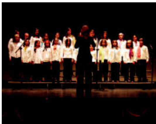
Laskorain Ikastolako abesbatza izan zen partaideetako bat. I. GARCIA

TOLOSA ▶ Jende asko bildu zen Leidorren eskualdeko Misio Taldeak Indiako proiektuetarako laguntza biltzeko Huar Misiolarien Jaialdian