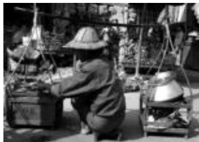
Merkatuan, Zopa saltzailek Myanmarreko merkatu batean kalean. F.JUBIN