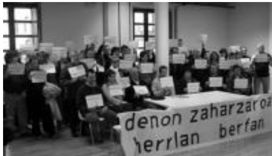
Gerontologikoaren aldeko plataforma, atzo kultur etxean.

«Gipuzkoako Foru Diputazioako Gizarte Zerbitzuen ardura-dunak Euskal Herria plazako