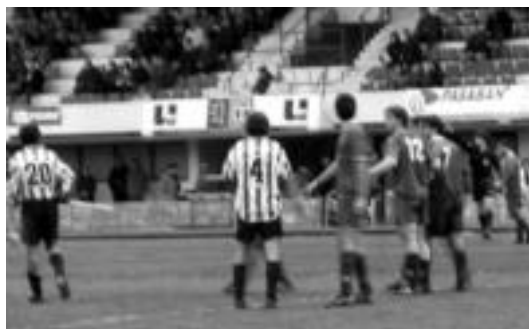
5-2 irabazi zuen atzoko partidari Tolosak Pasajes-en aurka. I.TERRADILLOS

Lehenengo zatian paretsu ibili ziren bi taldeak. Pasajesek sartu zuen lehendabiziko gola eta ondoren Orue izan zen Tolosarentzat berdinketa lortu zuena. 45. minutuan Aierbek penaltia egin zuen eta aurkariak 1-2koa sartu zuten.