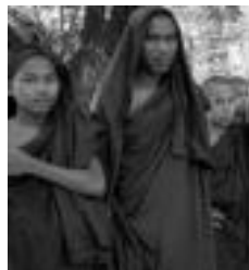
Mojeak. Moje gazte budista batzuk Myanmarren, bi bidaiari tolosarrei begira. F.JUBIN