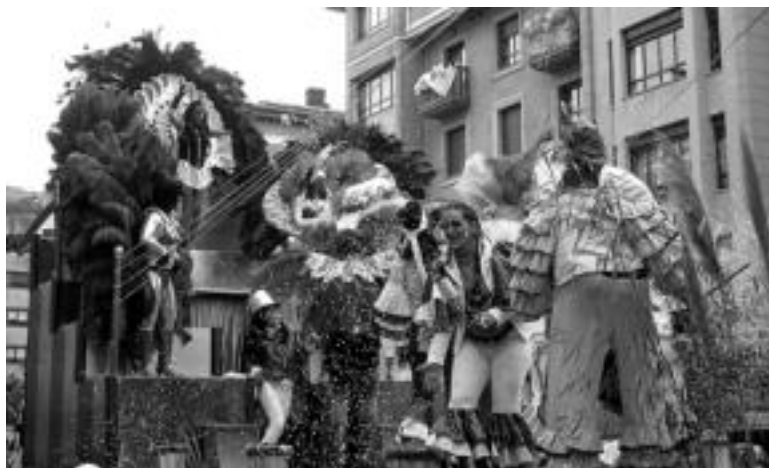
Karroza. 'El Korkobado y C.I.A.' karrozak giro ederra jarri zuen Brasilgo Inauteriak Tolosara ekarritz, Rio de Janeiroko Korkobado ezagunaren erreplika eta guzti. LEIRE MONTES