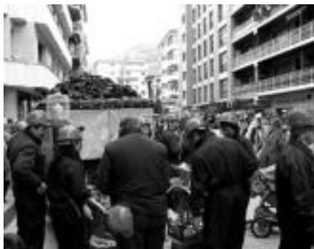
Konpartsa A taldea. Meategiko lanbide gogorra herriko kaleetaraino eraman zuten 'El tren de la mina' konpartsakoeak.

Tolosako Udaletik jakinarazi dutenez, aste honetan zehar deseraiki behar dira plataformak. Datorren urterako balio ez dutenak ferialean bertan dagoen zakarretara bota be-