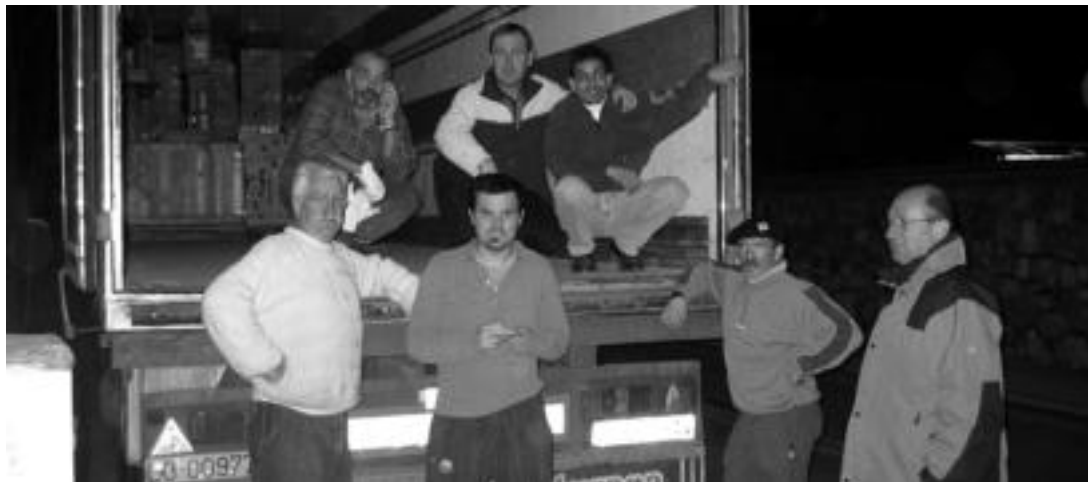
Tolosaldea Sahararekin elkarteko kideek, Tolosan duten lokalean, bildutakoa kamioian sartzen jardun zuten unea. NOELIA LATABURU

Gaur bidaliko dute sahararren aldeko karabanan bildutako janari eta materiala; aurrekoekin konparatuz, antzerako emaitzak izan ditu aurtengo bilketak