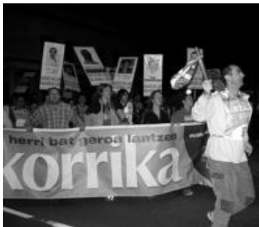
Jendea Korrikaren azken edizioan, duela bi urte, Ibarra. N. AZURMENDI

«Korrika herri guztietatik ez da pasatuko, baina denetan egin daiteke zerbait bere alde»