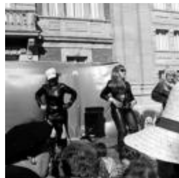
Konpartsa C taldea. Artxiboaren aurrean 'Demoda' konpartsa osatzen zutenek moda desfilea eskaini zuten. IRATXE ETXEBESTE