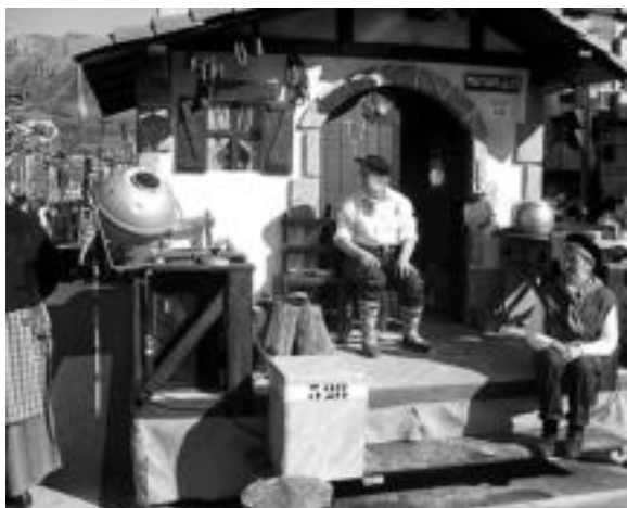
Plataformadun konpartsa. 'Baserría' izena du txapela eraman duenak. Baserría eta bertako bitzta ederki islatzen zituen. INIGO TERRADILLOS