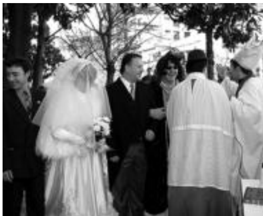
Konpartsa B taldea. Umorea ez zen faltako eta lagunik ere ez 'La boda de mi mejor amigo' konpartsan: ezkonberriak, apaiza, lekukoak... edozein ezkontzatan bezala. HITZA

har dira. Bestalde, Udalak gordeztea nahi dutenek, plataformak garbian —gorde nahi den materiala gainean duela—, paper handi batean, erraz ikusteko moduan, jabearen izena eta telefonoa jarri behar dute.