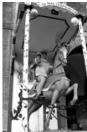
Konpartsa D taldea. Musekoa ez dakigu, baina kopako zaldunak jaso du Inauterietako txapela. LEIRE MONTES