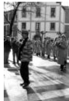
Polvo y Paja txaranga. J.SAIZAR

Ilargiarekin batera aldatzen dira Inauterietako datak urtero. Aste Santua ere bai. Tartean 40 eguneko Garizuma beti. Egutegi judutarrean Berpizkunde igandea martxoaren 20aren ondorengo ilargi beteari segitzen dion lehen igandea da. Data horri zazpi aste kenduta Zaldunita eguna ateratzen da. Hona hemen datozen urteetako Zaldunita egunak: