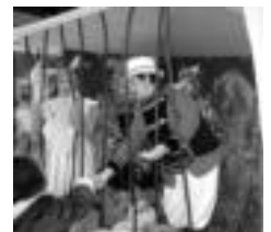
Zirkoko azeriak hauek oso eskuzabak ziren, gaurkiak-eta banatzen baitzireluden jendartean. L. MONTES