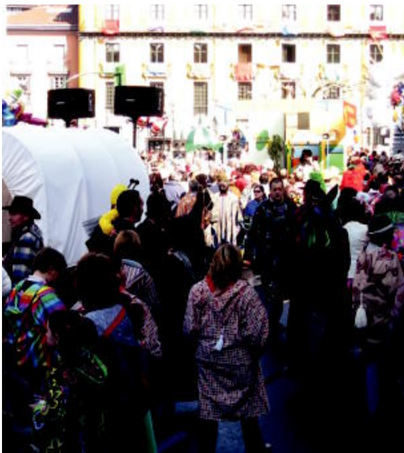
Jendetza. Nahiz eta Inauterietako azken eguna izan, eta eguraldia lagun, jende ugari bildu zen atzo eguerdian karroza eta konpartsen desfilea ikustera, batez ere Triangulon eta San Frantziskon. IRATXE ETXEBESTE

IKUSMINA ▶ Eguraldia lagun, jendetza bildu zen berriro umorez eta kolorez beteriko karroza eta konpartsen desfilean ▶ 4-5