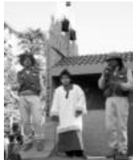
Tiltan-talan-eko arkeologoak, Santa Maria elizan.