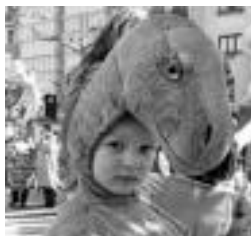
Herensuge lotsatia. I. TERRADILLOS