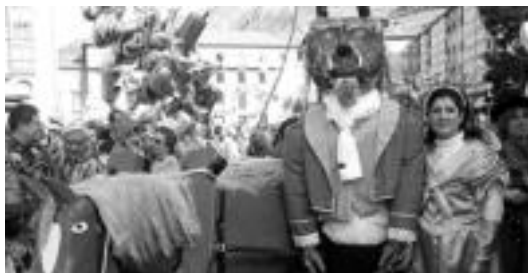
Ederra eta piztia, San Frantziskon, maitasuna erakutsiz. I. TERRADILLOS

Orrialde honetan mozorroen sailkapen txiki bat baino ez da ageri. Izan ere, ezin denak sartu. Beste asko, ordea, HITZAREN web orrialdean topa ditzakezue: www.tolosaldeko-hitza.info . Hala ere, sartu gabe geratu denik izango da, ziur. Hurrengo batean beharko!