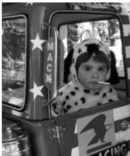
Txikienek ere ederki asko pasatzen dute. I. TERRADILLOS

«Gustura nago antolatzen diren ekintzekin, baina gustatuko litzaidake kontzertu gehiago izatea, eta talde eza-gunak izatea, ahal den neurrian behintzat».