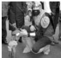
Zakurra eta jabea. I. TERRADILLOS