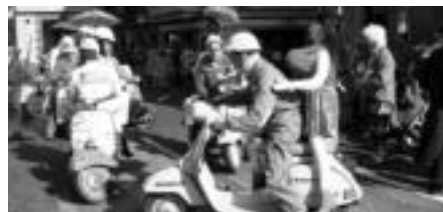
Vespa duenak neska omen du, eta argiakozentrat egia izan behar du horrek. Kalsan gora eta behera zebiltzan atzo, motor hots bikor askoak eraginez. Bakarren bati neska hantzi egin zitzaion, gainera. J. ARIETA

ka egiteko musika egokiarekin gustura zebiltzan Balantakakoak. Eta balantakak zebiltzanak, San Frantzisko ozeanoko uretan agertu ziren itsasontziak. Urturreko Anaren golidian, armatzaileek harraquin- toakoak salzten ziharduten, behan, kalean, sardimerak, sardimerak freskoak. Barkuaren lekuan, motorra aukeratu zuten beste batzuek. Esanak hala dio: Vespa duenak neska duela. Eta horiek, nola ez, ondo zebiltzan atzetalden neska bana zutela. Bakar- rren bati hantzi egin zitzaion neska, ordea, hantzia geratu. Putz eta putz jardun arren, ez zuten berreskuratzetik lortu. Ez ote da modu berean, muti edo- rren bat lortzeko biderik? Mutilak, neskek edo zer arriato ziren ez dakigu, baina oso ondo dantatzen zutela bai. Zeltiar musika oinarri har- tuta, koreografa dotore askoa eginez ibili ziren hamabost bat lagun saltoka eta arin-arin. Haur koskorra baino ez zen ho- rietako bat, eta arreta berezia piztu zuen begira gurendean