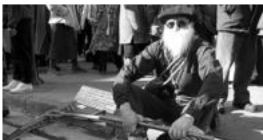
Segalaria, apusturako aurkari bila, desafioa bota ondoren. L. MONTES