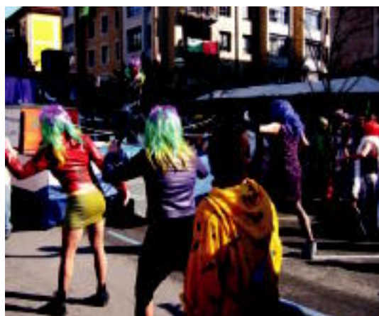
Dantzan. Balantxaka konpartsak dantzan eta aerobik egiten jarri zituen ingurukoak atzo goizean San Frantzisko kalean. LEIRE MONTES