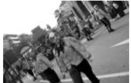
Musika zeltiarrak dantzatzen zuten, abil-abil, argiakiz ageri diren neska-mutiek. L. MONTES