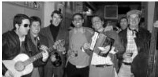
Errumaniatik etorritako musikariak, zarata ateratzen. N. LABABURU