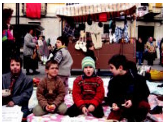
Eskean. Eskale txiki hauek eskean aritu ziren atzo eta Zaldunitan Trianguloan. Zerbait aterako zuten. INIGO TERRADILLOS