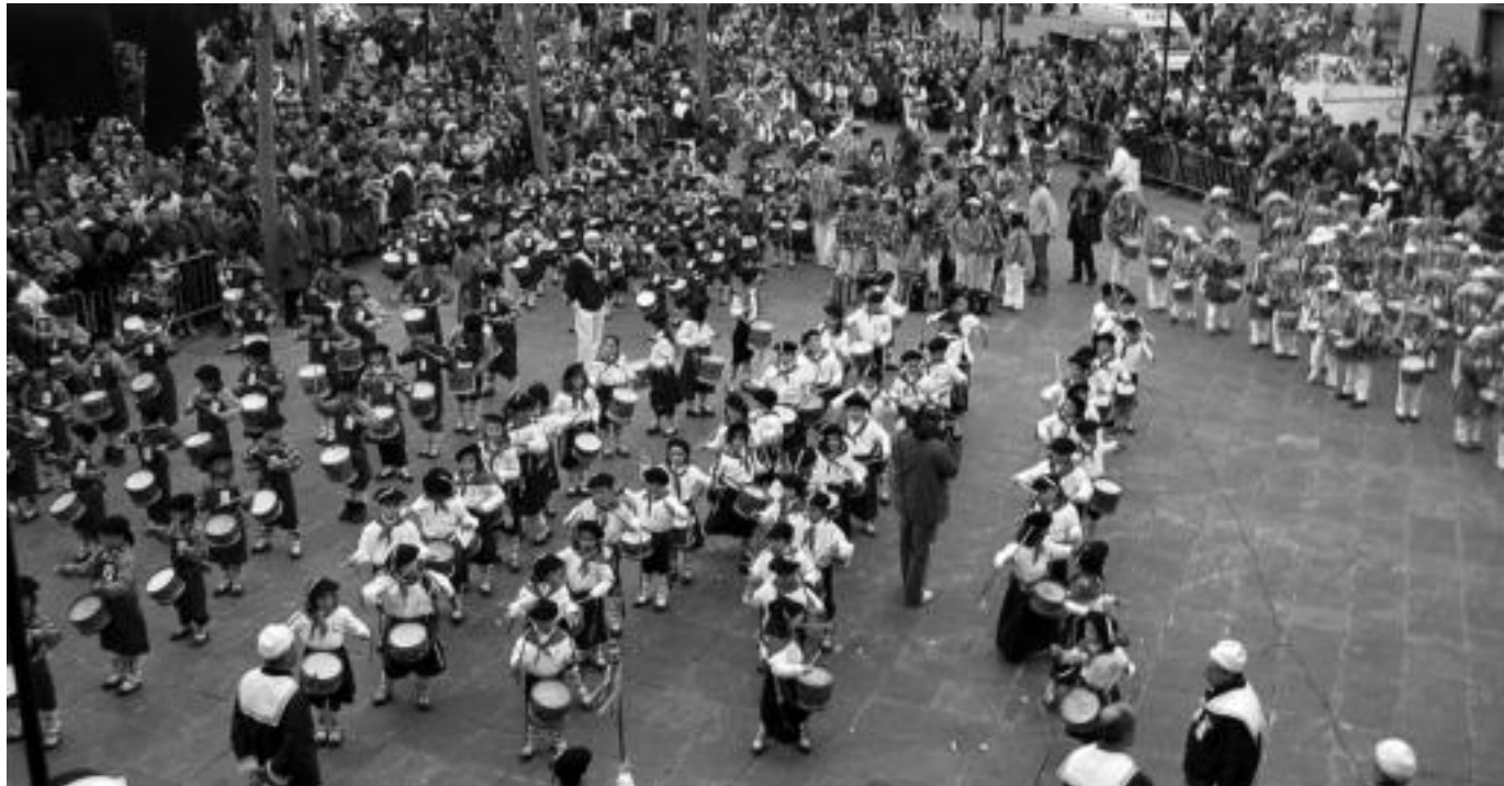
Trianguloa. Danborradan arte hartu zuten ume guztiak, Kultur Etxearen aurrean beren emanaldia egin zuten elkarrekin. Batzuk danborra jo, besteek soinua, eta besteek dantzatu, begira zegoen ikusle mordoaren gustuak aseztu eta hamaika argazkilariren izar izanez. NOELIA LATABURU

Gaztetxoak geltokitik abiatu ziren eta Tolosako kaleak alaitu zituzten bere danbor soinuekin; kantinerak, danborrariak, errementariak, txantxoak, kosakoak eta akordeoijoleak izan ziren