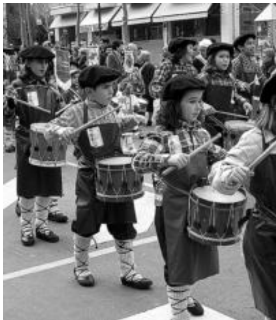
Errementariak. Eskuetan erremintak izan ordez, danborra jotzeko makilak zituzten, eta burdina maneatzeak ematen duen indarrez, jotzen zuten danborra.