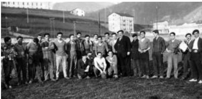
Elkartearen bi peña sortzaileak, Galtzaundi eta Gure Txokoa, Berazubini jokaturako futbol partiduan.

Jesusen Zerbitzarietako hurreman handia izan du aspaldidanik Gure Txokoak. Haur-