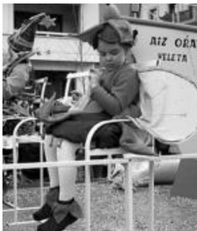
Karroza. Larunbatean saritutako mozorroa, patxadan ibili ziren eta ibilbidearen bi aldeetara zegoen guztiari, goxokiak banatu zizkieten, laguntzaileekin batera. JAIONE ASTIBIA