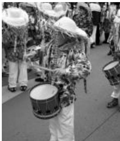
Txantxoak. Hauen jazkerek, besteekin batera, kolorea jarri zieten kalejirari. Hauetako aurpegia ikustea zail samarra suertatu bazen ere, batzuetan agerian gelditzen zitzairen. JAIONE ASTIBIA