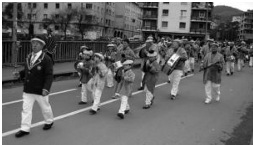
Arau batzuk dituzte txarangek; argazkian, San Esteban txaranga Berazubiko zubian jotzen.

Txaranga ofizialak eta ez ofizialak bereiztu behar dira hasiteko. Ofizialak dira zezenetarako joan-etorria, zezenak eta dantzaldia alaitu behar dute. Hamahiru musikari izan behar dute, gutxienez. Egunero hirur dira. Aurtien Zaldunitan, Alcoyano, Aiz-Orratz eta Sukal-