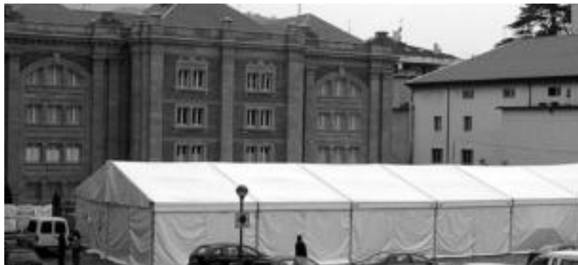
Txosnagunea Artxiboaren atzealdean dago kokatuta aurten, karpa batean babestuta.

Kokapen berria du aurten, Artxiboaren atzealdean; barra luze bakarrean lau talde ari dira lanean karparen azpian