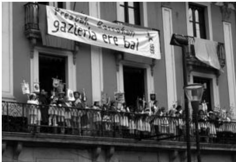
Balkoia. Elkarte guztietako ordezkari modura, kantinera guztiak Kultur Etxeko balkoi nagusira igo ziren, beren ikurrak airean zituztela. Bitartean, gainerakoek erakustaldia egin dute Trianguloan. Bakoitzak bere ordezkaria bilatzen zuen behetik eta agurtu. NOELIA LATABURU