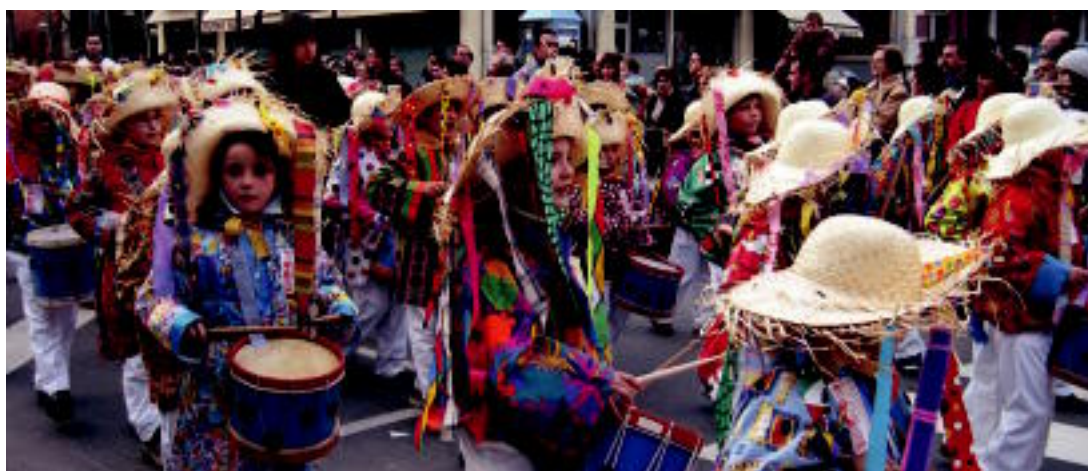
Haurrek ederki pasatu zuten arratsalden danborra joz Aiz-Orratz txarangaren doinuekin.

PARTAIDEAK ▶ Danborrariak, kosakoak, txantxoak, kantinerak, akordeoilariak... izan ziren ▶ 4-5