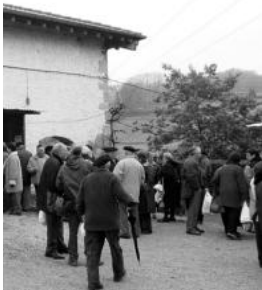
Gozoki bedeinkatuak poltsetan, atarian jolasean. JAIONE ASTIBIA

Hantxe bertan, ermitaren atarian, eros zitezkeen San