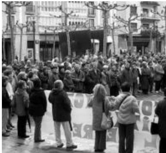
Jende ugari bildu zen pasa den larunbateko manifestazioan. N.LATABURU

guztien nahia betetzea; bertako langileek azaldutakoaren arabera soilik 10 adinekoek edukiko lukete lekua lurramendi egoitzan, eta Tolosako gainerako egoitzetan lekurik ez dago.