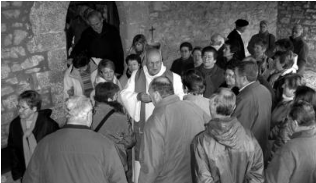
San Blas ermitan barreneko elizatarrek ez ezik, elizartetan zeudenek ere bedeinkapena jaso zuten atzokoan.