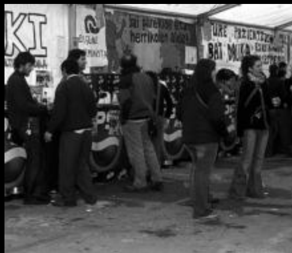
Txosnagunea. Bertan ere eman zieten hasiera Inauteriei. L. MONTES