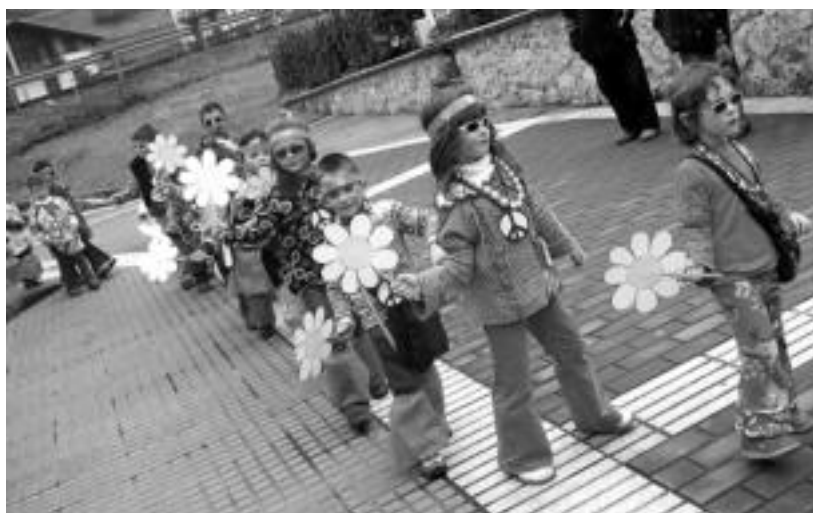
Irura. Irurako eskolako umeek dantza saioa eskaini zuten herriko plazan. Hippy mozorroa aukeratu zuten eta pelukak eskulan klaseetan egin zituzten; dantza aurretik txistorra jan zuten gaztetxoek. NOELIA LATABURU