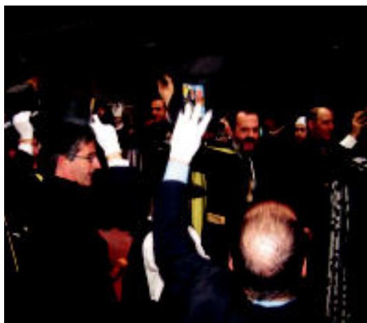
Kabi Alaiko udal korporazioa txarangarekin abesten. IRATXE ETXEBESTE

GAUR ▶ Gaur zezentxo festa izango da eta Arpegi taldearen jaialdia Leidor zineman ▶ 2-5