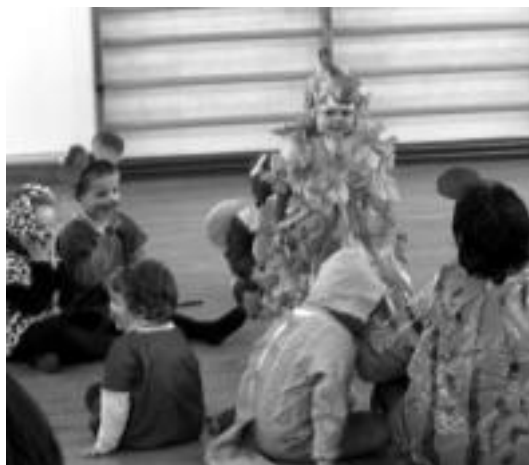
Ikaztegieta. Herriko umeek ikuskizun berezia antolatu zuten eskolan bertan; lau multzotan banatu ziren umeak, adinaren arabera eta bakoitzak bere antzezpena egin zuen. Gurasoak eta lagunak txantxoak ikusten izan ziren, giro alai eta umoretsuan. NOELIA LATABURU