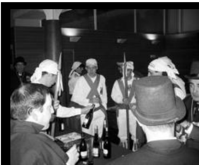
Itxurazkoa. Kabi Alai elkarteko udal korporaziokoak, txistorra jaten. L. MONTES

Uste baino lehenago, artean 12:00ak ez zirela, hasi ziren, atzo, 2005eko Inauteriak; itxurazko udal korporaziokoek festak ondo pasatzeko gonbita egin zieten tolosarrei zein kanpotik etorritako guztiei