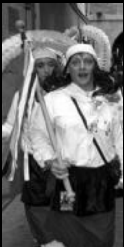
Dantzariak. Dotore. I. ETXEBESTE

eta horiei guztiei ere gure animerik handienak, beraz. HITZA-k kazetariok, lanean bada ere, Inauteriaz gozatzeko ahalegina egingo dugu. Besterik ezean, zuei informazioa helarazteko.