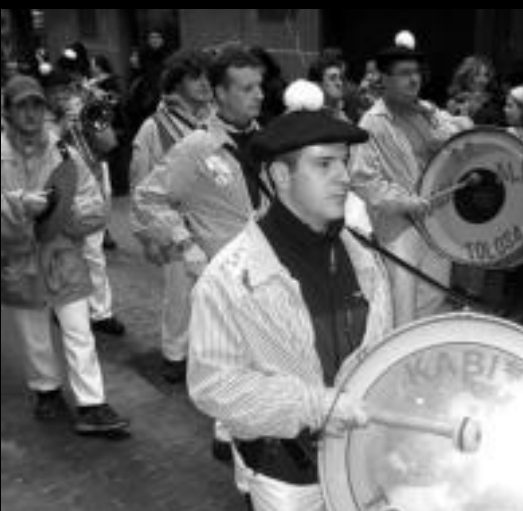
Txaranga. Kabi-Alai elkarteak kideak, kalez kale. I. ETXEBESTE