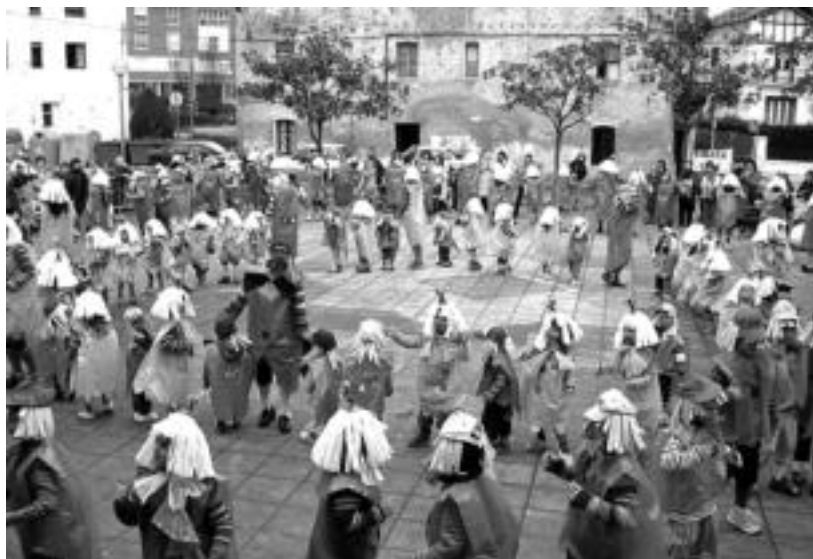
Zizurkil. Jose Arregi plazan elkartu ziren. Lehenengo, San Millan Ikastetxeko haurrek erromeria saioa aurkeztu zuten, baserritar eta moderno jantzita. Ondoren, Jesusen Bihotza Ikastolako haurrek elur panpinez bete zuten plaza eta, bukatzeko, Otaño Ikastetxeko ehun pailazok alaitu zuten plaza.