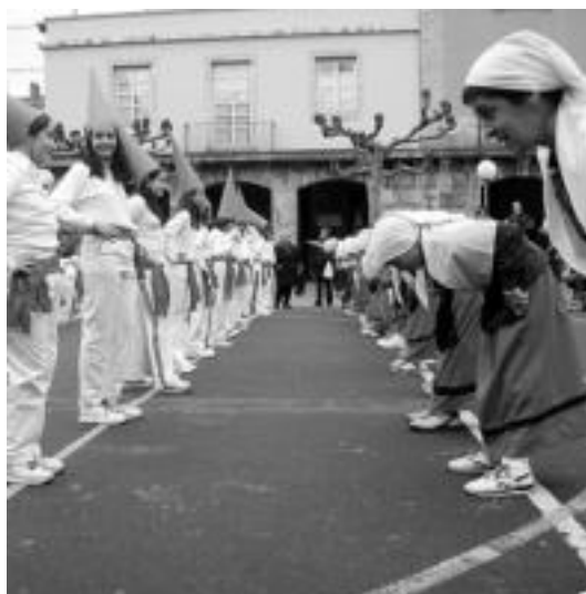
Villabona. Ikastetxeak Errebote plazan elkartu ziren bere ekitaldiak aurkezteko. Trogloditak, sorgin dantzak, dantzariak eta ipotxak izan ziren bertan ikusi ziren txantxoak. Ondoren, kalejira egin zuten Incansables txarangaren eskutik. IMANOL GARCIA