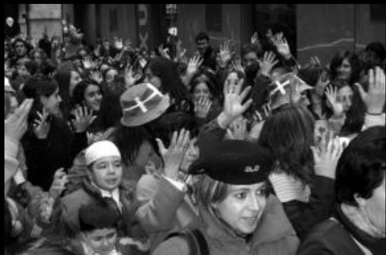
Inauteri doinuak. Jendea, Ostegun Gizen kantuaren esanetara, eskuak astintzen. L. MONTES