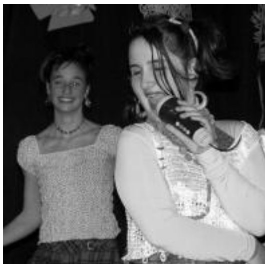
Anoeta. Asteazken arratsaldean Anoeta eta Irurako ikastolek bat egin zuten eta ekitaldia antolatu zuten, Anoetako ikastolan. Albistegia antzerkia egin zuten eta hainbat esketz eskaini zuten, Shangaiko euskal etxea eta basetxea Afrikan, besteak beste. HITZA

Inauteri desfilea egingo dute Albizturgo umeekin batera; Alkizan dantza eta ume jolasak izango dira herriko plazan; Adunan, berriz, haur jaialdia antolatuko dute Elordi plazan dagoen lokalean; Amezketak haurrek ere Inauterietako desfilea egingo dute eta Asteasun, azkenik, Pello Errota eskolako haurrek frontoira iritsiko dira eta, ondoren, jaialdia egingo dute bertan.