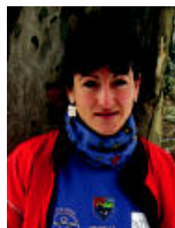
Korrikalari amezketarra. I. GARCIA

Oraingoz ez dio korrika egiteari utzi nahi ▶ 23