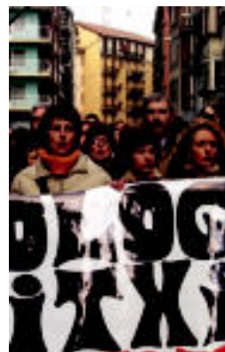
Atzoko manifestazioa. N. LATABURU

ERABAKIA ▶ Egoiliarren senideek adierazi dute adinekoen zentrotik ez direla «mugitu ere egingo» ▶ 4