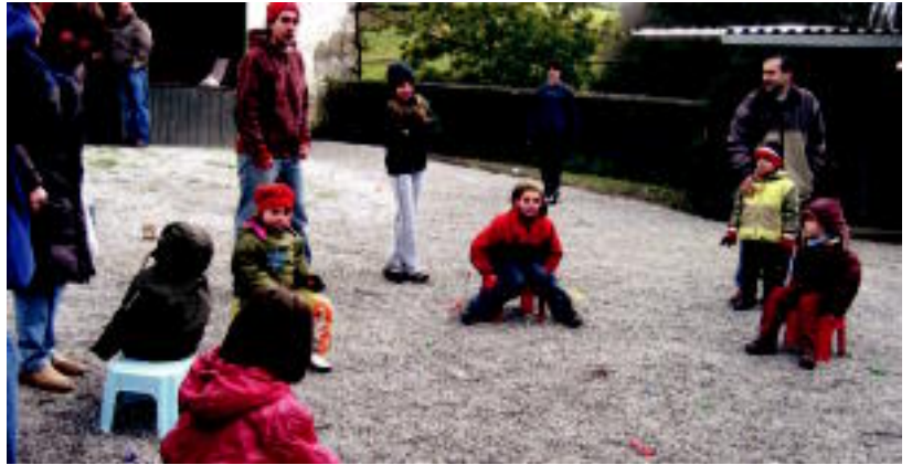
Auzoko eta inguruko gaztekoen haur jolasekin gozatu zuten San Blas egunean. NOELIA LATABURU

SAN BLAS ▶ Haur jolasak, toka lehiaketa, Etxabe anaien trikitixa emanaldia eta, nola ez, San Blaseko erroskilek osatu zuten atzoko egitaraua