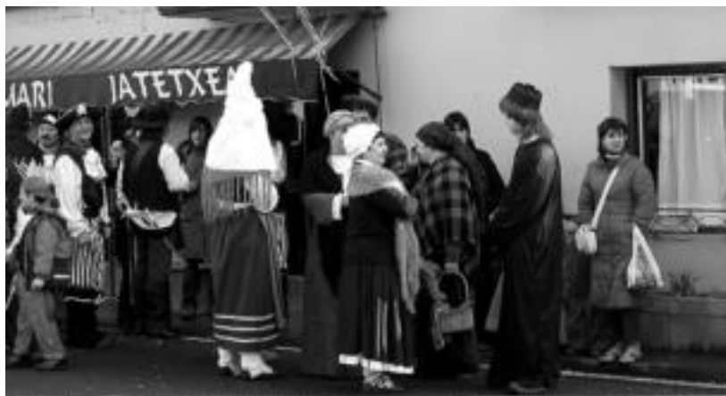
Lizartzako kaleak mota askotako mozorroz beteta egon ziren atzo, egun guztian zehar. JAIONE ASTIBIA