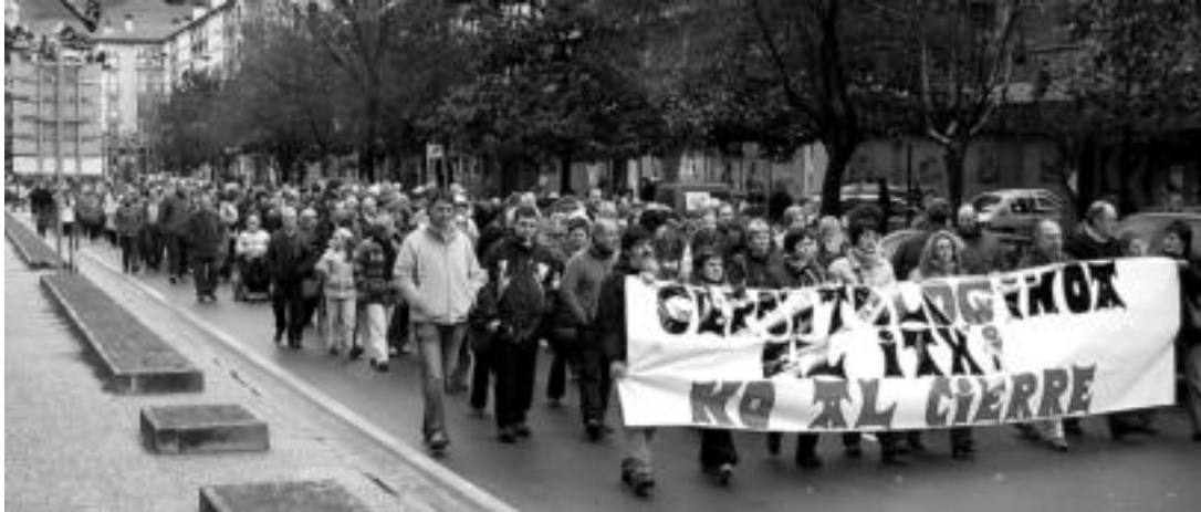
Gerontologikoaren itxiera salatuzko manifestazioa egin zuten ehunka lagunek Tolosako kaleetan; atxikimendu asko jaso zituen. NOELIA LATABURU

Tolosako Gerontologikoko senitartekoez adierazi dute ez direla zentrotik mugitu ere egingo; hainbat atxikimendu jaso ditu itxieraren kontrako manifestazioak