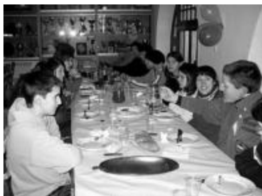
Goizean ongi gosalduta atera ziren baserrietara aresoarrak.

Gaur, berriz, herrian ibiliko dira eskelariak biak hala bi herrietan. Areson bazkaria La-