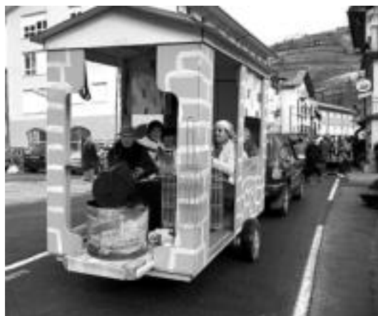
Suaren beroan, gaztainak janez ederki ibili ziren lizartzarrak. J. A.