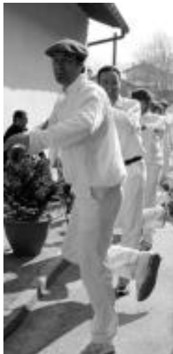
Bihar hasiko dira Inauteriak. HITZA

12:30ean egingo da igandean zubi berriaren inaugurazioa eta hitzaldia eskainiko du Axurdario herri plataformako ordezkari batek. Txalapartari, dantzari eta bertsolariak ere izango dira. 14:30ean bazkaria egingo dute herritarrek Txirri-ta elkartean.