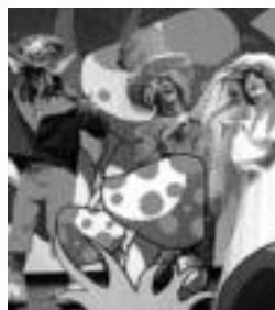
Ikuskizunaren une bat. HITZA