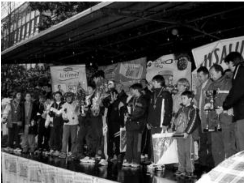
lazio edizioko irabazleak bere sariekin, antolatzaileak eta udal ordezkariak ondoan dituztela. IRATXE ETXEBESTE

Krosa dela eta, Udaltzaingoa trafikoa neurri batzuk hartu ditu iganderako 11:00etatik 13:00etara. Ibilbidea itxita egongo da eta trafikoa La Roncalesa autobusa Santa Lucia garajearen parean geldituko da eta Donostiako autobusa zezen-plazan, Nafarroa etorbidean eta Igarondo bialean. Taxi geralekua Soldadu kalean izango da, eta ez Zumalakarregi kalean.