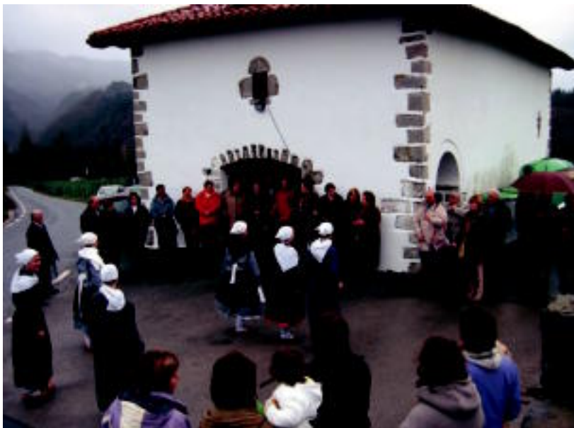
Dantzarien saioa Leaburuko San Sebastian ermitaren aurrean, atzo arratsaldean. IÑIGO TERRADILLOS

EURIA ▶ Berastegin meza igandera atzeratu dute, eguraldi txarra zegoelako ermitara joateko ▶ 6