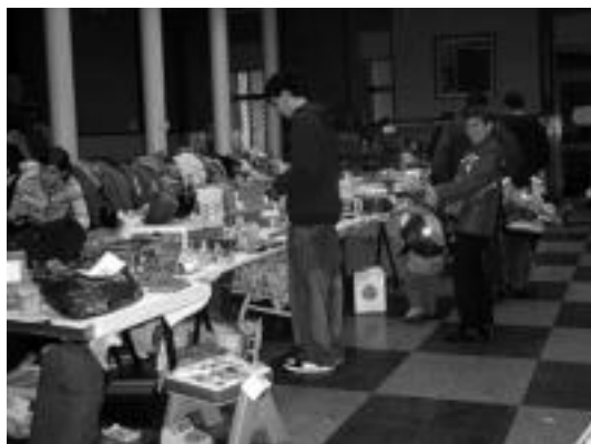
Merkatu Txikian makina bat jende aritu da aurten lanean. L. MONTES