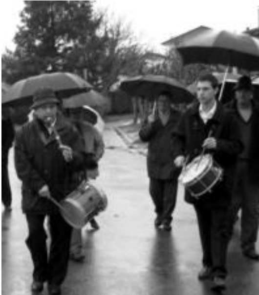
Oreindaindar batzuk kalejiran hurbildu ziren ermitaraino.

Elizkizunek, txistulariek, dantzariak eta hamaiketakoek osatu zuten eguna