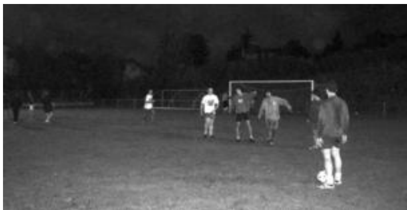
Aurrera taldea Arkixkil futbol zelaietan, prestaketa lanetan, aurreko egun hauetan. JAIONE ASTIBIA

Nafarroako Unibertsitate Pribatuko taldea izanen du arerio, Arkixkilen 16:00etatik aurrera jokatu duten partiduan