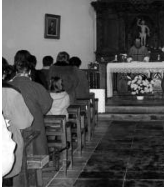
San Sebastian ermita jendez lepo zegoen meza garaian. N. LATABURU