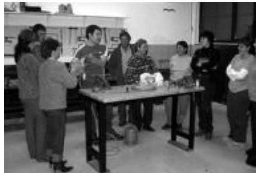
Orain aurrekoan bukatu dituzten ikastaroen modukoak, berriz. J. A.