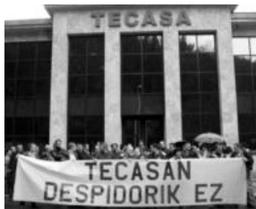
Langileak enpresa aurrean bildu ziren protesta egiteko.