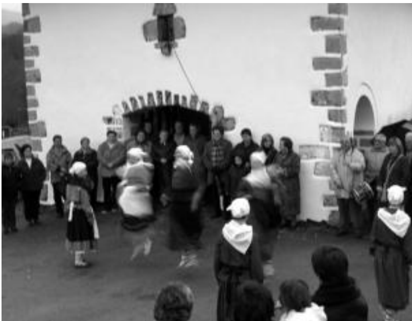
Leaburuko San Sebastian ermita kanpoan, meza ostean, dantzarien saioa izan zen. IÑIGO TERRADILLOS