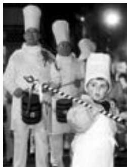
Baso Etxea danborrada. IRUTXULO

00:00. ▶ Ondar-gain, Marina kalea 4. ▶ Los Corcones, Bergara k. 11. ▶ Lurgorri, Hernani kalea 17. 01:30. ▶ La Espiga, San Martzial kalea 48. ▶ Cantabrico, Askatasunaren hiribidea 24. 02:00. Antonio Bar, Bergara kalea 3. 10:00. Jatorra, Larramendi kalea 14. 16:00. Europa, San Martin kalea. 16:30. Marianistas, Aldapeta kalea 17:00. ▶ Anastasio S, Easo kalea 9. ▶ Anastasio J, Easo kalea 9 ▶ Anastasio (emakumeak), Easo kalea 9. ▶ Gaztedi, Okendo kalea 22. 17:45. Gizartea, San Martin kalea 15.