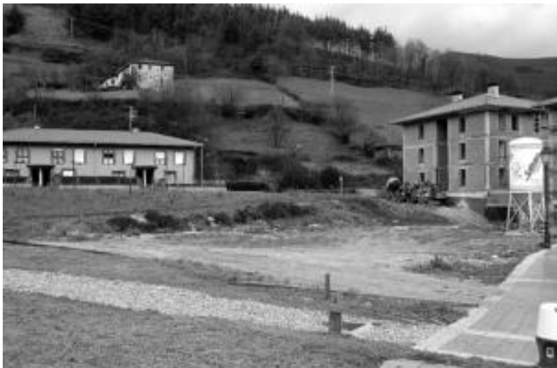
Eraikitzen ari diren etxebizitzaren eta Iriarte jatetxearen artean altxatuko dute eskola berria. I.TERRADILLOS

Hasi berriak dira Berrobiko eskola berria eraikitzeke obrak; 2006ko apirilean egitea irekiera ofiziala espero dute