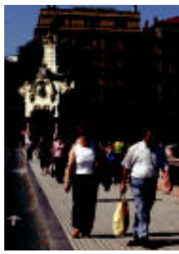
Oinezkoak zubian. IRUTXULO