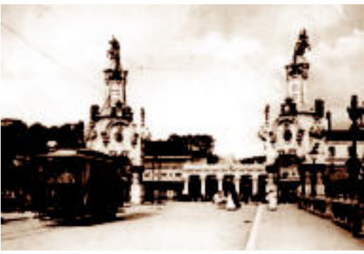
Maria Cristina zubia, duela mende bat.

M aria Cristina zubiak ehun urte beteko ditu San Sebastian egunean, 1905eko urtarrilaren 20an inauguratu baitzuten. Zubia eraiki aurretik, egurrezko pasabide batek lotzen zituen Erdialdea eta Norteko Geltokia, baina pasabidea txiki geratu zen, eta Udalak harrizko zubia eraikitzea erabaki zuen. Horretarako, Donostiako Aurrezki Kutxak 700.000 pezetako mailategua egin zion Udalari, intere-