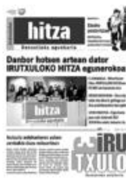
Irutxulo -ren 1. zenbakia (94-04-15) eta azkena (05-01-14).