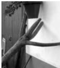
Kakoa. Erdiko adarra kokotzean sartuta, zintzilik jartzen da. J.A.

Dena den, festa egunaren kutsua ere badu txerri-hiltzeko