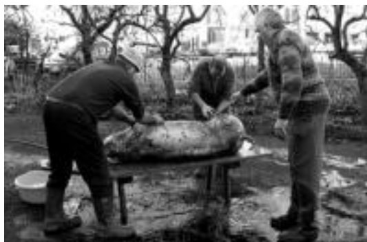
Garbiketa. Eiltze-tapaekin, marruskatuz, eta urarekin, suak jarri dion azaleko beltzetasuna kentzen zaio. Ondoren labanaz garbitzen da. J.A.