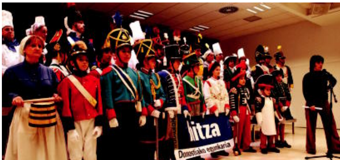
Astelehen iluntzean Okendo kultur etxean egin zuten ekitaldia HITZAREN aldeko Donostiako hainbat danborradak.

ATXIKIMENDUA ▶ 62 danborradak eman diote babesa egunerokoari, eta «gure festen eta ohituren sustatzaile» izateko eskatu diote ▶ 4-5