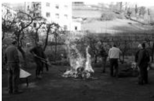
Erreketa. Txerria aurrea sabelez behera paratu, istor lehorraz estali eta sutu egiten da, dituen bizarrak erretzeko. J.ASTIBIA