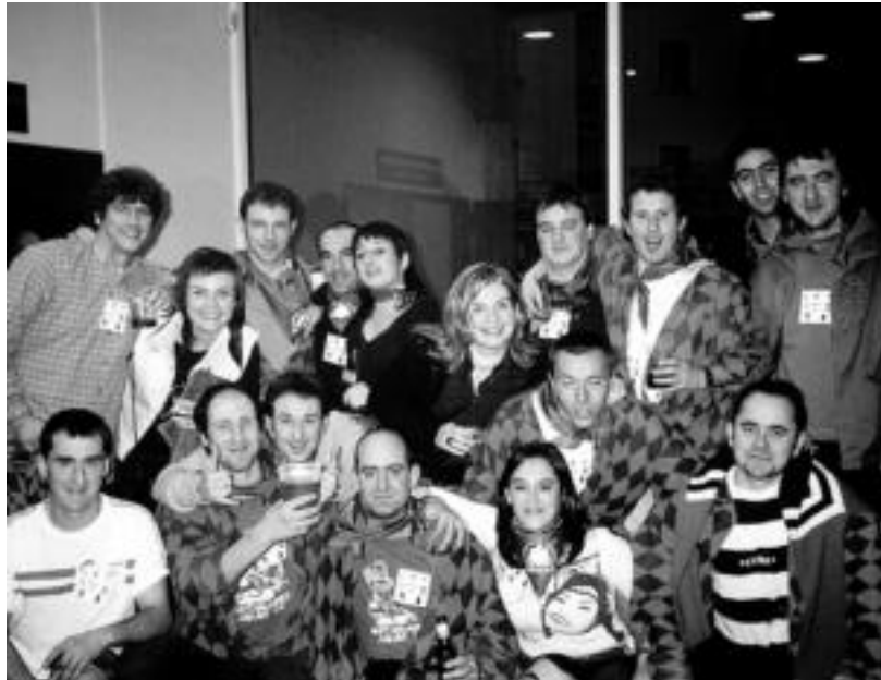
Koadrilen Egunak 25 urte beteko ditu aurten; argazkian, Gautxirri koadrilakoak. IRUTXULO

Gaur hasita, igandea arte iraungo dute Antiguako San Sebastian jaiak