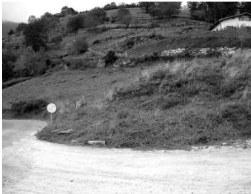
Peru baserriaren azpian eraikiko dira hamasei etxebizitza tasatuak. I. GARCIA

Etxebizitzek 91 m 2 -ko azalera izango dute eta lau eraikinetan izango dira, bakoitzean lau etxebizitza egingo direlarik. Garajea eta ganbara izango du