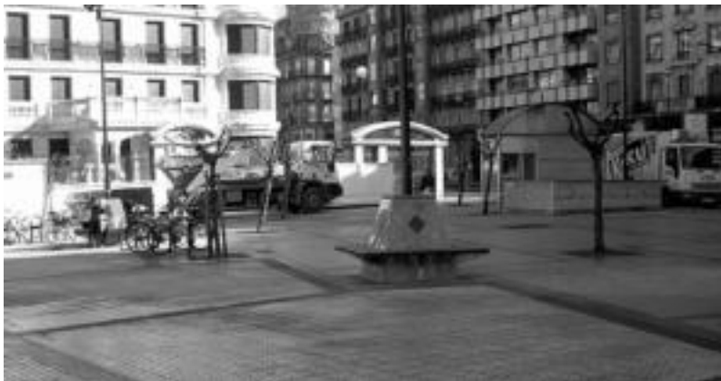
Kontxako pasealekuaren azpian 141 aparkaleku gehiago izango dira laster. IRUTHULO

Udalak laster ekingo die Vinuesa plazako lur azpiko aparkalekua zabalteko lanei. Aparkalekua Kontxako pasealekuaren azpian dago, eta 141 toki izango ditu. Toki horietako bat eskuratzeko, izena eman behar da urtarrilaren 31 baino lehen, Urdaneta kaleko Mugikortasun sailean, gida eta zirkulazio baimen originalak eta fotokopiak aurkeztuz. Donostiar guztiak eman dezakete izena; hala ere, tokiak banatzerako orduan, Erdialdeko bizilagunek eta merkatariek lehentasuna izango dute.