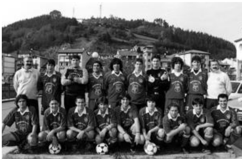
Lurraldekako bigarren mailan dago aurtien Intxurre eta igoera fasea jokatzeko ari dira. HITZA

Lurraldekakoek lehen mailara igo nahi dute; jubenilek, berriz, maila mantendu