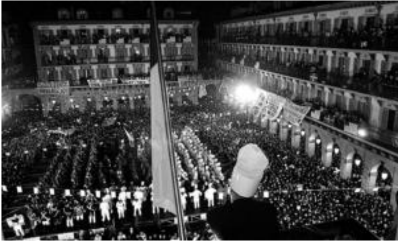
Urtero bezala, Konstituzio Plazan giro ederra izango da gaur gauerdian. IRUTXULO

10.500 danborrarik txoko guztietara barreiatuko dituzte Sarriegiren doinuak, gaur gauean hasita