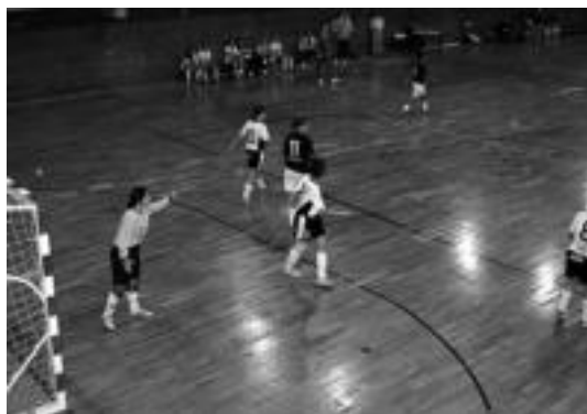
Hegoaldeko neskek ez zuten larunbatean irabazterik izan. HITZA

Hamargarren minututik aurrera joko apur bat aldatu zen. Kanariarrek beren taktikari eusten zioten bitartean, Hegoaldeko kantzara behegero jokatzeak apostua egin, eta atea gehiago zaindu zuten. Hala ere, aurkarietako baloiak lapurtu eta ihesaldiez baliatuz, hainbat gol aukera izan zituzten berriro ere tolosarrek. Kanariarrek, ordea, etengabe aldatzen zuten joko eta baloia modu azkar eta erosoan dantzatzeko zuten,