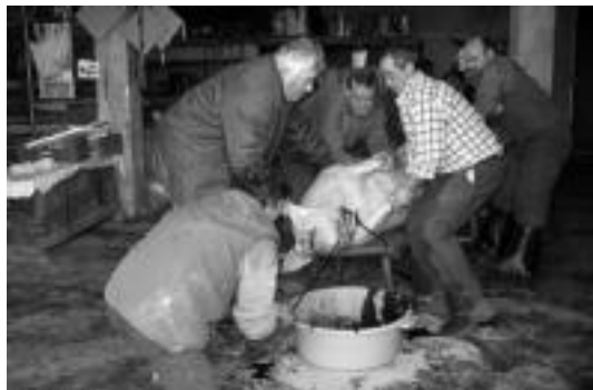
Sangatu. Kokozpetik gantxo sartu eta mahaira eraman ondoren, lepotik sartzen zaio labana, odolustu dadin. JAIONE ASTIBIA

Gure herrietan oraindik ere etxe askotan hiltzen da txerria, negu hasierako tenore hauetan; etxe txerriak izateko eta ohiturari eusteko ere egiten da