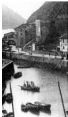
Kaia, duela mende bat.