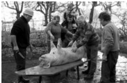
Ireki. Barren hustu egin behar da: erraiak eta tripak ateratzeko, kanalean irekitzen da. Txerriaren gutzia baliatu daiteke. J.ASTIBIA