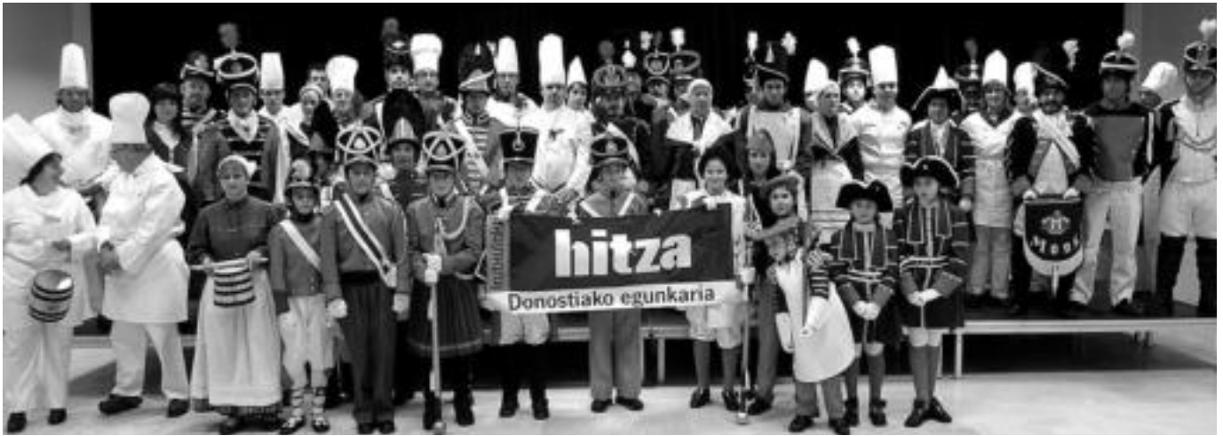
62 danborradak eman zioten babesa astelehen iluntzean IRUTXULOKO HITZA egunkariari, Okendo kultur etxean egindako agerraldian.