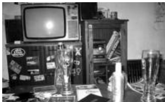
Telebista edota filmak ikusi eta musika entzuteko prestatuta. HITZA

eta bestelako tresnak lortzeko ere dirua behar izaten da, horregatik gurasoek berritzen duten edozein tresna erabilgarria izaten da gazteentzat. Hozkailuak, labeak, mikrouhinen labeak, telebistak, DVDak, bi-