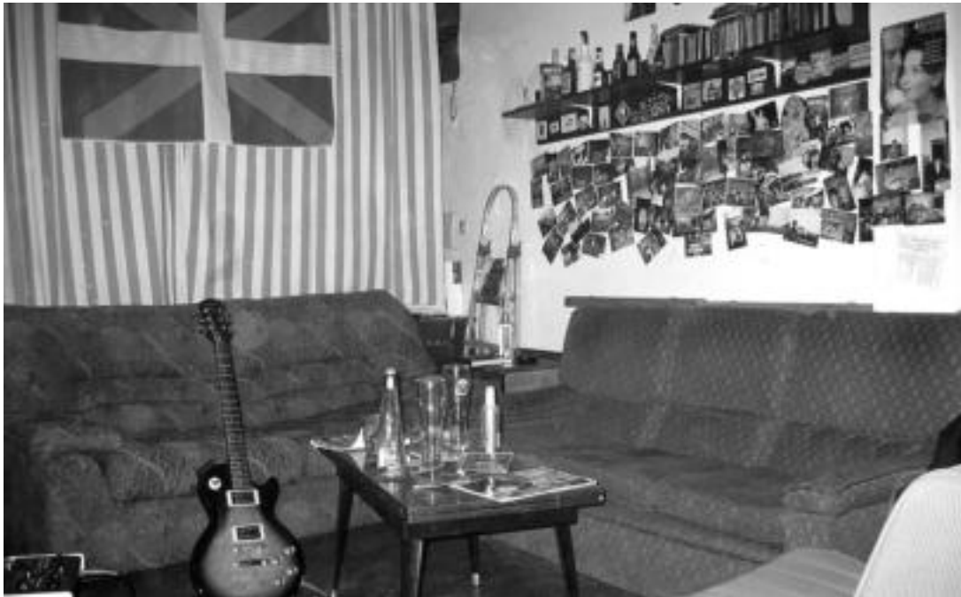
Tabernetan edo kalean egoteari alternatiba aurkitu diote egungo gazte taldeek alokatutako lokalak beren biltoki bihurtuz. HITZA