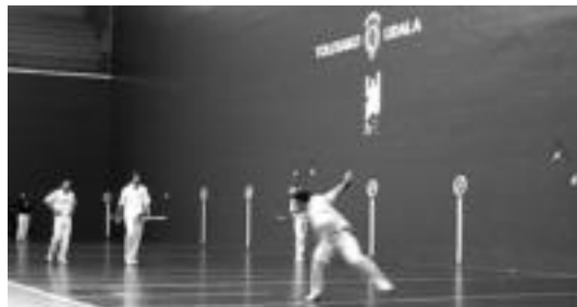
Lau t'erdiko txapelketako lehen hiru partidak jokatu zituzten atzo.