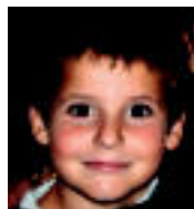
ZORIONAK Spiderman. Bihar 6 urte.