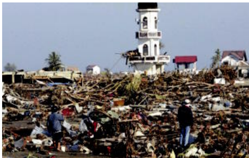
Milaka hildako eta erabateko hondamendia utzi du itsasikarak Asia hego-ekialdean.

TOLOSALDEA ▶ Asia hego-ekialdean itsasikarak kaltetutakoei laguntzeko hainbat kontu korrante zabalik dira; Tolosako Udalak Laguntza Fondoa sortu du