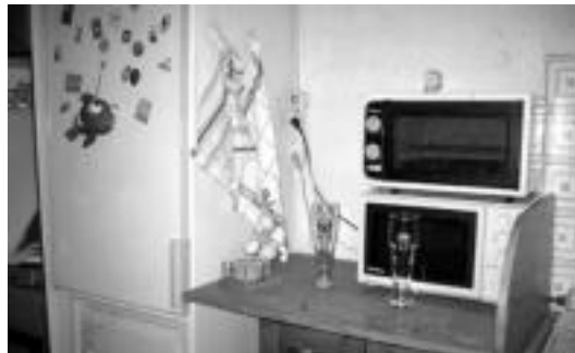
Afariak egiteko beharreko guztia izaten dute lokal horietan. HITZA

Gazte lokal horien errenta hilabeteko 250 eta 400 euro artekoa izaten da, eta horrez gain, elektrogailuak, altzariak