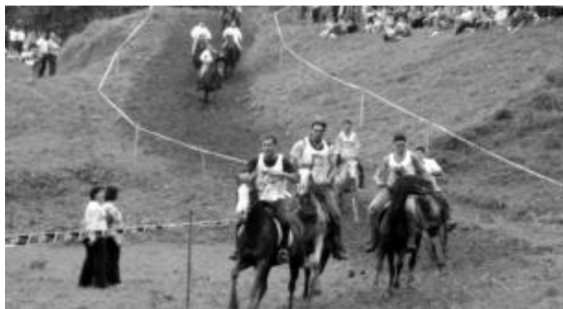
Bidarian urtero egiten den zaldi lasterketa ligaxkan puntuak lortzeko baliagarria izango da. O.ESKIXTABEL

Ligaxkan eskualdeko zazpi parte-hartzaile ariko dira; lehenengo lasterketa etzi, igandean, izango da Getarian