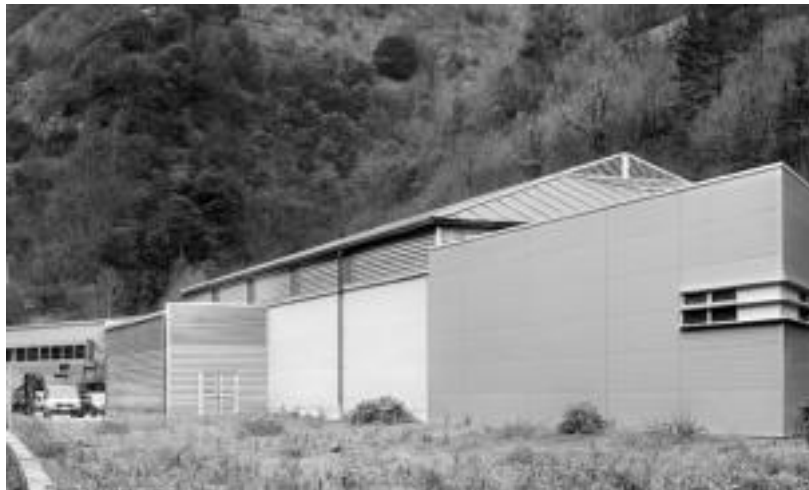
2003ko uztaileko sutearen ondoren itxura berriarekin ageri da konponketa lanak amaitu eta gero.

Lantegi zaharra handitu eta aldamenen berria eraiki dute; 30.000 botila ekoitzi ahal izango dira makina berrieekin