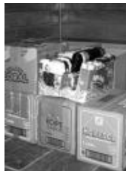
Iaz ere egin zen bilketa. HITZA

Kirol Kultur Etxean aurkitzen den KZgunea arratsaldetan irekitzen zen orain arte; astelehenetik, urtarrilaren 17tik, aurrera, ordutegi berria izango du. Goizez zein arratsaldez egongo da irekita. Astelehenetik ostiralera bitarte, egunero egongo da zabalik. Orduetegiari dagokionez, goizez 10:30etik 12:30era eta, arratsaldetan, 16:30etik 19:30era. Orduetegi horretan, beraz, KZguneako instalazioak erabiltzeko aukera izango dute alegiarrek.