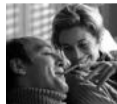
Filmeko irudi bat.

Leitzako zinema-aretoan, gaur, gaueko emanaldian, 22:30ean zehazki, Mar adentro filma eskainiko dute. Igandean, berriz ikusteko aukera izanen da, ohi denez, 19:30etik aurrera. Alejandro Amenabarrek, besteak beste, Jabier Bardem eta Belen Ruedarekin egindako lan honek, arrakasta izugarria lortu zuen hasieratik eta sari asko jaso ditu eta beste hainbatetarako izendatua izan da. Filme hau, duintasunez hiltzeko eskubidea aldarrikatuz, Ramon Sampedro galizarrak egindako borrokan oinarrituta dago. Eta egun hauetan berriz ere, kasu haren inguruko berriak agertu dira prentsan.