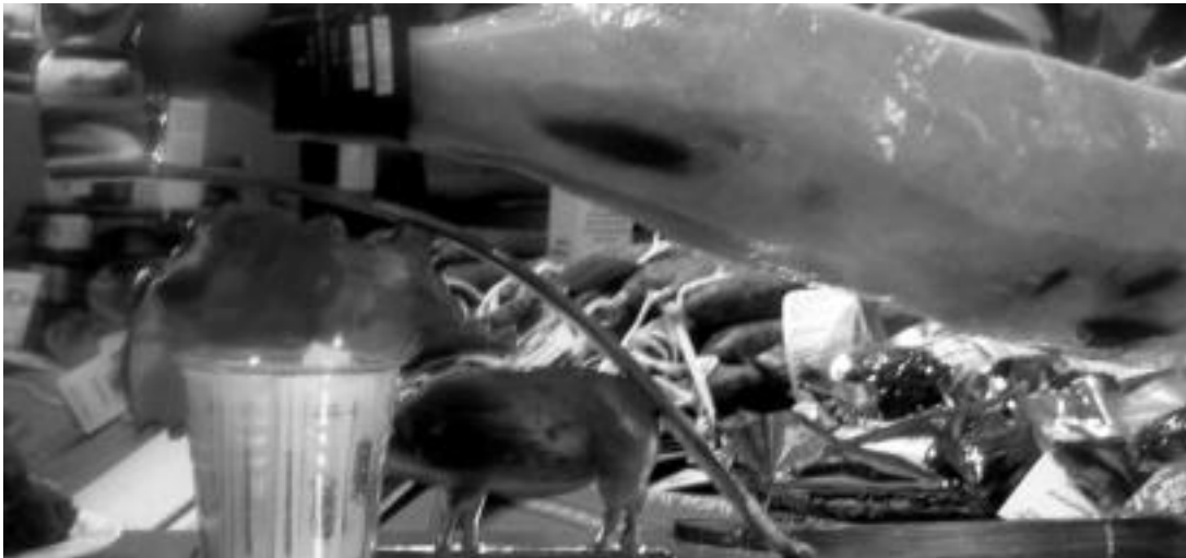
Pello Urdapilletak Bidanian ekoizten duen Euskal Txerriak arrakasta handia izan du Turinen; argazkian, urdaiazpikoa, txorizoa, xolomoa...