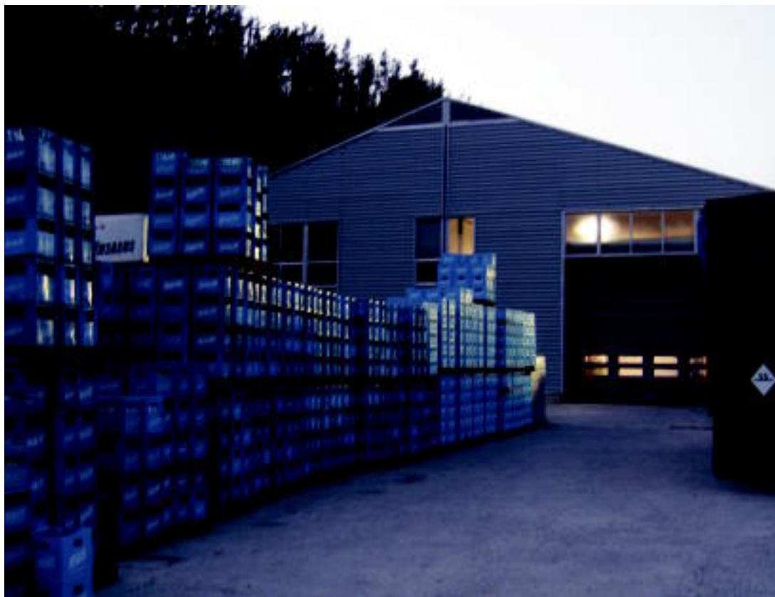
Insalus ur fabrika berrituan lanean hasi dira duela urte eta erdiko sutearen ondoren; atzoko irudia, Lizartzan.

URA ▶ Urte eta erdian Galizia eta Frantziako ura erabili behar izan dute; orain berriro, Lizartzakoa ▶ 6