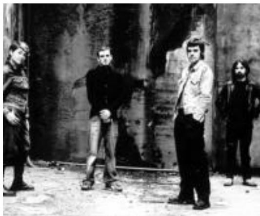
Kokein taldea; gaur eskainiko dute kontzertua Bonberenean, Seg Sound Killers taldearekin batera, 22:30etik aurrera. WWW.KOKEIN.COM