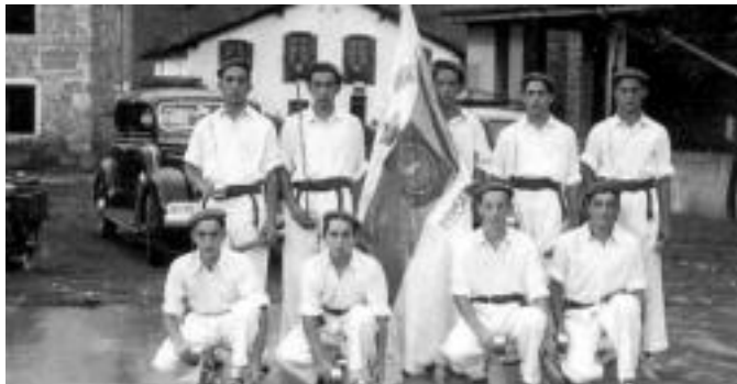
50. hamarkadan Anoetan dantza-sokan atera zen taldea. HITZA

Jatorriari eta interpretazioari dagokie-