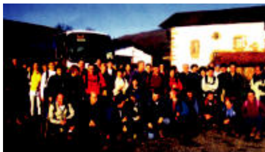
Aizkardi mendi elkartearen ibilaldi batera joandako mendizaleak. HITZA

Euskal Herriko hiriburuak uztartzen bukatuko dute aurten ▶ 4