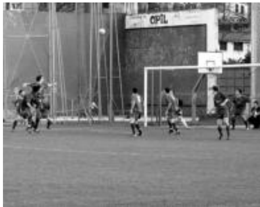
Gol aukera oso gutxi izan ziren atzoko partidaren zehar. O. ESKITXABEL

Lidergoari eusten dioten arren, haserre agertu ziren tolosarrak arbitroaren lanarekin: «60. minutuan, EHU-ko defentsak eskuarekin ikutu zuen baloia eta arbitroak ez zuen penaltia pitatu; beranduago, Lasa atezainaren aurrean bakarrik aurkitzen zen eta atezainak falta egin dio eta hori ere ez du pitatu arbitroak», esan du delegatuak. Bigarren zatian, gol aukerak oso eskasak izan ziren.