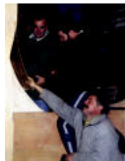
Karroza bat prestatzen. N.LATABURU

ENTSEGUAK ▶ Astialdi taldeak eta danborradak hasi dira bere emanaldiak entseatzeko ▶ 4-5