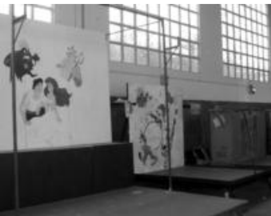
Lari handia dago oraindik egiteko hilabete honetan. Aurreko urteko karrozak betetzen dute oraindik Ferialdekoa. NEELIA LATAURU

Otsailaren 3an hasiko dira aurtengo Inauteriak Tolosan; hori dela eta, karroza eta konpartsa gehienak hasi dira dagoeneko lanean, ordurako dena prest izan ahal izateko