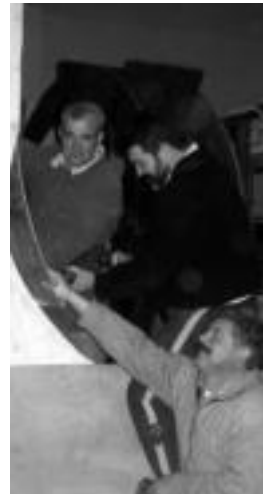
Jendea gogor ari da lanean karrozak erakitzeko eta moldatzeko. A. L.

duz aintzat. Urteak joan ahalak, gero eta zailago da originaltasun lortzea, baina gogor aritzen dira denak hau lortu ahal izateko. Alde batetik, mozoorarkin bat doan musika hartzen dute, aliala eta denentzat dantzagarrira izaten dena. Ondoren, dantza bera asmatzen dute, oso zaila ez daitekela izan kontuan hartuz. Eta hasi ez direnak ere, ideiak eta dantzak prest dituzte gaitzetan erakusteko. Gehienak asteburu honetan hasiko dira gorpuzta astintzen eta gaitzetan dantzaren pauso guztiak erakusten.