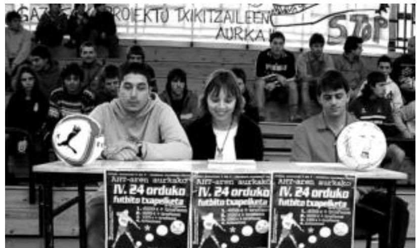
Lehenengo partida hasi aurretik prentsaurrekoa egin dute antolatzaileek kantxan. HITZA

Antolatzaile lanetan ari diren Gazte Asanbladakoek prentsaurrekoan «Udalak jarritako oztopoak» salatu dituzte