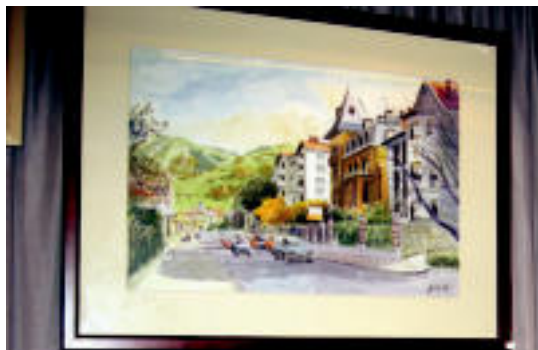
Tolosako San Frantzisko kalearen ikuspegi bat.

Vilabona. Unibertsolariak. 17:00etan Gurean.