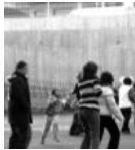
Dantza taldeak ere gogor hasi dira bere lehenengo entseguekin. A. L.

Eta garaiek eskatzen duen legez, denek dute buruan ideien bat edota mozoorren bat, zein baino zein berriztaila. Aranzabalek, azaldu digutenez, dienez artean pentasutako izan da. Gehienetan, egun batzuk lehenago elkartzan dira eta bakoitzak bere ideiak pro-