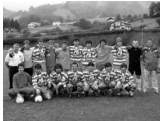
Lehendabiziko lekuaren bila doaz Aurrerakoak. JAIONE ASTIBIA

Aurrera futbol taldekoek altsasuarrei errebantxa hartzeko aukera dute biharkoan