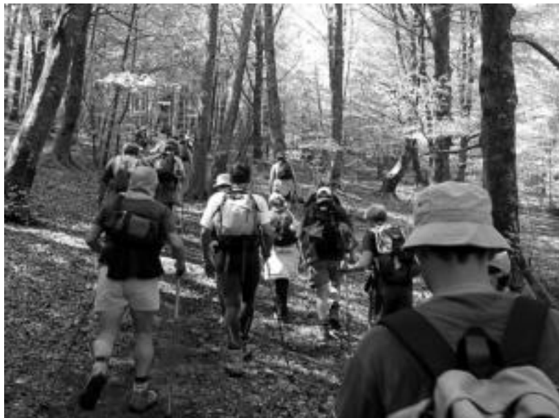
Mendi irteera hauek edozeinek egiteko modukoak direla azpimarratzen dute antolatzaileek.

Irteeren egutegia atera du Alpinok; hilaren 16an da lehena