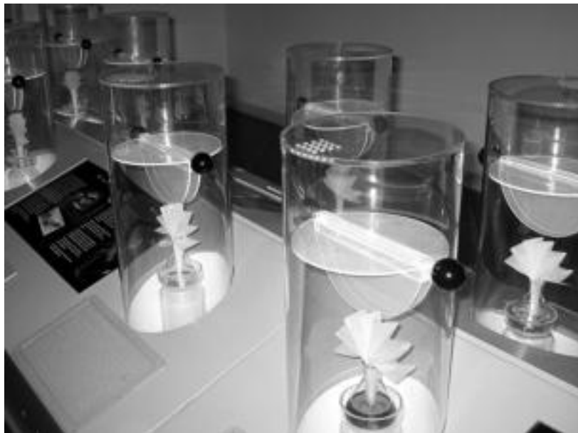
Hirurogei esentzia inguru usaintzeko aukera dago Aranburu Jauregiko erakusketan. IÑIGO TERRADILLOS

Hirurogei esentziek osatzen dute erakusketa; datorren larunbata, urtarrilaren 15a, bitarte egongo da zabalik