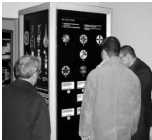
Norberaren gustuko usainaren berri ematen duen panela.

Gustuko kolorea aukeratzeko, norberaren izaeraren berri eta gustuko usaina ematen