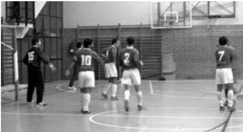
Areto futboleko jokalaririk ibartarrek urte berria, indar berriz hasiko du, ziur. iÑIGO TERRADILLOS