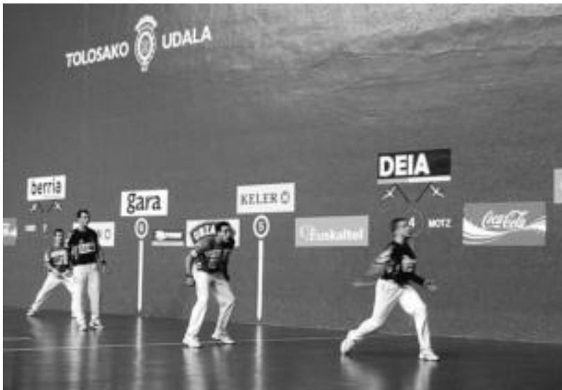
Goñi III.a, Obxandorena, Irujo eta Olaizola II.a; gogor borrokatu ziren laurak atzo, Beotibarren. LEIRE MONTES