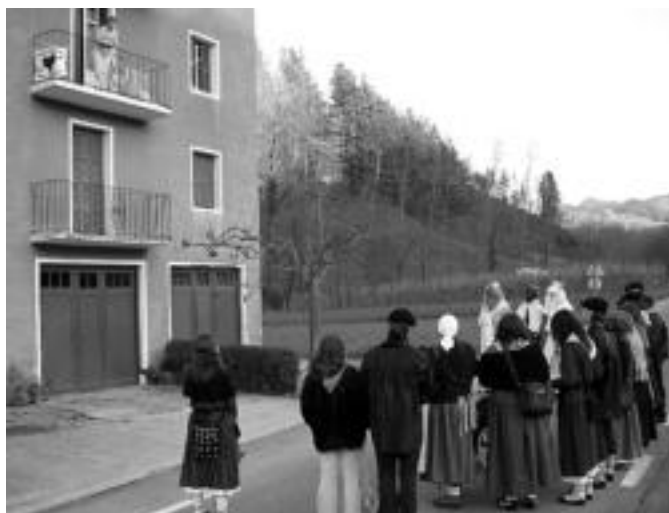
Amezket. Errege Magoek Gazte Taldekoen laguntza izan zuten; Ugartetik abiatu eta etxex-etxe Gabon eskean aritu ziren. Iluntze aldera iritsi ziren herrira. O.ESKIXABEL