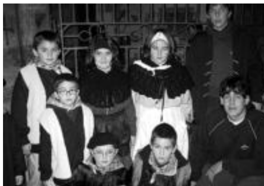
Jaiotza lehiaketan sari nagusiak jaso zituzten haurrak. I. GARCIA

Hiru mailatan banatu dute lehiaketa. Hiru eta sei urte bi-