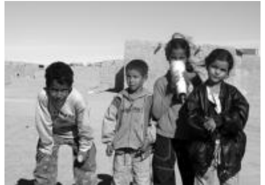
Saharako haurrak, Aaiun-eko kanpamenduan.

Tolosako Udalak 300 euro inguruko diru laguntza emango die herriko zenbait talderi