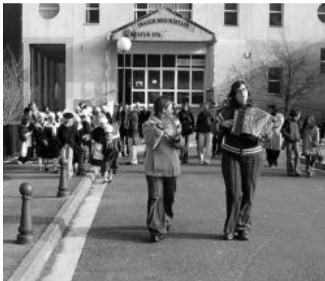
Alegia. Kultur Ebetik abiatu ziren herriko dantzariak kalejiran, aurretik trikitalariak eta atzetik soinu-joleak zituztela; goizean zehar, emanaldiak eskaini zituzten. O.ESKIXABEL