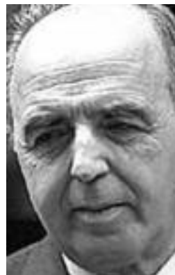
Enrique Rodríguez Galindo.

2004ko urriaz geroztik etxean ari zen Galindo zigorra betetzen, «bihotzeko gaitz larriari