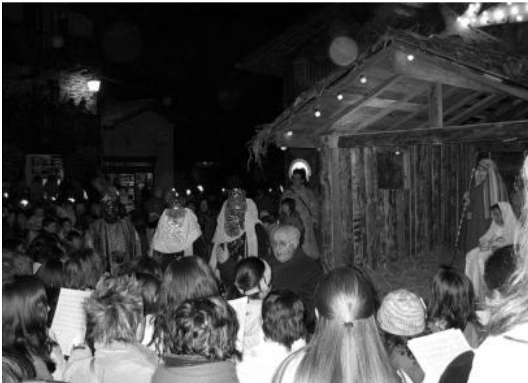
Leiza. Jaiotza bizidunaren aurrean abesbatzak bere kanta eskaini zizkien Errege Magoei, atzo arratsaldean. JAIONE ASTIBIA

Gutuna idatzi arren, eskatutako opariaren berri zuzenean ematea izaten dute gustuko txikienek; horretarako aukerarik ez dute galtzen. Gurasoei esku-tik heldu eta Erregeak ikusteko hitzorduetara agertzen dira. Atzo ere ez zuten huts egin.