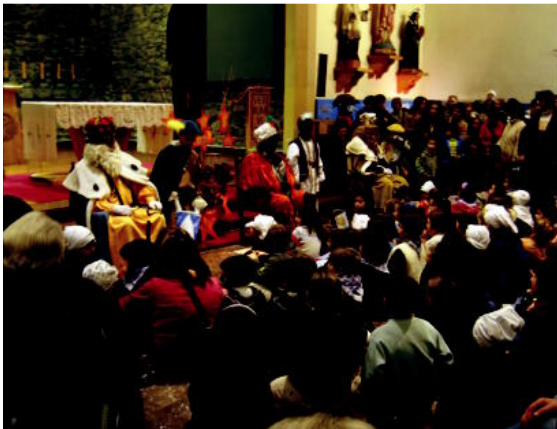
Errege Magoak Tolosako lurreamendi egoitzan, bertan bildutako haur eta helduez inguratuta atzo arratsaldean. IMANOL GARCIA

IRURA ▶ Udalak antolatutako jaiotza lehiaketako sariak banatu zituzten atzo haurren artean ▶ 2-3