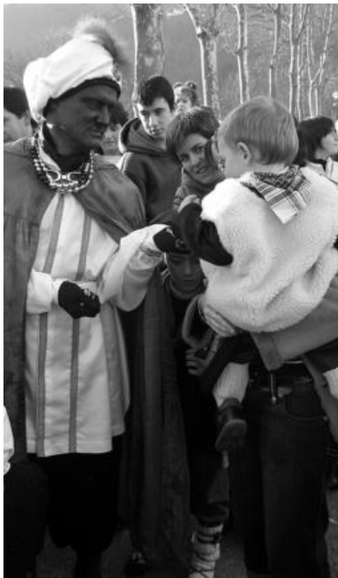
Tolosa. Atzo arratsaldean, lurramendi egoitzan izan ziren Erregeak; haurrei eta adineko pertsoneri opariak eta goxokiak banatu zituzten. IMANOL GARCIA

auzo bakoitzean geldialditxoak egin eta emanaldia eskaini zuten. Larraitz auzoko bi enparantzetan, Kalebeheran eta, amaitzeko, udaletxe aurrean. Errege bezperan, arratsaldez atera ohi izan dira dantzariak; aurretik, goizez ateratzeko proposamena egin dute irakasleek «dantzari gaztetxoak motibatuzko baliagarria izan daitekeelakoan». Saioa amaitu ondoren, bazkaltzera joan ziren dantzariak, irakasleak, trikitalariak eta soinu-joleak.