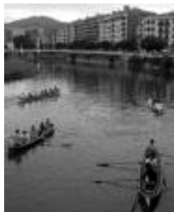
Arraunlariak, sanjoanetan. L. M.

Kontuak kontu, esan liteke gero eta indar handiagoa hartzen ari dela arrauna Tolosaldean. «Berrindartzen ari dela esan beharko genuke, arraunarekiko zaletasuna aspaldikoa baita inguru honetan». Horren aurrean, arraun elkarre bat sortzeko asmotan dabilta astero-astero Oria ibaiko uretan hara eta hona bateletan ibiltzen direnak. Arraun federazioan izena eman, eta aurrerantzean izen horrekin jardungo dute bertako arraunlariek.