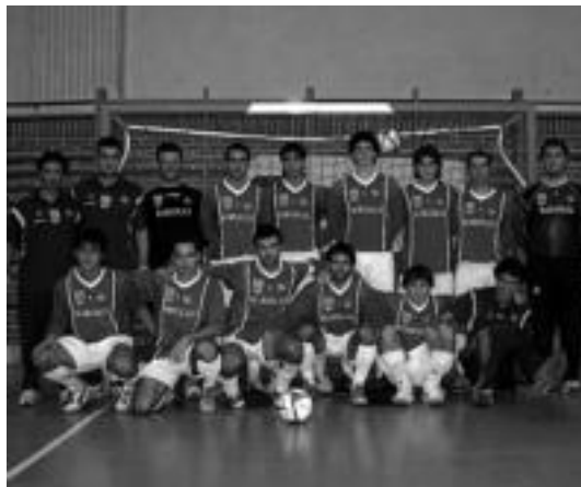
2004-2005 denboraldiko Ibarra areto futbol taldea.

Nagusiek maila mantentzea espero dute; erakundeen, komunikabideen eta jarraitzaileen laguntza eskatu dute