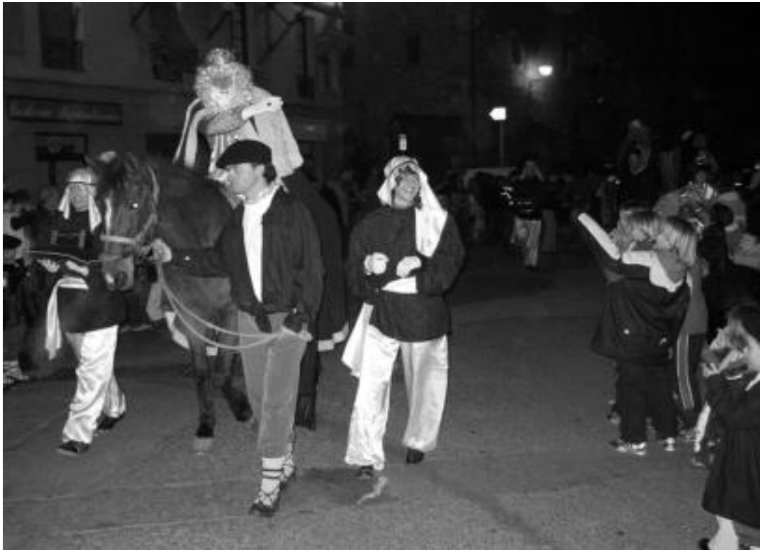
Tolosa. Santa Klaran eskaintza egin eta gero, erdialdera abiatu ziren Erregeak, bidean zeuden haurrei agurtuz. OLAIA ESKITXABEL