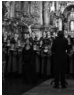
Tolosako Orfeoia. J. SAIZAR

Mokoroak Tolosako Orfeoia sortu zuenetik mende osoa bete denean, aurrera darrai taldeak. Orain sei urte jarri zuten tolosarrek berriz ere abian, eta