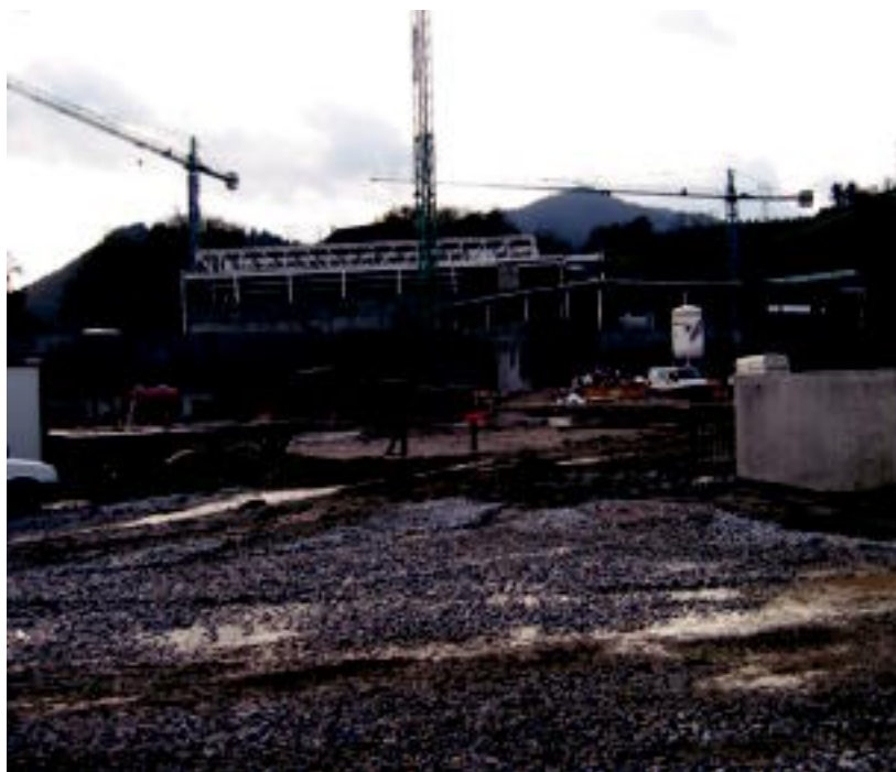
Usabalgo kirolgune berriaren lanen egoera, atzo arratsaldean.

TOLOSA ▶ Igerilekua ekainean irekiko du Udalak eta gainontzeko zerbitzuak udazkenerako nahi dituzte ▶ 2