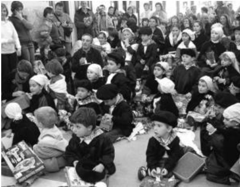
Altzoko haurrek eta gatzetxoak gustura ireki zituzten Olentzerok eskura emandako opariak. O.ESKITXABEL