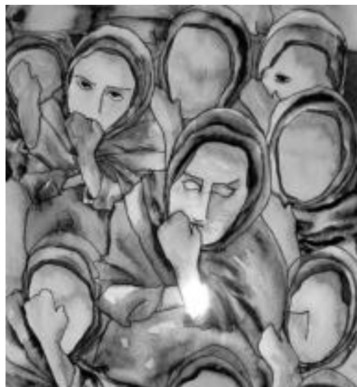
Izengabeak erakusketako koadroetako bat. I.TERRADILLOS