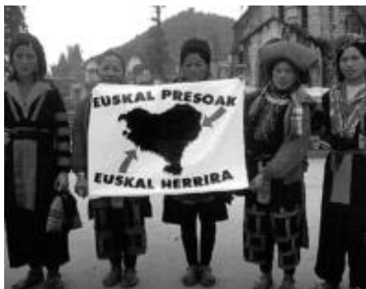
500 balkoi banderolekin ikustea espero dute Herri Ekimenekoek. HITZA

Balkoietan banderolak zintzilikatzea eskatu dute; bihar manifestazioa egingo dute, presoen egoera salatzen