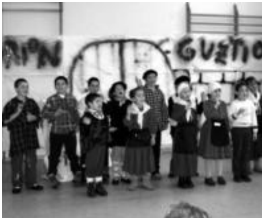
Aresoko eskolakoek hainbat kantu ere egin zituzten, eta ez euskaraz bakarrik, ingeleraz ere bai, Hello father christmas kasu. JAIONE ASTIBIA

Leitza eta Aresoko eskoletan aurtengo azken eskol-eguna ospatzeko Eguerritako jaialdiak egin dituzte, Areson Olentzeroaren sartu-atera eta guzti