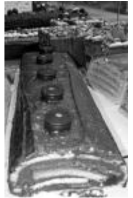
Cava turroi berria. HITZA

duen familia tolosar honen azken sorkuntza da cava turroia. Tradizioa eta berrikuntza uztartu dituen bide luze baten azken fruitua.