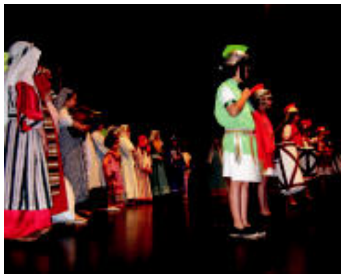
Erromatarren pregoia eta agindua, antzerkiaren hasieran. Atzean, herritarrak, azalpenei adi. LEIRE MONTES