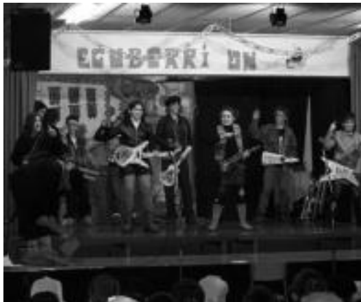
Aretoa bete ikuslerekin, festa ederra antolatu zuten Erletan, maila guztietako ikasle, irakasle zein gurasoek ere. Irudian karaokea. J. A.

Jaialdia bukatzerako, ordea, Olentzero herrira zetorrelako hotsa iritsi zen hara eta, trikitalariak lagun, bidera atera ziren, ttikienak eta harrituagoak. Ongietorria egin eta eskolan bertan, banan-banan ume guztiak