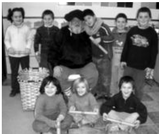
Olentzeroren ondoan Lizartzako ikasleek ateratako argazkia. HITZA

Lizartzara abiatu zen ondoren; han zain zeuden eskolako ikasleak. Bertan, bere ohiko lanean aritu zen: Opariak banatzen, trukean muxuren bat edo beste jaso zuen. Azken egun hauetan Olentzerori abesteko entseguak egiten aritu dira eta bihar herriko kaleetan zehar ibiliko dira baserriarrez jantzita. Gurasoek, berriz, haurrek indarra hartzen joateko txorizoa prestatuko dute.