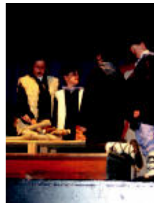
Artzainak eta Olentzero begiorria, suaren inguruan, solasean. LEIRE MONTES