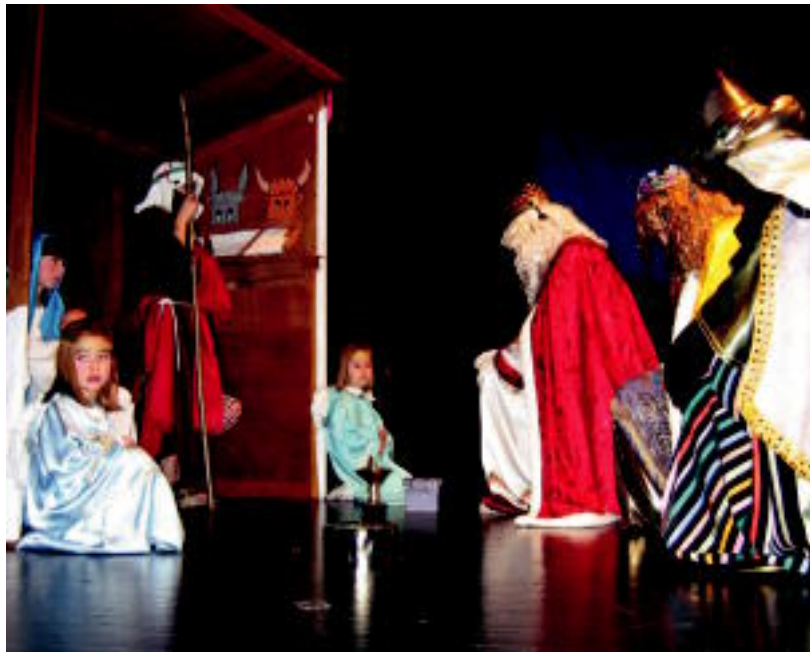
Meltxor, Gaspar eta Baltasar erregeak, Belengo atarira opariak eramaten. LEIRE MONTES

TOLOSA ▶ 'Oi Bethlehem' taularatu zuten herenegun Hirukide ikastetxeko ikasleek, Leidorren; Gabonetan egiten duten antzezlanak 25 urte bete ditu