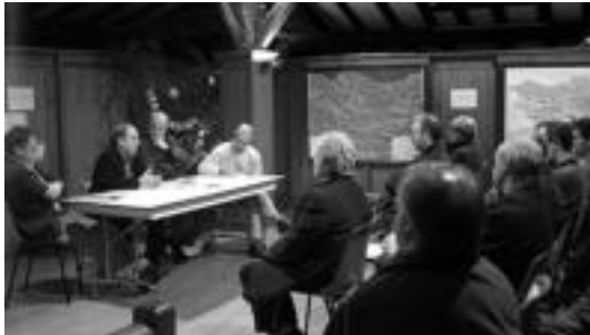
Iaz, euskalgintza izan zuten hizpide, besteak beste. O.ESKITXABEL

Kultur Batzordeak, Loatzok eta Elordi elkarteak antolatu dituzte aurtengo 'IX. Olentzerotan jakinminez'-eko ekitaldiak