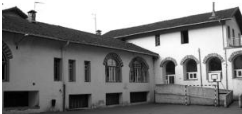
Teilatua oso-oso berritu behar dute eta jolastokiaren drainaketarako hoditeria ere jarriko dute. JAIONE ASTIBIA

Lanak dirauten bitartean irakasle eta ikasleek Erasonen izanen dituzte eskolak