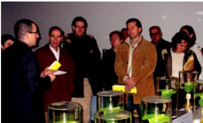
Udal agintariak eta herritarrak antolatzaileen azalpenak entzuten, atzo Aranburu Jauregian. INIGO TERRADILLOS

TOLOSA ▶ Atzo zabaldu zen Aranburu Jauregian 'Bete sudurrak' erakusketa; esentzia desberdinak usaintzera gonbidatzen dute La Caixak eta Udalak