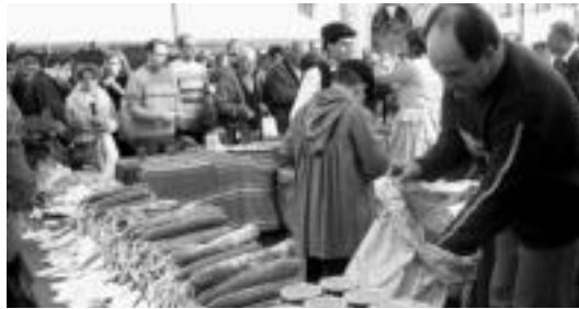
Lehendabizikoz, egun osoan izango da aurtengo Gabonetako Azoka. i.e.

Trianguloan eta Zerkausian urteroko moduan izango diren