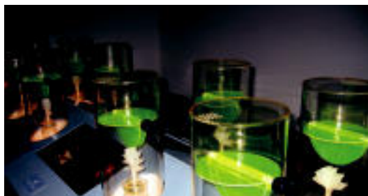
60 esentzia eta lurri natural desberdin usaindu daitezke. I.TERRADILLOS

«Jasmina oso baliotsua da, kolonietako marka onenek erabiltzen dute, baina oso proportzio txikian, osagai gehie-