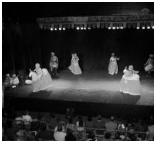
Musika eta dantza uztartu zituzten atzoko emanaldian. O.ESKITXABEL