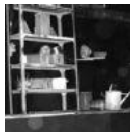
Txotxongiloak, Tolosan.

noel de Oliveira zinema zuzendariaren filma hilaren 9an eskainiko dute, Leidor zinema aretoan, 21:30etik aurrera. 'Memories of murder'. Bony Joon-hoo zinema zuzendariak gidatutako filmak zuzendari-tzak emandako Zilarrezko Kontxa eta FIPRESCI saria eskuratu ditu, besteak beste, Donostiako Zinemaldian 2003an, eta Leidor zinema antzokian eskainiko dute, hilaren 16an, 21:30etik aurrera. 'Open range'. Kevin Costnerren filma hilaren 23an eskainiko dute, Leidor zinema aretoan, 21:30etik aurrera. 'Las invasiones barbaras'. Hilaren 30ean, ostegun, eskainiko dute Leidorren Denys Arcand zuzendariaren filma. Publikoaren saria (Valladolid, Espainia 2003), bigarren mailako emakumezko aktoreari saria eta gidoi onenari saria (Cannes 2003) lortu ditu, esaterako. 21:30ean izango da filma.