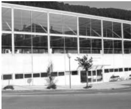
Kirol instalazioen kudeaketarako baldintza-plika zehatzago aztertu eta begiratzeko asmoz, onartzeko gelditu zen ostiralean. J. ASTIBIA

Baina erabakiak hartu ere hartu zituzten, bide zati bat zabalteko egindako partikular