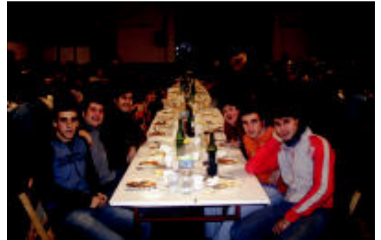
Giro ederra eta ikasle garaiko kontuak izan ziren nagusi. HITZA