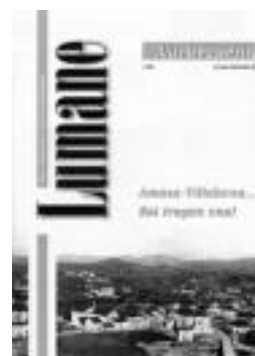
Aldizkariaren 0 zenbakia. HITZA

Asteburu honetan banatuko den lehenengo zenbakian musikaren gaia jorratuko da. Musikak Amasa-Villabonan izan duen garrantzia aztertuko da bertan eta herritarren hainbat pasadizo bilduko dira. Ale guztiak bezala, zortzi orrikoa izango da eta parte-hartzaileen adierazpenez gain, euren egungo argazkiak eta garai bar-tekoak azalduko dira.