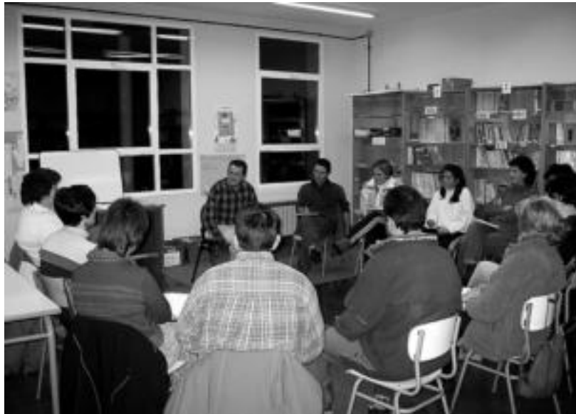
Jose Francisco Amiama eta Guraso Eskolako kideak astelehenero saioan. MADDI SOROA

Guraso Eskola seme-alaben inguruko hainbat gaitaz eztabaidatu eta hausnartzeko gunea