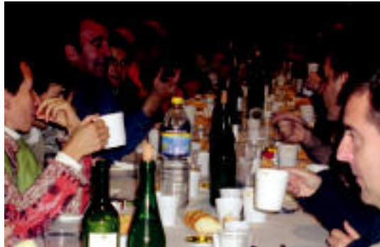
Lehenengoetako belaunaldiko ikasleak afarian. HITZA

Kasinoa (helduak). 20:30 eta 22:30. Mano y contramano (Mexico): Ubu reciclado .