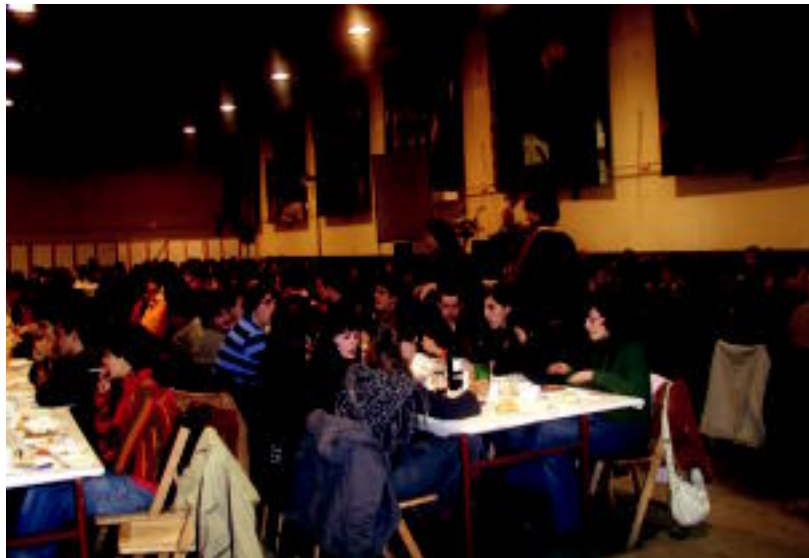
Bostehun ikasle ohi inguru elkartu ziren larunbat gauean Tolosako Ferialekuan. HITZA

TOLOSA ▶ Laskorain Ikastolako 500 bat ikasle ohi elkartu ziren larunbatean Ferialekuan; bideoa eta musika izan ziren ekitaldian