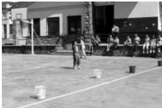
Eguberritarako oporretan eserita egoteko betarik ez dute izanen. J. ASTIBIA

Epea bukatu eta jasotako proposamen guztien artean Euskara Zerbitzuak bere iduriko hoberena dena aukeratu omen du. Gerta liteke, banaka-