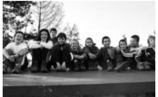
Loatzomendira egindako irteerara joandako haur talde bat.

Aizkardikoek azken bost urteetan hurrekin egindako mendi irteerak erakutsiko dituzte