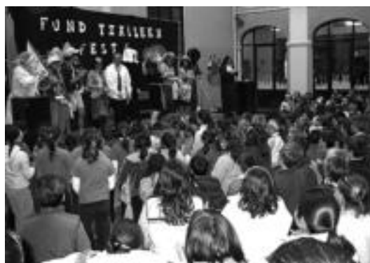
Jaialdi arrakastatsua egin zuten atzo Jesuitinetan; irakasleek —taula gainean— eta ikasleek dantzan eta jai giroan amaitu zuten eguna. L. M.

Maitasuna da zoriona eta bakera lelopean , adiskidetasuna, elkarbizitza eta errespetua lantzea izan dute xede Zaindarien Asteko ekitaldiek. ◀