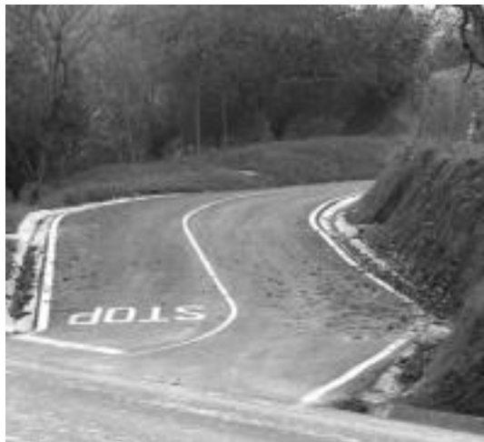
Ikaztegiatik Kutturru atsedenkura joateko bidea. O. ESKITXABEL