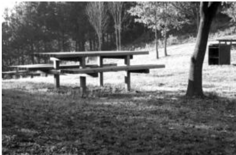
Zuhaitzez inguratutako parajea, mahaia, aulkiak eta erretegiak jarri dituzte. O. ESKITXABEL

Autoak uzteko aparkalekua egokituko dute bitartean; zuhaitz gehiago ere landatuko direla azaldu du Udalak