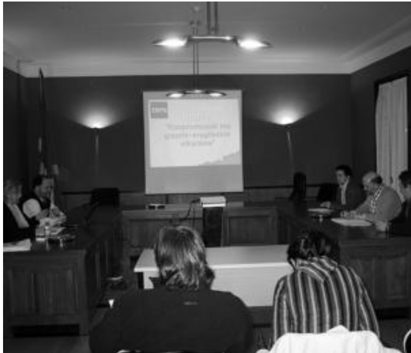
Asteazkenean Ibarako udaltxean komunikazio planaren zirriborroa aurkezten. MADDI SOROA

Herenegun izan zen komunikazio planaren zirriborroaren aurkezpena, urte berrirako martxan jartzea espero dute