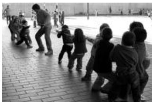
Txikienek jolasak izan zituzten jolastokian; sokatiran, irakaslea bera baino indartsuago ziruditen batzuek! LEIRE MONTES