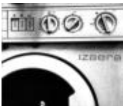
10 programa gaiztokian. HITZA

«Maketan agertzen zen ahots zakarrak zein baxu distorsionatuek bertan diraute, nahiz eta bateriaren erritmoak azkarragoak eta dinamikoak diren. Kitarrek zentzu