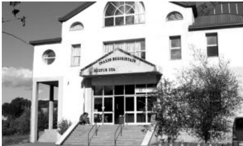
Datorren astean egingo dituzte Kirol Kultur Etxeko langileak aukeratzeko probak. O.ESKIXABEL

Hogeita hamalau pertsonak eman dute izena kultur teknikari eta Kirol Kultur Etxeko harreragile lanpostuetarako