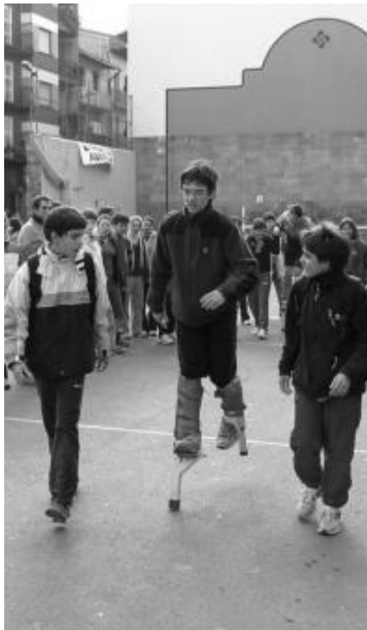
Hankapaloak izan ziren egindako probetako bat. I. GARCIA

Atzoko topaketan, alde bate-tik joko ezberdinak landu zituzten. Bestalde, bertso eta orientazio tailerra egin zuten. Euskal kulturarekin lotuta hainbat joko egin ziren, baitzuetan abilezia eta besteetan indarra izaki erabili beharreko gaitasunak: sokatira, lokotxak, txingak, hankapaloak, giza froga eta boloak. Bertso tailerrean, talde guztiaren artean asmatu behar zuten bertso pareta eta gero jende aurrean abestu.