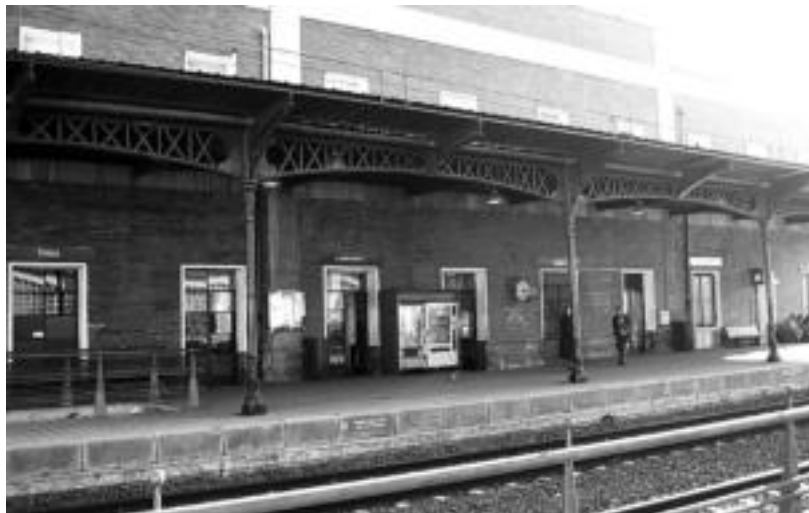
Tren geltokiaren barrua eta inguruak berritu nahi ditu Renfek laster.