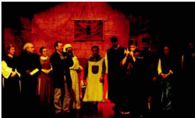
Saioaren ondoren, Zaragozako Gorren elkarteak opari bat eman zion Gainditzen-eko lehendakariari. HITZA

TOLOSA ▶ Zaragoza eta Aragoako Gorren Elkarteak 'Teruelgo maitaleak' antzezlan eman zuten zeinuen hizkuntzan; 170 pertsona gor izan ziren ikusten