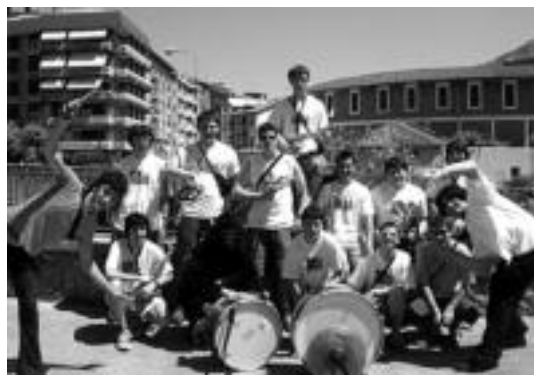
Bonbereneako txaranga, iazko urteurren ekitaldian. WWW.BONBERENEA.COM

Bonberenearen V. urteurrena ospatzeko, ekitaldi ugari antolatu dituzte egunotan