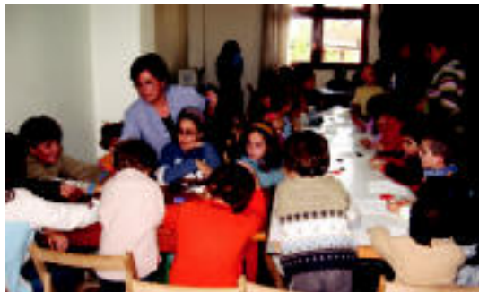
Aduna. Haur ugari inguratu ziren eskulanak egitera. I. GARCIA