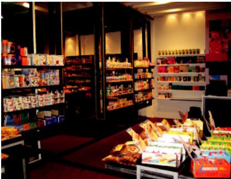
Gorrotxategi dendaren diseinu deigarriak oso harrera ona izan du bezeroen artean. NOELIA LATABURU

Duela bi aste Tolosako Nafarroa etorbidean ireki den Gorrotxategi biologikoa dendak era guztietako produktu biologikoak eskaintzen ditu