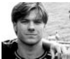
XABI ALONSO FUTBOLARIA

«Liverpoolen gauzak ondo egiteko itxaropena nuen eta, oraingoz, ezin dut kexatu»