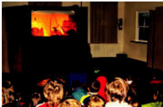
Berastegi. Eskolan egindako haur ikuskizuneko une bat.

TOLOSALDEA ▶ Eskualdeko hainbat herritan ekitaldi asko burutu ziren atzokoan: musika, haur ikuskizunak, taberna inaugurazioak, besteak beste