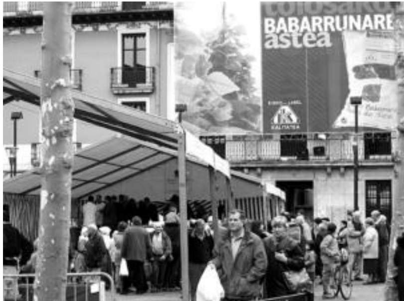
Jendetza bildu zen atzo Triangulo plazan bertako produktuak eta babarrun lehiaketa ikusteko. I.TERRADILLOS

Lehia oso gogorra izan zen eta azkenen irurarrak irabazi zuen; lehen aldiz egin zen enkantean 1.100 euro ordaindu ziren irabazlearen lakariarengatik