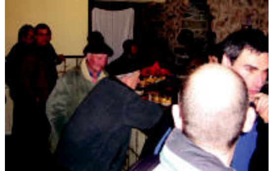
Gatzelu. Kontzejuak atek ireki zituen herenegun. I. TERRADILLOS