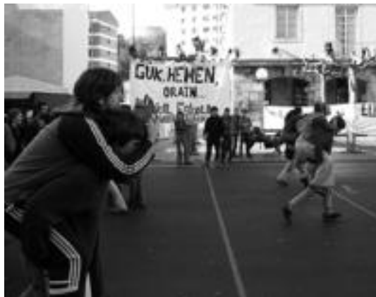
Lagunarteko jokoetan giro ona izan zen nagusi. Ondoren bazkari herrikoa egin zuten Ikastolako arkupetan.

Egun guztian zehar ekitaldi ugari burutu ziren Ikasle Abertzaleek antolatuta, baina batez ere kontzertu erraldoia entzuteran joan ziren ehundaka gazte