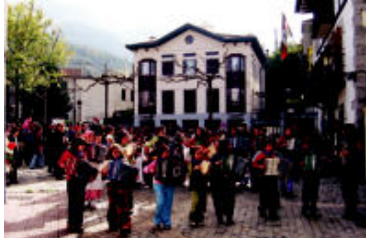
Irua. Loatzoko ikasleen kalejira burua plazatik ateratzen. I. GARCIA

Leitza. Glup marrazki bizidunen filma 17:00etan zinemara. Tolosa. Leidorren Doraemon gladiadorea gaur 17:00etan eta Resident Evil 2 Apocalypse 19:30ean eta 22:30ean, gaur eta bihar.