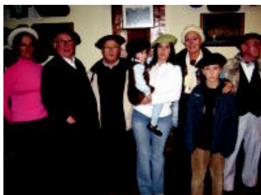
Txapela. Hauek izan ziren maila desberdinetan txapela ondoen jantzi zutenak atzo Txinparta elkartearen. I.TERRADILLOS