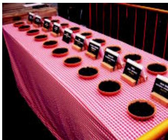
Babarruna. Aste osoko protagonista izan da; irabazlearen lakaria 1.100 euro ordaindu zuten Bartzelonako Sagardi jatetxeak. I.TERRADILLOS