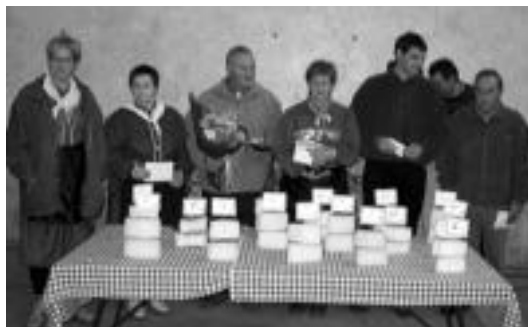
Pasa den urteko azokako gazta lehiaketan irabazleak.

Bihar, berriz, Azoka Eguna izango da 11:00etatik aurrera,