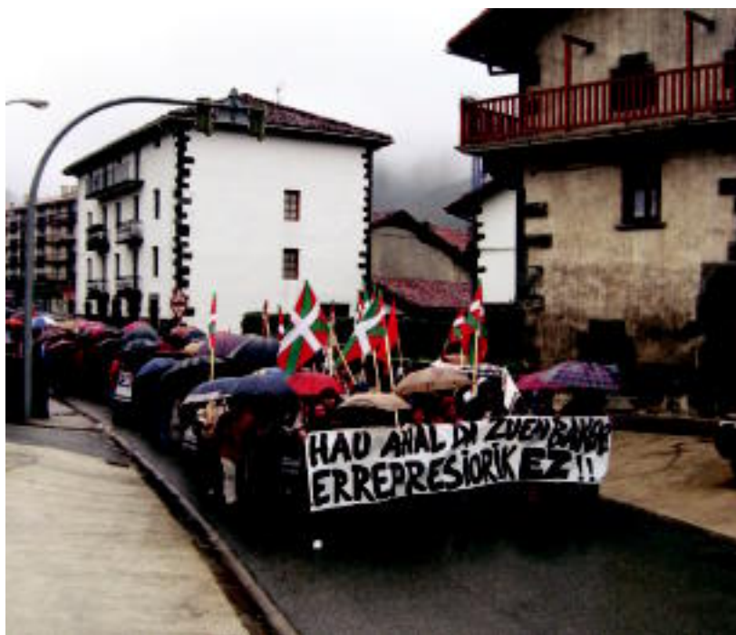
Jende asko bildu zen atzo eguerdian manifestazioan. J. ASTIBIA

PROTESTAK ▶ la erabateko geldialdia izan zen atzo eta ehundaka herritar bildu ziren manifestaldian ▶ 7