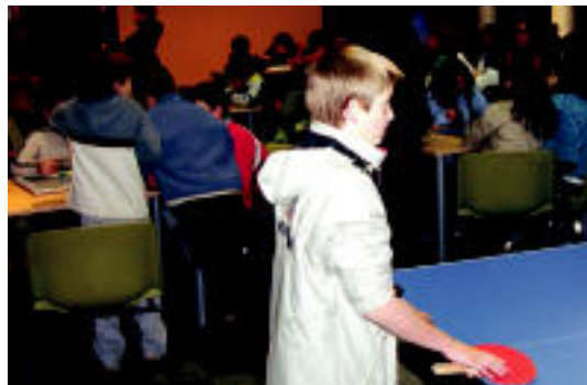
Ping-pong-ean eta beste zenbait mahai jokoetan aritu ziren. HITZA