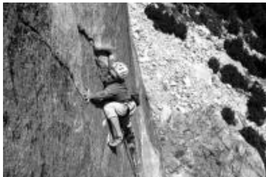
Pou anaiak beren azken eskaladen berri emango dute. HITZA