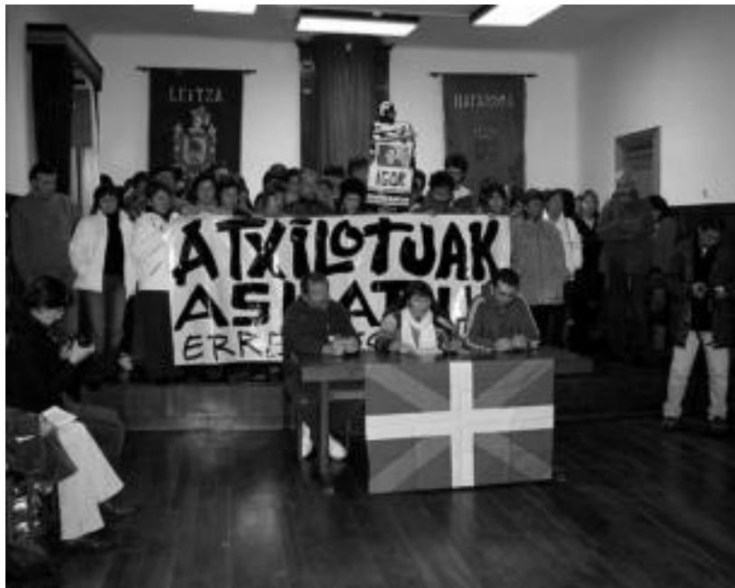
Atzo eguerdian Leitzako udaletxean eman zuten prentsaurrekoaren irudi bat. JAIONE ASTIBIA

Bi orduko geldialdia ia erabatekoa izan da eta ehundaka herritarrek parte hartu dute manifestaldian; atxiloketa eta espetxeratzeak salatu dituzte prentsaurrean