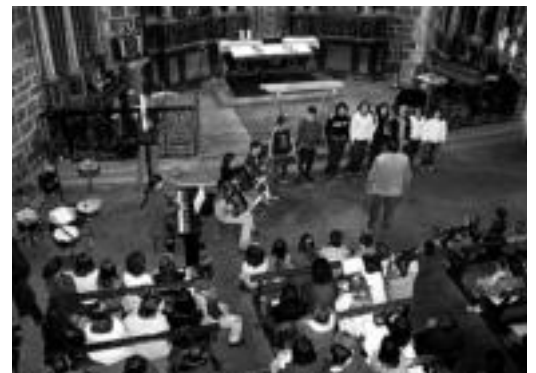
Loatzoko ikasleek emandako kontzertuaren momentu bat. I. GARCIA