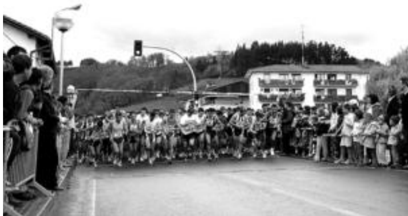
Iaz Ikaztegieta XIII. Kross Herrikoian parte hartu zuten korrikalariak irteeran. HITZA

10 kilometro egin beharko dituzte parte-hartzaileek; kamisetak, hamaiketako eta zozketarako aukera jasoko dituzte trukean; haurrek ere parte har dezakete