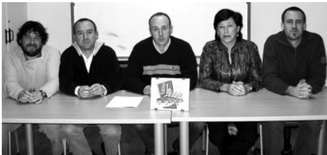
Tolosa Bizirik taldeko bost zinegotziak manifestaziorako deia eskertzeko Kultur Etxean emandako prentsaurrekoan. MADDI SOROA

Zinegotzi «ez legitimoen» dimisioa eskatu dute Tolosa Bizirik taldeko zinegotziek