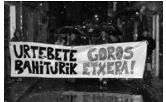
Urtebete bahiturik, Goros etxera lelopean egin zen manifestaldia. I.G.