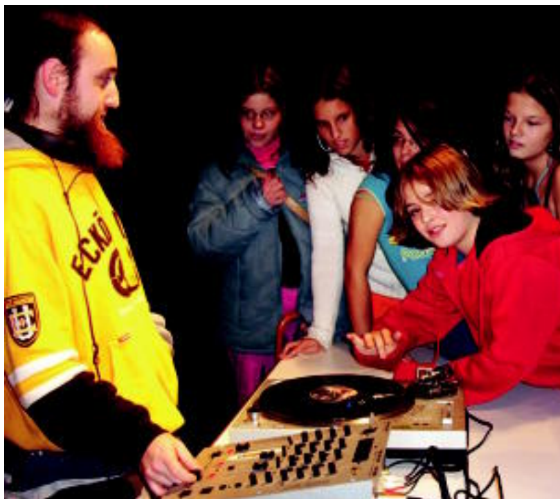
DJ-aren saioaz gozatzeaz batera ikasteko aukera ere izan zuten Gazte Topagunean. HITZA

TOLOSA ▶ Datorren igandean Txuri Urdinerako irteera antolatu dute; bihar izango da izena emateko azken eguna, Kultur Etxean