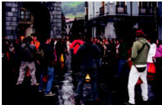
Andoaingo Zozongo taldearekin hasi zen inaugurazioa.