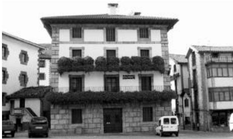
Etxetxurian, Maxurrenea herrintzat aldarrikatuko dute. ostiraleko bertso afarian.

Leitza eta Araitz-Beteluren arteko saioa izanen da, afariaren inguruan