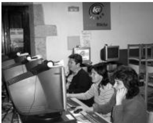
Urriko internet ikastaroko ikasleak, gustora. HITZA

Albizturko KZ guneak hainbat ikastaro ezberdin antolatu ditu urtean zehar. Oraingoan, Interneten trebatzeko ikastaroa antolatu du 16:00etatik 18:00etara edota 18:00etatik 20:00etara. Ikastaroa atzo hastekotan zen, baina taldea guztiz osatu ez denez, izena emateko epea luzatu egin dute. Informazio gehiago 943 65 06 85 telefono zenbakian.