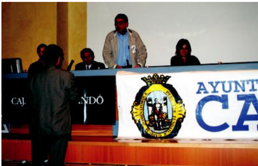
Tolosaldeko joandako ordezkariak hainbat azalpen eman zuten herriko inauterien inguruan. HITZA

TOLOSA ▶ Cadiz-en egin den inauteriei buruzko biltzarrean izan da herriko ordezkari bat, hemengo festa entzutetsuenen berri ematen