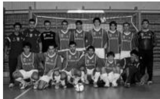
Aurtengo denboraldian Ibarra ez du zorte handirik. I.TERRADILLOS

Etxekoak dominatzen hasi zen partidua, ibartarrei pista azkarrera ohitzea kostatu zitzaielako. Zazpigarren minutuan partiduko jokaldi garrantzitsuenetakoa izan zen. Ibarra-ko defentsak botatako baloia aurrakari bati jo eta Zabalo atezainaren inguruko botatzen baloia hartzeko. Aurrelari gasteiztar batek, nahigabe, aurpegian ostikoa eman zion. Kolpearen on-