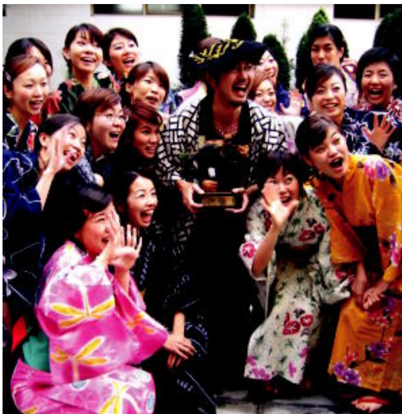
Japoniarrak, pozarren, saria eskuratu ostean Leidorren atzealdean. IRATXE ETXEBESTE

SARIAK ▶ Kubako Schola Cantorum Coralinak lortu du ikus-entzuleen saria ▶ 2,3