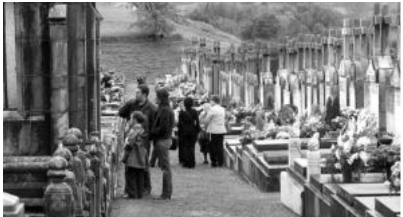
Tolosa. Eguraldi txarra egin arren, jende asko gerturatu zen herriko hilobietara. AMAIA BELAUZARAN

Hala ere, beste ohitura batzuk indarra hartzen badoaz ere, azaroaren 1ak Santu Guzti- en Eguna izaten jarraituko du, hildakoak buruan, haien oroitzapenak izateko eta haiei une berezi bat eskaintzeko eguna.