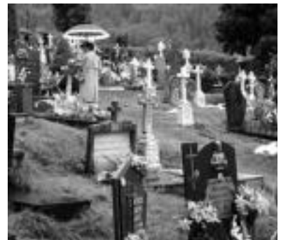
Leitza. Lorez beterik ageri ziren hilobiak. J.ASTIBIA