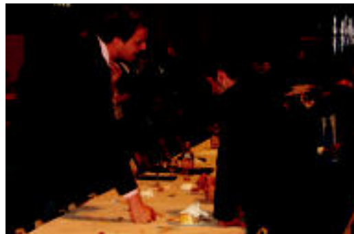
Herberehetako zuzendaria eta epaimahaiko lehendakaria. J. ASTIBIA