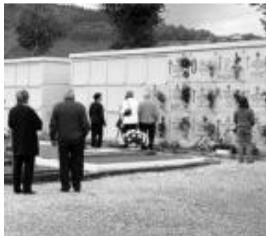
Alegia. Adin guztietako jendea izan zen. I.TERRADILLOS