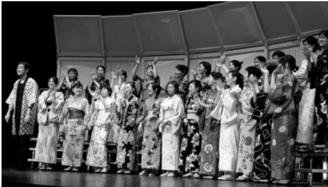
Japoniako Brilliant Harmony abesbatzako kideak, haien ohiko jantziekin, pozarren, lehiaketaren irabazle zirela jakin zuten unean.