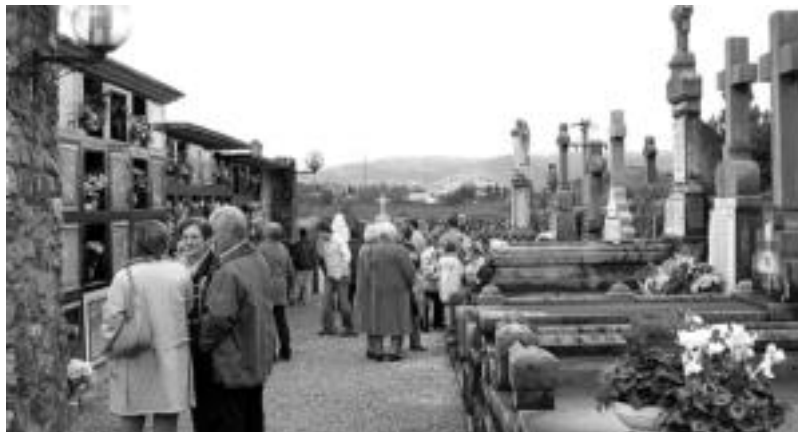
Villabona. Egund osoan zehar gerturatu zen jendea hilerriera hilakoak oroitzera. IÑIGO TERRADILLOS