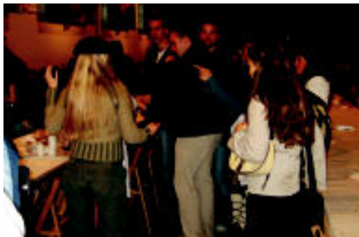
Abesbatza desberdinetako kideak elkarrekin ongi aski. J. ASTIBIA

Villabona. Gurea zinema-aretoan, 20:00etan, txirringarritako afizionatuak gai izanik, Oskar Ortiz de Guineak zuzenduta. Hizlariak: Agirrezabala, Obxotorena, Azanza eta Anton.