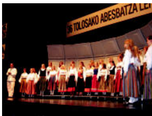
Haurretan, txinarrak garaipena ospatzen. Behean, estoniarrak . i. e.