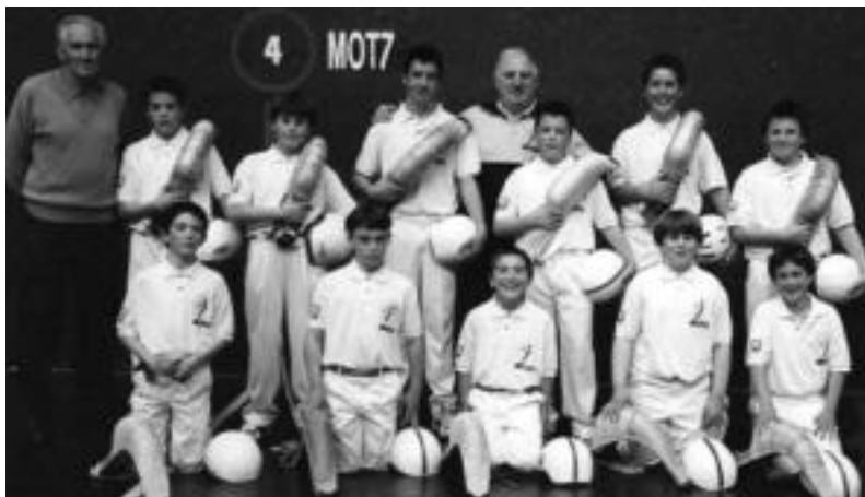
Tolosako Zesta-punta Eskolako alebin mailako haurrak, iazko denboraldian, Beotibar pilotalekuan.