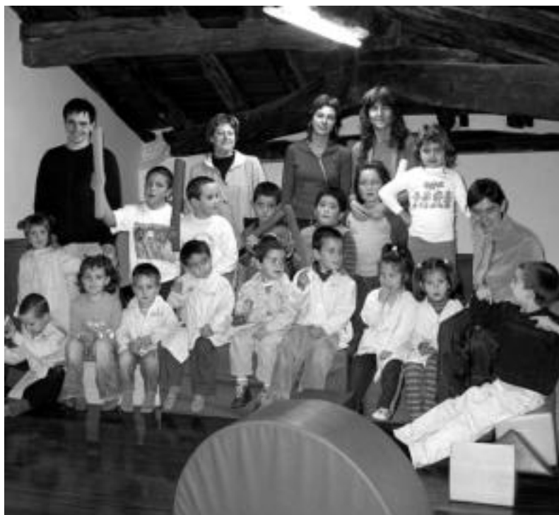
Hamasei ikasle ari dira Abaltzisketako eskolan ikasten; bost irakasleren kargu daude. O.ESKITXABEL

Azken urteak Amezketako Zumadi eskolako gelak izatetik eskola gisara funtzionatzen hasi da Abaltzisketako eskola