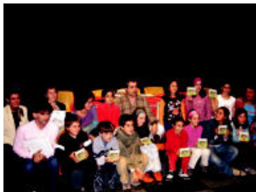
Diskoan parte hartu dutenak CDarekin atzo Kultur Etxean.

PARTAIDEAK ▶ 'Samaniego kantari: kanta zaharrak berritzeko asmoz' diskoa kaleratu dute; ikastetxeko ikasleek, irakasleek eta gurasoek hartu dute parte ▶ 3