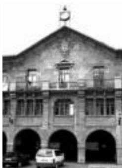
Leitzako udaletxea. J.A.

Hilabeteroko ohiko bilkura honetan, taxien zerbitzua eta mendiko hainbat puntu ere izanen dituzte mahai gainean