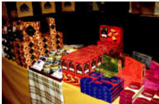
Gozokiak eta jateko gaiak arrakasta dute erosleen artean. J.SAIZAR