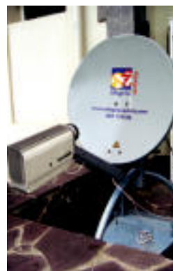
Antena. I. TERRADILLOS

Sarekide erakusketa adin guztietara dago zabaldua ▶ 6