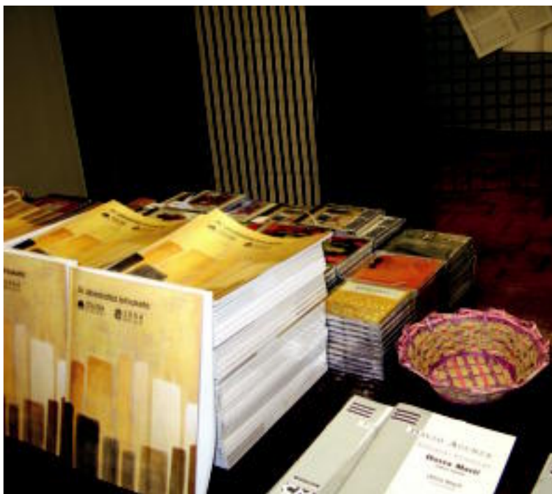
Lehiaketarekin erlazioz atutako materiala salgai dago denda: CDak, partiturak, programak... J. SAIZAR

TOLOSA ▶ Gaur zabalduko da Abesbatza Lehiaketako denda Banco Zaragozazan tokian; kanpotarrek eta bertakoek hemengo produktuak eros dezakete