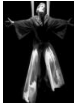
Aktorea lanean. HITZA

Antzezlanak, bestalde, ikuslearekiko konplizitatea lortu nahi du garapenaren zehar egiten diren jokuen bidez. Esistentziaren ondoren aurkitzen denaren edo ez denaren inguruko lan honetan aspertzeko aukerarik ez du izango ikustaldira gerturatzen denak.