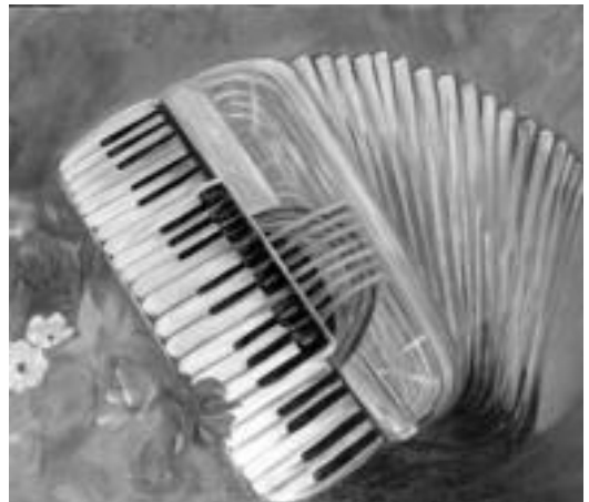
Eskusoinua. Gazte-gaztetatik hasi zen eskusoinua jotzen eta makina bat txapelketa irabazi zuen. Gazte denbora ondoren ere, soinua jo izan du haibat saio berezietan. Koadro honen handitasunak, eskusoinuarekiko duen harremana islatzen du. M. SOROA