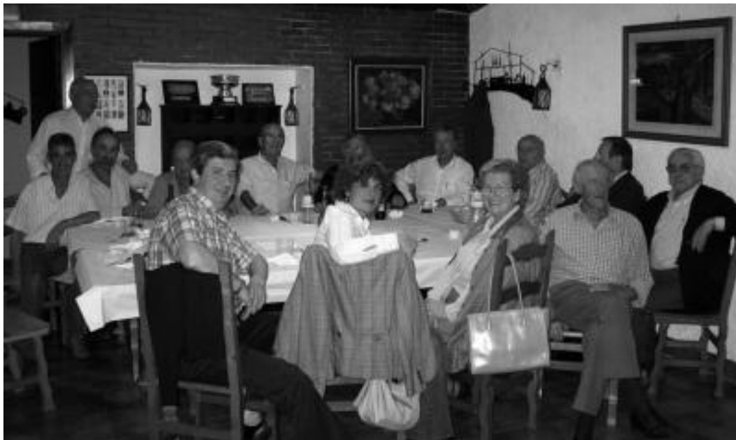
Tolosako zapatarien kofradiako egungo kideak urteroko afarian, joan zen asteartean. MADDI SOROA

1616an sortu zen eta Gipuzkoa osoan geratzen den kofradia bakarra da San Krispin eta San Krispiniano