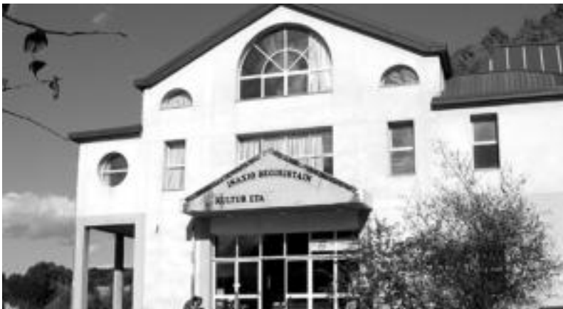
Kirol On enpresak eraman du orain arte Kirol Kultur Etxearen kudeaketa. O.ESKITXABEL

Alegiako Udalak ez du berrituko Kirol Kultur Etxearen kudeaketa eramaten duen Kirol On enpresaren kontratua