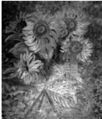
Loreak. Irastorzak oso gogoko du loreak marraztea, udan batez ere. Honako hau, Lizarran duten etxean margotu zuen udan inguruko eguzkiloreak kristalezko ontzian sartuaz. M. SOROA