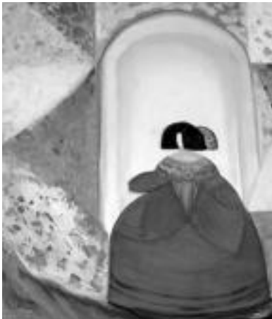
'Menina'. Velazquezen menina emakume ospetsuetan inspiraturiko koadroa da. Kolore beroak eta oso biziekin egina dago, eta oso ikuspegi alaia eskaintzen du. M. SOROA