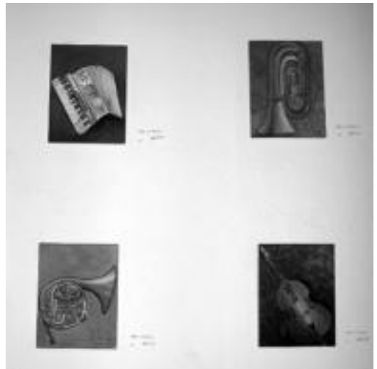
Soinu tresnak. Betidanik gustatu izan zaio musika. Soinujolea bazen ere, asko gustatzen zaio musika instrumentu ezberdinak marraztea. Hau, lau instrumentu ezberdinekin egindako bilduma da. Kolore apalak erabiliz, giro berezia sortzen du bilduma honek. M. SOROA