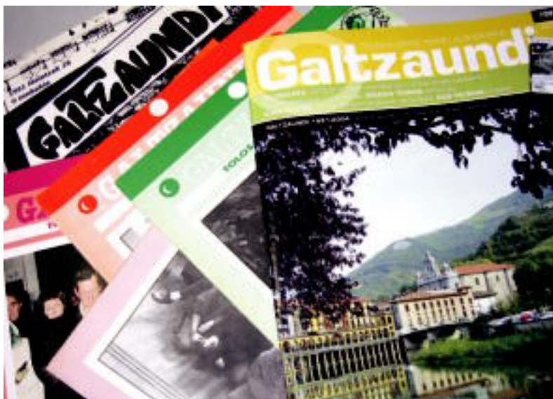
Aldizkariak itxura aldaketa batzuk izan ditu urte luze hauetan zehar: kolorea, maketazioa... I. LEXEBESTE

TOLOSALDEA ▶ 200. zenbakira iritsi da 'Galtzaundi' aldizkaria; hamahiru urteko lan eskergea egin du euskararen normalizazioan