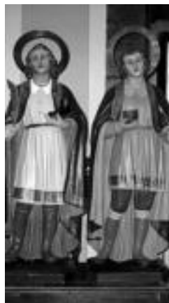
Bi santuen irudiak. J.SAIZAR

Zapatagileen eguna ospatzeko, kofradiako zuzendaritzak meza santua antolatzen du Santa Maria parrokiaren 10:00etan. Meza honen bitartez, zaindaria omentzen dituzte. Behin meza amaitu ondoren, zapatarien kofradiako zapatagileek San Krispin eta San Krispiniano irudiak