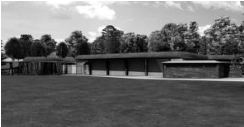
Ipupomamua kokatuko den eraikina muino artifizial baten pean egingo da. HITZA

Lamiategi zelaian kokatuko den egitasmo berritzaile eta bakanaren sustatzaileek 2006 urtean ireki nahi dute