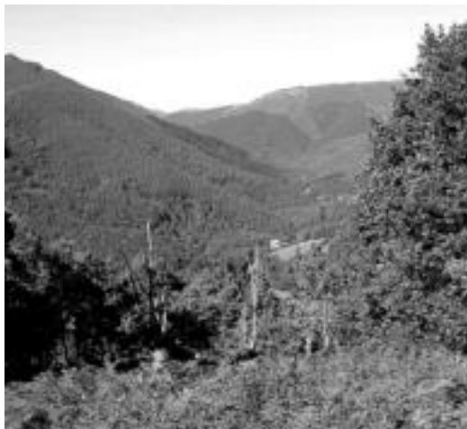
Isuria Leitzarango zein lekutan izan zen zehazten ez zekiten. J. A.

Material erradiaktiboak ihes egin die, zonaldeko hodi batzuk ikuskatzean