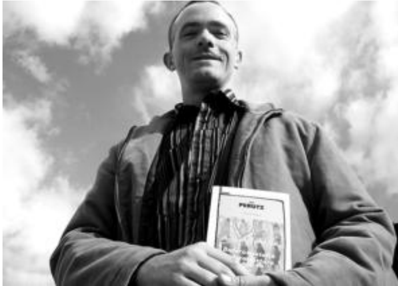
GARI BERASALUZZE / UROLA-KOSTAKO HITZA