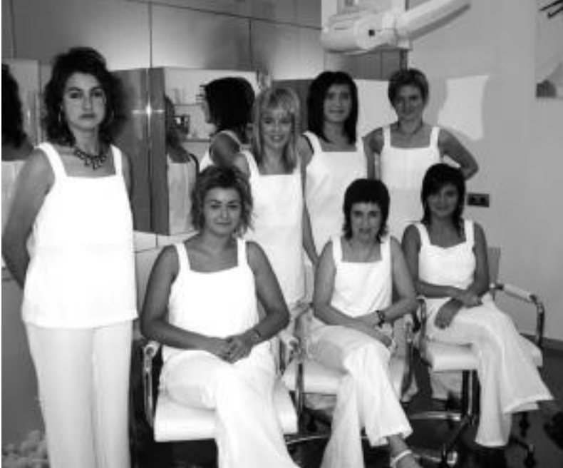
Naikari ileapaindegiko langileak pozik agertzen dira San Frantziskoko lokal berriarekin. NOELIA LATABURU

Irailaren 27tik Naikari ileapaindegia San Frantzisko ibiltokian aurkitzen den lokal berrian da