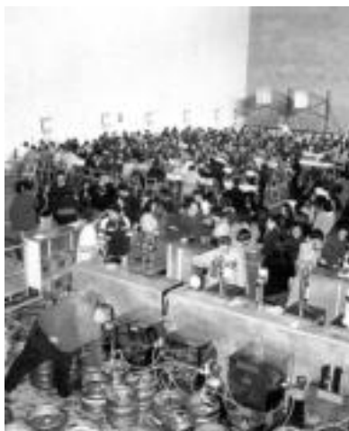
Alegia. Jende ugari bildu zen apirillean Elorri pilotalekuan Intxurre elkarteak antolatu zuen I. Zerbeza Festan; 4.000 euroko irabazia izan zen futbol taldearentzat. HITZA