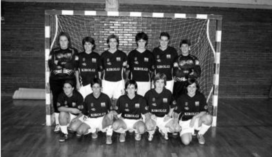
Hegoalde areto futbol taldea, denboraldiko lehen partida hasi aurretik. IMANOL GARCIA

Areto futbol taldeak helburu jakinak ditu denboraldi honetarako: egonkortasuna lortzea, aurrerago jokatzeko eta «beste taldeekin harreman naturalak izatea»