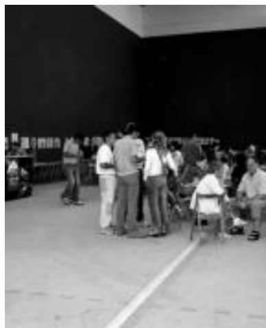
Irura. Aurten frontoi berrian egin ahal izan dute Ikastolaren aldeko garagardo azoka; herri osoaren laguntza eta partaidetza eskertu dute antolatzaileek. GARAZI AZKUE