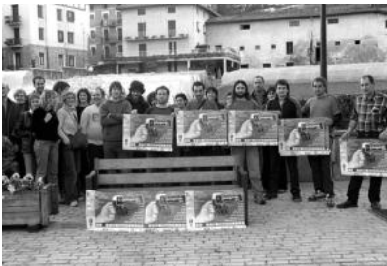
Ibarra. Herriko bederatzik elkarrekin bildu dira aurten lehen aldiz garagardo festa antolatzeko, Hauspoa, Udala, tabernari eta dendariaren laguntzarekin; aurreko asteburuan Lasturren egunpasa egin zuten bertan lanean aritu zirenek. HITZA