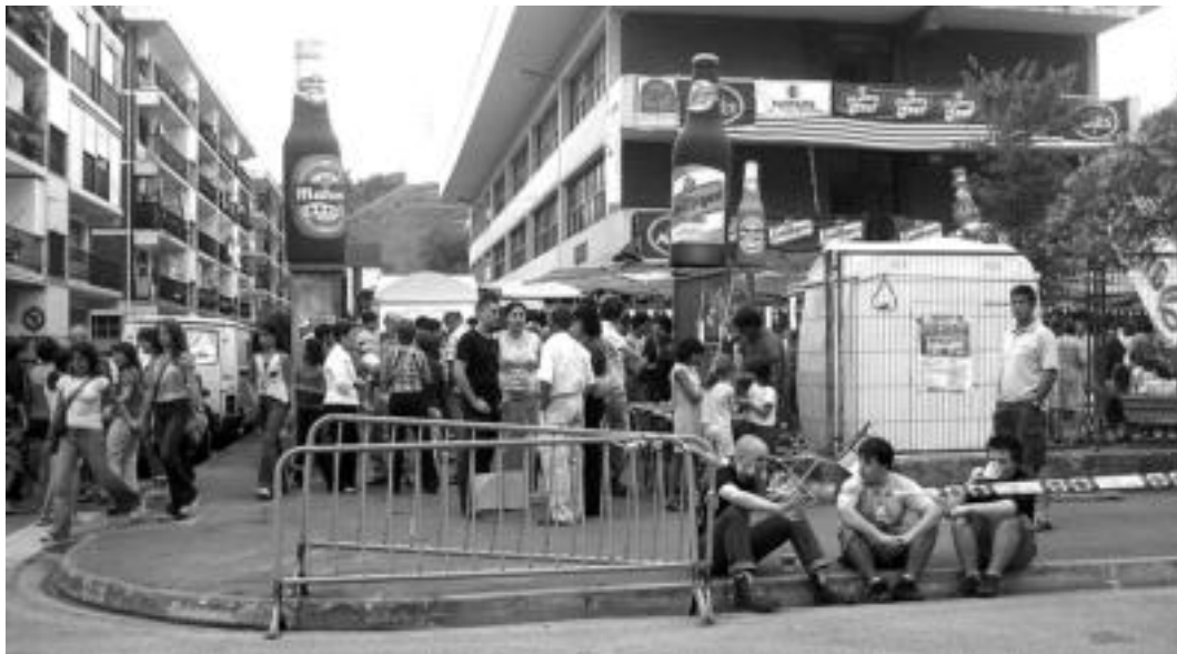
Villabona. Eskualdean beteroenak dira Irrintzi elkarteak garagardo azokak antolatzen eta Gipuzkoan bigarrenak. GARAZI AZKUE

Bost garagardo azoka egiten dira eskualdean —aurten bi berri antolatu dituzte—; arrakasta lortzen ari dira: jende ugari bildu eta giro berezia sortzen dute herrian