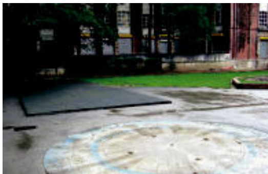
Lehen kolunpioak zeuden guneak hutsik ageri dira. I. TERRADILLOS

Villabona. Sukaldaritza errazeko ikastaroa izango da asteazken bezala, Biltoki elkarteak., 18:00etatik 20:00etara eta urritik abendura iraungo du. Izen-ematea, elkarteko bulegoan.