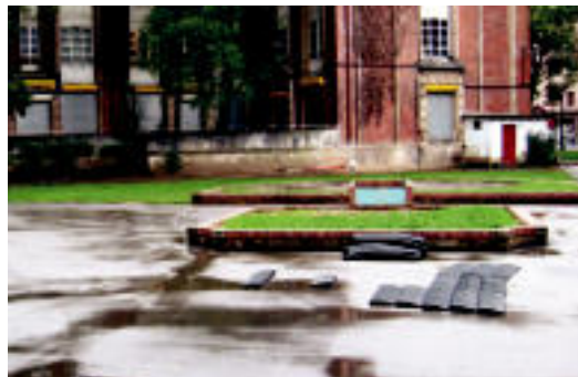
Lurreko kautzuak ere mugituta daude bere ohiko lekuetatik. I. T.