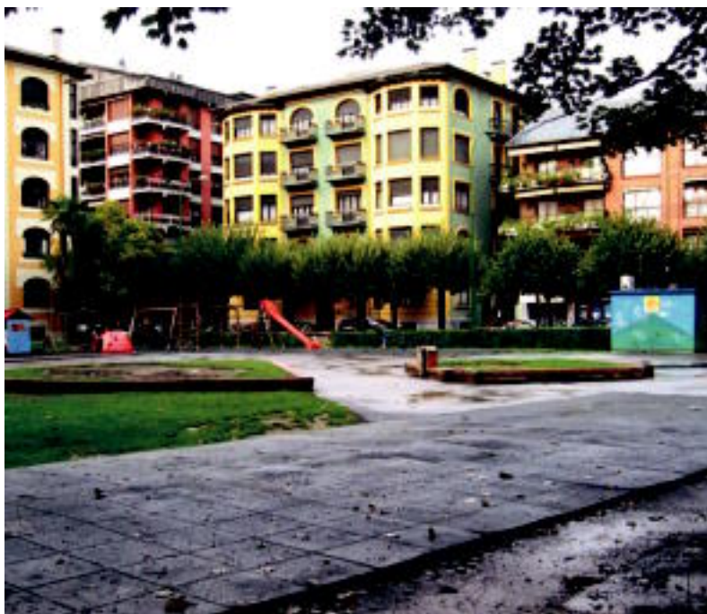
Tolosako parkean ohi baino jostailu gutxiago ageri dira egun hauetan. INIGO TERRADILLOS

TOLOSA ▶ Tolosako parkeak itxura goibela du azken egun hauetan, izan ere, bertako hainbat jostailu 'desagertu' egin dira