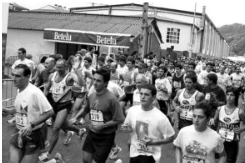
Indarrez eta gogoz ekin zioten ibilbideari 290 laisterkariak, gerora sakabanatuko baziren ere. JAIONE ASTIBIA

sor bat izateak asko lagunduko liguke». Bere aburuz, «oso gogorra egiten da hainbeste urtez lanean ibili eta behar beste laguntzarik ez jasotzea». Hala, babeslea edukiz gero taldearen kalitatea asko hobetuko litzatekeelakoan dago Argote: hala nola, bidaiaren baldintzak hobetuko lirateke eta kirolariak masaia gehiago jasotzeko aukera izango lukete.