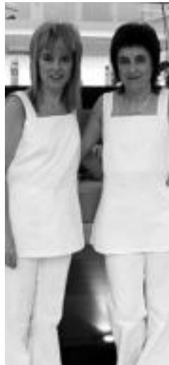
Olarra ahizpak. N. LATABURU

Kontxik, bestalde, duela hogeitabi urte eman zion hasiera bere ibilbideari, eta ileapaintzaile eta makillaje ikasketak burutu ostean, Dorin egon zen zortzi urtez bere estetikako ikasketak praktikan jartzen. Ondoren, beste lau urtez joan zen Kontxi ileapaindegi- ra eta hemendik irten ziren biak be-