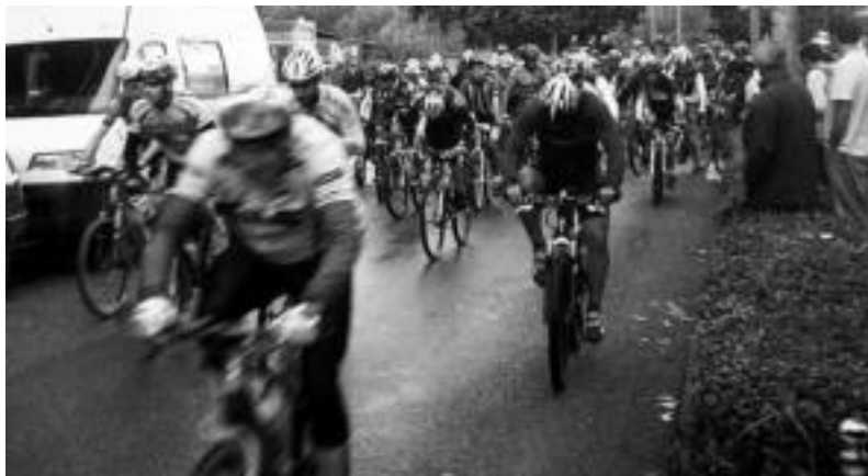
86 lagunek eman zuten izena Mendikute Elkar-teak antolatutako mendiko bizikleta trabesian.