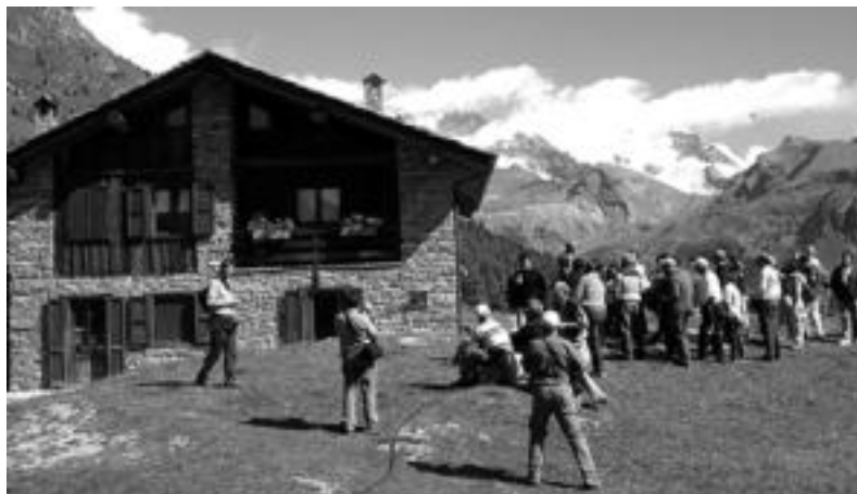
2.000 metroara aurkitzen den Latchavana di Mechan nekazal etxea ezagutu zuten, besteak beste. HITZA