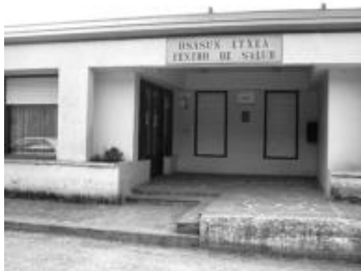
Leitza eta Aresoko biztanleak etortzen dira zentro honetara. J. A.

Oposaketan bidez, Leitzaldeko plazak eskuratu eta batek ez daki euskaraz