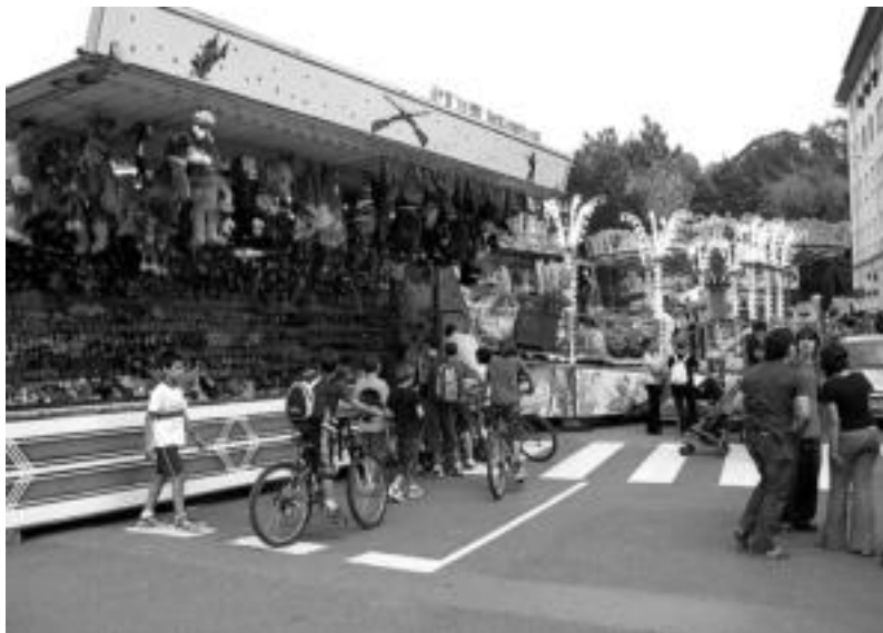
Gaztebo ugari ikus zitezkeen Berazubi auzoan jarritako barraken inguruan. IMANOL GARCIA