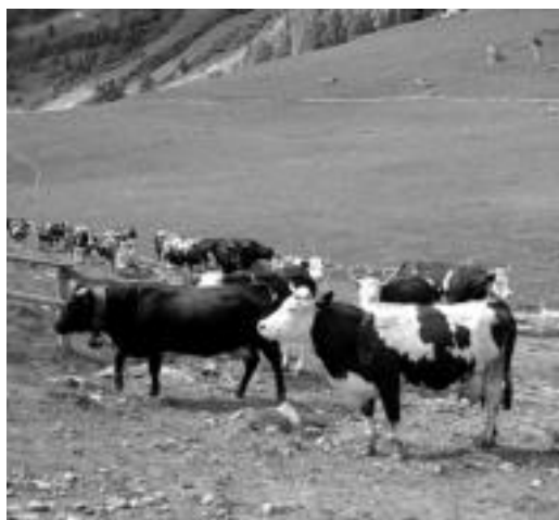
Aosta bertako arrazako behiak beltzak eta pintoak dira. HITZA

Italiako Aosta eskualdea ezagutzen izan dira eskualdeko hainbat ordezkariek