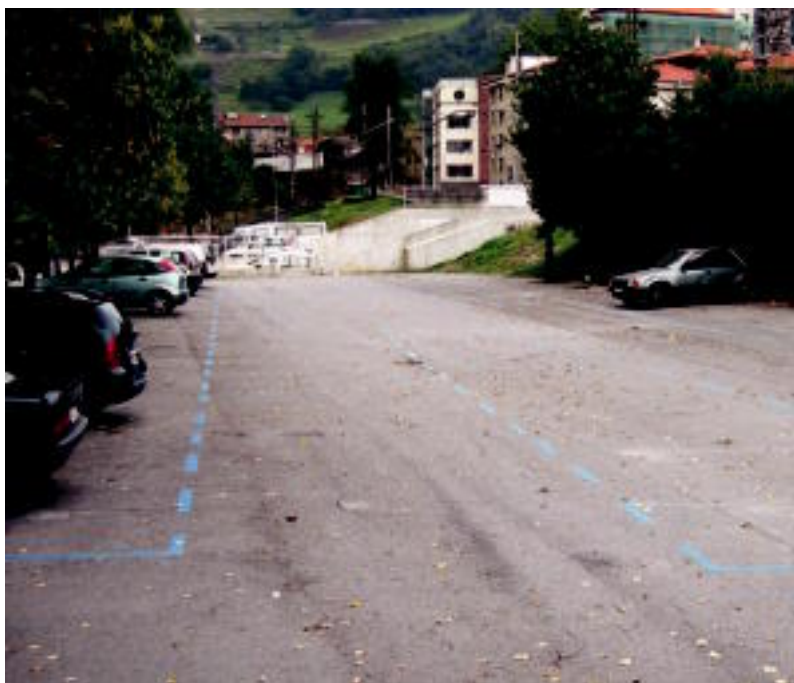
San Esteban auzoak itxura hau zuen atzo arratsaldean, auto gutxi eta aparkalekuak ia hutsik.

ALDAKETAK ▶ Aste honetan jarri dute gune gorria Berazubín eta urdina eta gorria San Estebanen ▶ 2