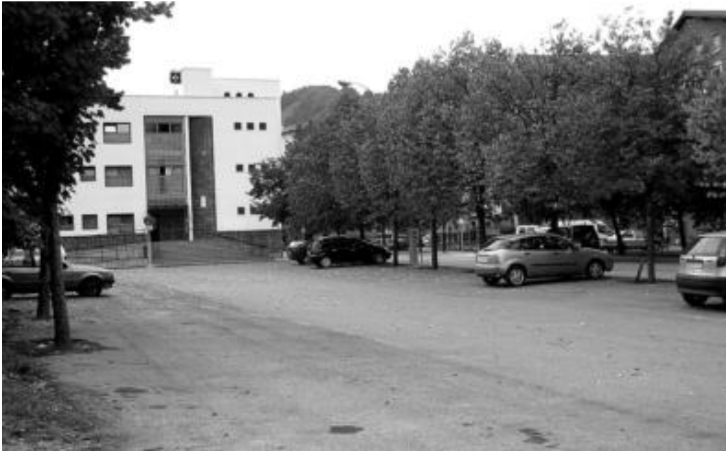
San Esteban auzoan, anbulategi aurreko aparkalekua ia hutsik ageri zen, atzo; TAO-ko gune urdina ezarri dute bertan. LEIRE MONTES

Berazubin gune gorria jarri dute zenbait kaletan; San Estebanen, urdina eta gorria