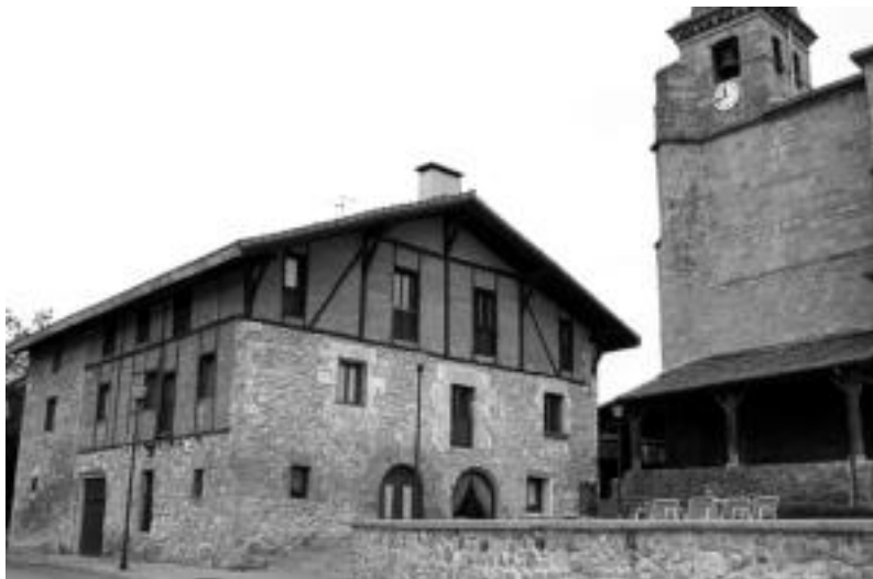
Uztartza aterpetxea Herriko Plazan dago, elizararen ondoan.

Aterpetxea ustiatzeko hamar urteko kontratua izango du esleipendunak, gutxienez urtero 7.200 euro ordainduta