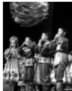
Errusiako Siberiako Krasnoyarsk haur abesbatza, iaiz. JOXEMI SAIZAR

Hilaren 27an hasiko da 36. Abesbatza Lehiaketa; baina, urtero legez, abonuak eta sarrerak salgai jarri ditu aurretik Tolosako Ekinbide Etxeak (TEE). Abonuak hilaren 14a arte egongo dira salgai, TEE-ren bulegoan (Emeterio Arrese, 2), egunero, 17:00etatik 20:00etara. 55 euro balio du helduen abonuak, eta 15 euro, berriz, haurrenak. Hilaren 19tik aurrera, bestalde, saioetarako sarrera solteak salgai jarriko dituzte Ekinbide Etxean.