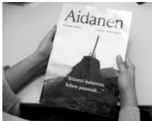
Berastegiko jaietan kaleratu zuten lehengo alea. AMAIA BELAUNZARAN

Berastegin urtean zehar izan diren berriak, bertako pertsonaia ezagunei elkarrizketa, historia, kirola, argazki bilduma, literatura, errezetak eta horoskopoa irakurri daitezke, besteak beste Aidanen aldizkarian. Herritarren harrera oso ona