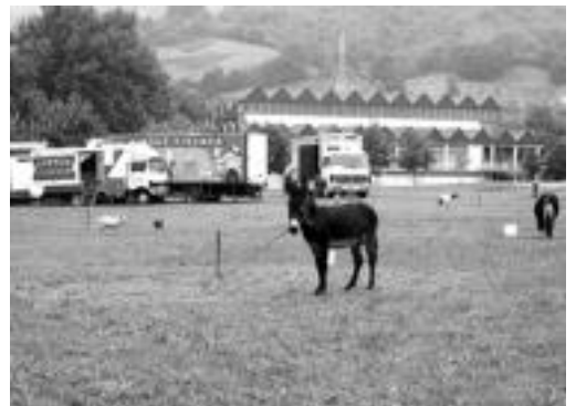
Atzo goizean abiatu ziren Fischer zirkoko kideak. O. ESKITXABEL