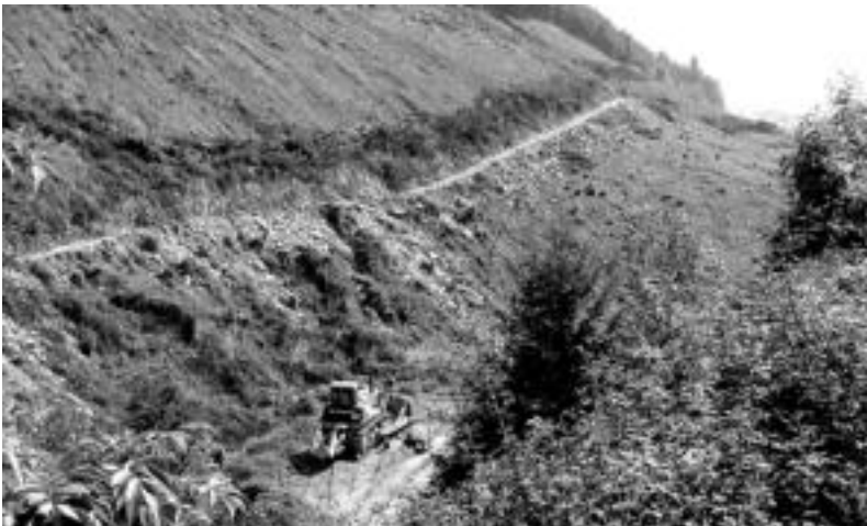
Ibiurren egingo duten urtegia zeharkatuko duen bidea egiteko lanean ari dira.

Ibiurko urtegiko lanak direla-eta itxita geratuko da egungo errepidea; bide berriak 1.124 metroko luzera izango du