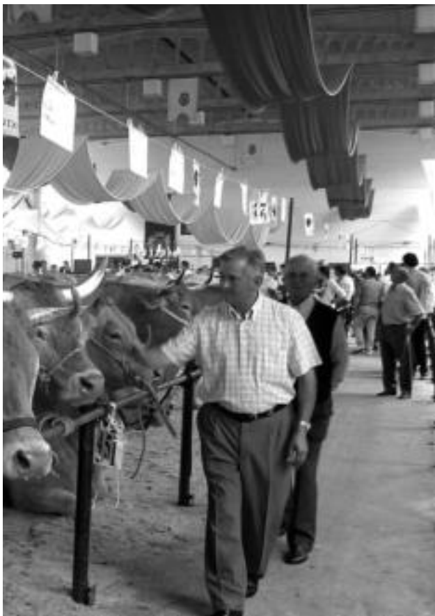
Arraza askotako abelgorriak eramango dituzte bertara ganaduzaleek. L. MONTES

Eusko Jaurlaritzako Indus- tria, Merkataritza eta Turis- mo Sailak merkatariei zuzen- dutako ikastaroak antolatuta ditu. Doakoak dira, eta infor- matika eta Internet-i buruz- koak. Herrian bertan egiteko aukera izango dute merkata- riek, baldin eta hamabi lagu- neko taldeak osatzen badira. Izena eman eta informazioa jasotzeko 943 16 06 73 telefo- no zenbakira deitu.