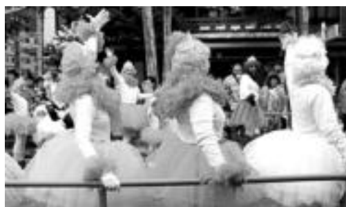
Inauteriei buruzko lehen bilera egingo dute asteartean. HITZA