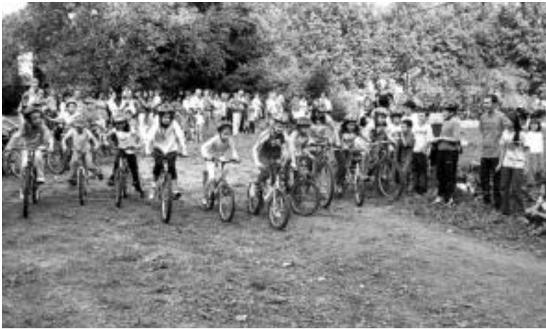
Gogotsu ekiten zioten partehartzaileek proba hasieran. I.GARCIA

Hirurogeita bost haur eta gaztetxok hartu zuten parte, sei maila ezberdinetan, Lamitegin prestatutako zirkuituan