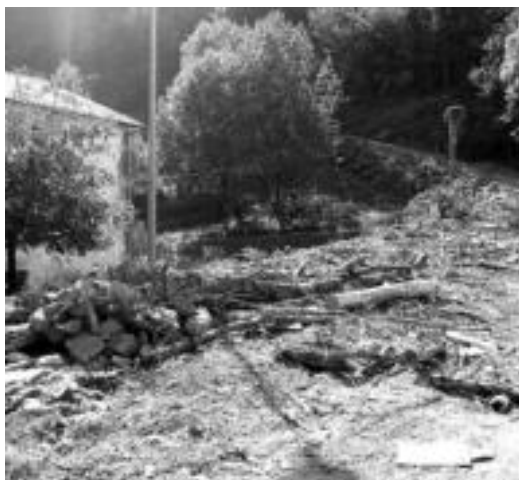
Baliarrainera joateko bidea Ola auzotik abiatzen da. O. ESKITXABEL

Ondo bidean, lan horiek 2005eko maiatzean amaitzea espero dela ere aurreratuko du.