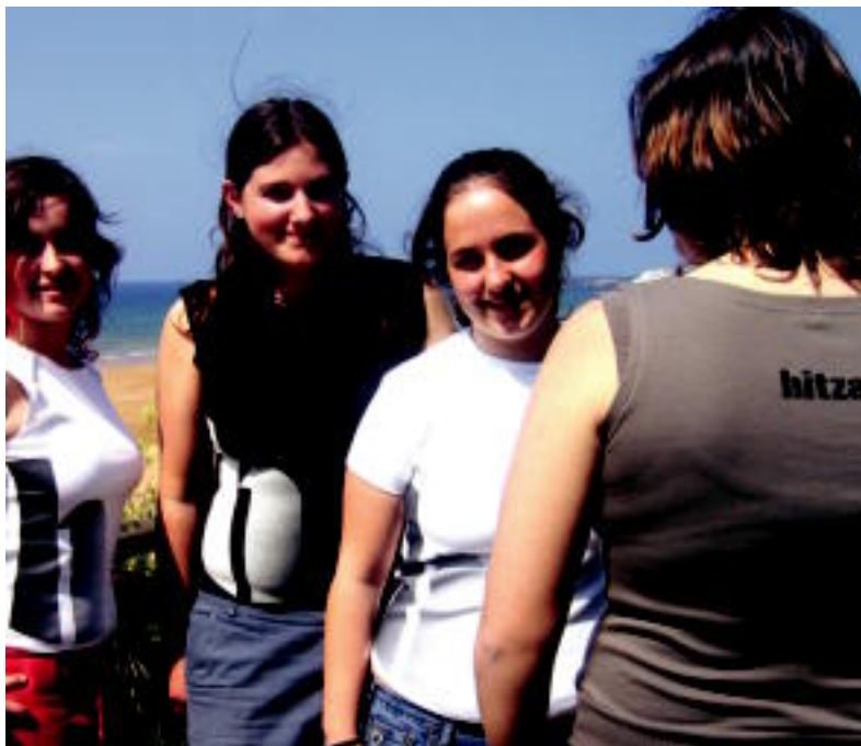
HITZA-KO elastikoek arrakasta aipagarria lortu dute; bihar salgai egongo dira Kilometroetan. L.GARRO

dutzak egiteko mahaiak paratuko ditu HITZAK Orion eta Zarautzen; bat herri bakoitzean. Orion autopistaren azpian paratuko du mahaia, eta Zarautzen, berriz, malekoian, hondartzaz baxterrean. Bertan, besteak beste, horrenbesteko