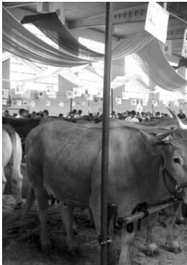
Abeltzari Lehiaketa egingo dute gaur, goizean hasi eta eguerdira bitarte, Ferialekuan.