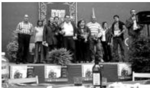
lazio Gazta Lehiaketako irabazleak, sari banaketan. ALONIA IPINTZA

Tolosako XVIII. Gazta Lehiaketa eta Probintziako XXXV.