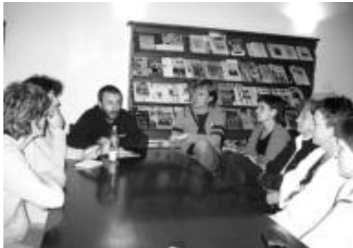
Tabarrek esandakoak adi-adi jarraitu zituzten bertan bildutakoek. J. A.

Gerren sustaketa honetan, estatuen aliaturik eraginkorren modura aipatu zituen komunikabideak, batez ere horrela behar izanez gero, jende arruntaren artean gorrotoa pizteko eta gerren benetako kausak mozerrotzeko omen duten gaitasunagatik: Jugoslavian sekula guztian elkarrekin bizi iraun zuten erlijio desberdinetako jendeak elkarrenganako xaxatu zituzten, Afganistanen taliban emakumeei burka inposatzen zieten esanez... Baina berak zioenez, batean, «Alemania aldeko eremuan