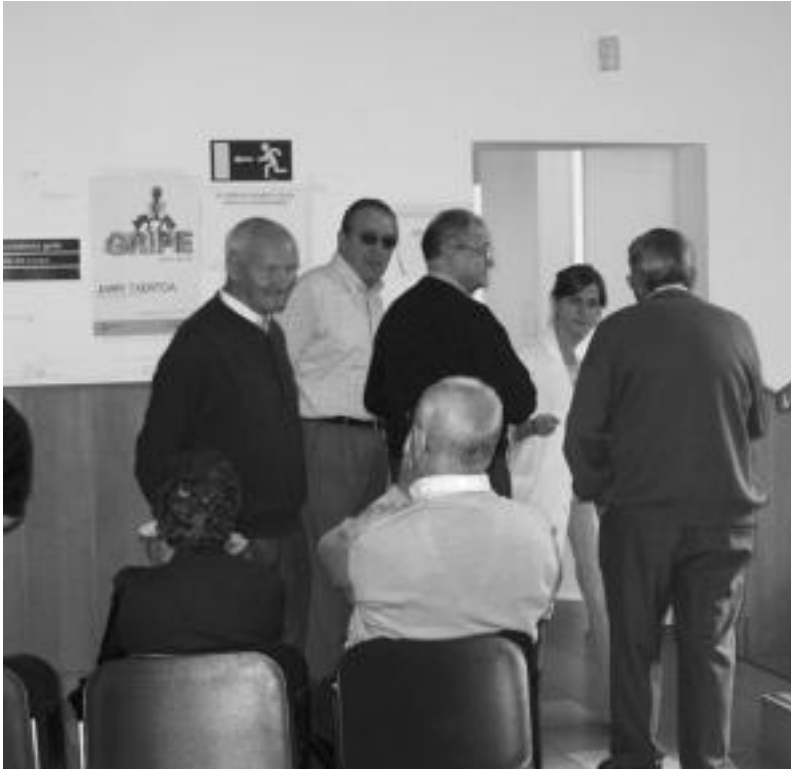
Egun hauetan gripearen aurkako txertoa ari da hartzen jende asko Tolosako anbulatorioan. MADDI SOROA

Urriaren 31 arte gripearen aurkako txertoa hartzeko aukera dago bi eskualdeetako herri guztietan