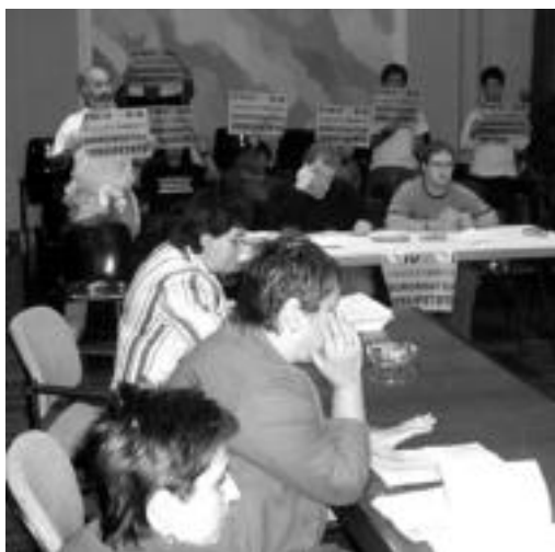
Anoetarrok Auzolanean plataformakoak, kartelak eskuan. HITZA