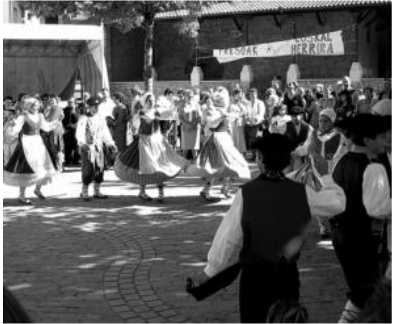
Irura. Irurako txikienek plazara inguratuz zirenei eskainitako emanaldiaren une bat. I. GARCIA

Atzoko ekitaldiekin hurrengo urtera arte agurtu zituzten jaiak Aldaban; goizean, meza nagusia izan zen. Ondoren, hamaiketakoa egin zuten herritarrek; jende ugari gerturatu zen bertara. Aste eguna zen atzokoa eta jende asko lanean izan zen goizean; hori dela-eta afarian jende gehiago bildu zen. Elizondo jatetxean egin zuten afaria; auzoan eta auzotik kanpo bizi diren aldatarrek elkar ikusteko aitzakian elkartu ziren mahai inguruan. Ainara eta Miren trikitilarien erromeriako doinuekin amaitu ziren San Migel jaiak.