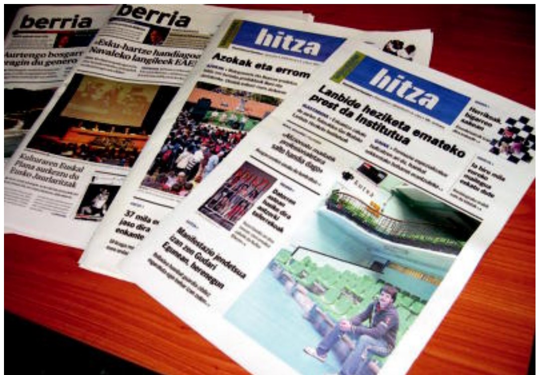
Berria eta HITZA egunkariak hitzarmen bat egin dute HITZAko harpidedunei eskaintza berezi hau egiteko. HITZA

TOLOSALDEA-LEITZALDEA ▶ HITZAko harpidedunek eskaintza berezia dute: 'Berria'-ko harpidetza merkeago eta hilabetez doan jasotzeko aukera