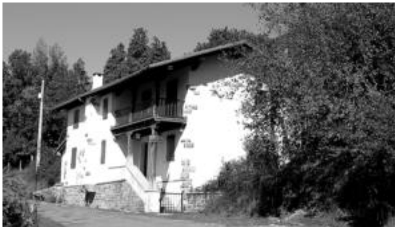
Leitzelarreko errepeidean dago Irusu, izen bereko mendiaren hegalean, eguzki sarrerari begira. J. ASTIBIA

Salmenta hau enkante bidez egin da, herri ondasunen sal-