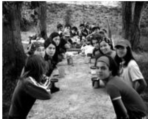
Burgosen hamabost egun igaro zituzten Txiribitukoek. I. TERRADILLOS

Honetaz gain asko izaten dira egun beterako egiten di-