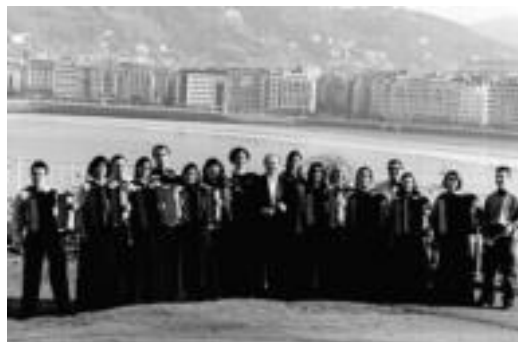
Donostiako Eskusoinuen Orkestra Sinfonikoa.