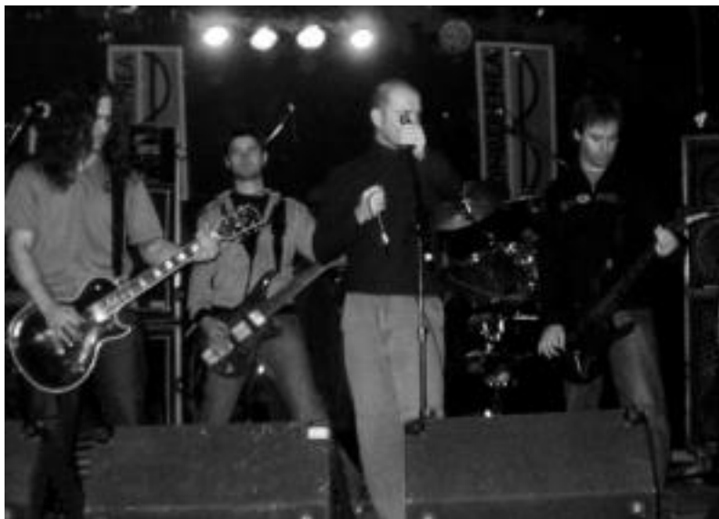
Urriar eta azaroan astebururo izango da kontzerturik Bonberenean; argazkian, iazko emanaldi bat. HITZA

Udako atsedendialdiaren ondoren, bihar ekingo diote denboraldiari Bonberenean; Obligaciones eta Captain Nemo taldeek eskainiko dute kontzertua 22:30ean