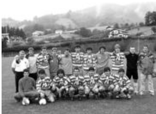
Aurrera KE-ko jokalariek ligako aurreneko partiduan. J. ASTIBIA