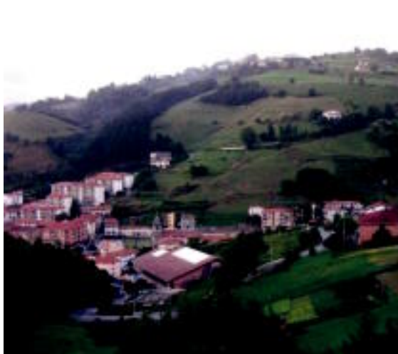
ZORIONAK Sasiari darion masusta emankorriari eskerrak eta urte askotarako. Ibarra Herri Ekimena.