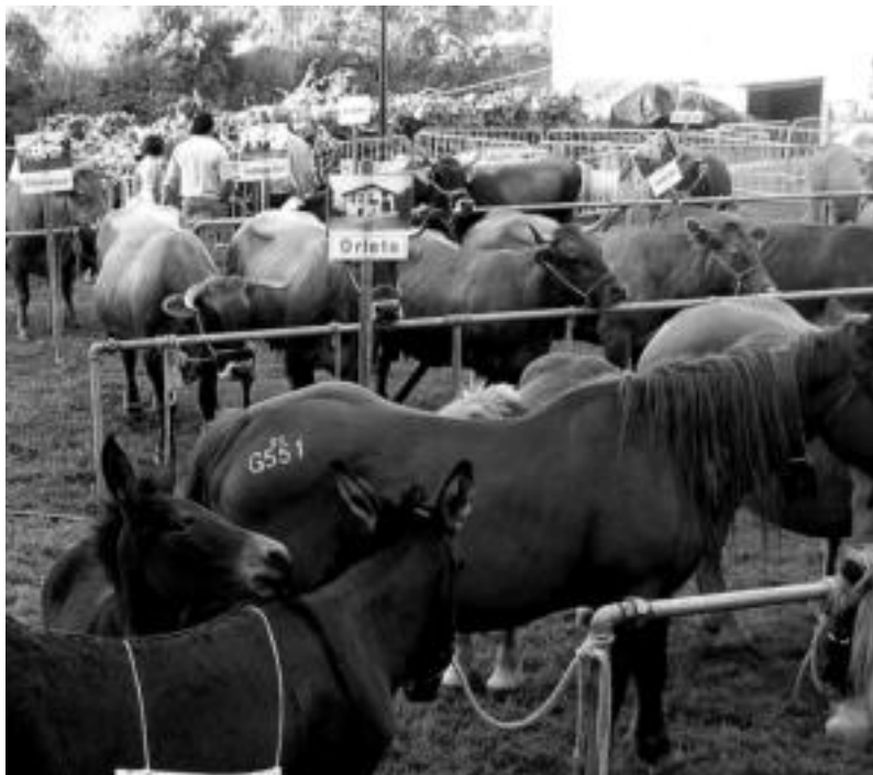
Beko-Biden jarriko dituzte ikusmin gehien sortzen duten abereak ikusgai.

Igande goizean egingo da Ibarako kaleetan 'Bertakoa, ezagutzekoa' azoka