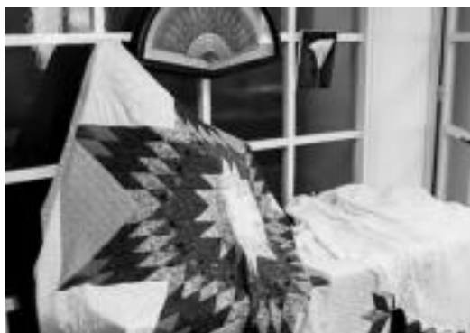
Eho-ziri lanak, koadroak, ohe-gainekoak... Denak erakusgai. J. A.

Negua ate joka heldu dela eta, ikasle jendeak ez ezik gainerakoentzat ere ikasteko aukera desberdinak badira