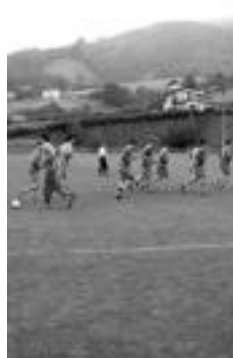
Jokalariek partidua aurreko beroketarako egiten. J. ASTIBIA

Eta joan ere, autoz joanen dira, kanpoan jokatzen duten aldiro bezala. «Taldea Goren Mailan zegoenean, autobusa hartzeko diru laguntza izaten zen federaziotik eta. Baina orain, maila honetan, ez da horrelakorik izaten eta moldatu egin behar izaten dugun», argitu zuten, «ahalik eta kotxe ko-