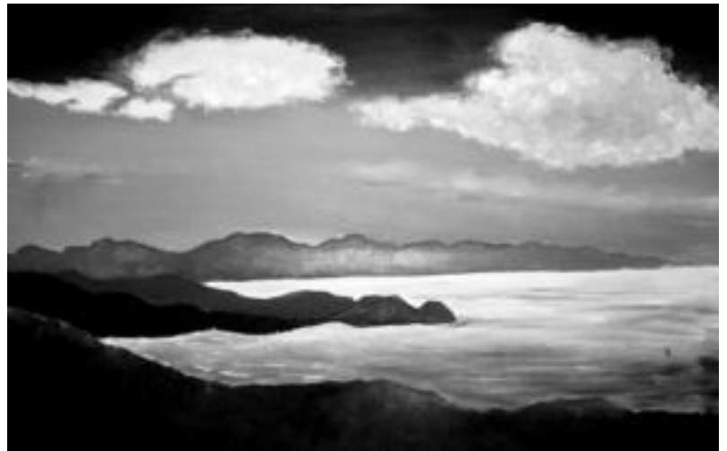
Teknika ugari. 5 eta 18 urte bitarteko ikasleek hartu dute parte erakusketan; era guztietako teknikak jorratu dituzte: olioak, akuarelak, pastelak, itzalak, zurezko margoak, teknika mistoak... LEIRE MONTES

Artista gazte hauen lanak ikusi nahi dituenak Aranburun du hitzordua, gaur eta bihar, 17:30etik 20:30era.