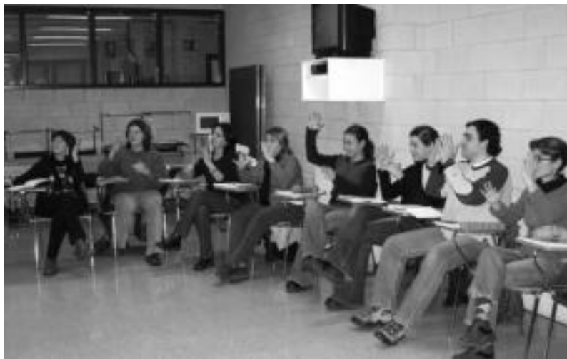
Gainditzen elkarteak urte batzuk daramatza zeinu ikastaroak antolatzen; argazkian, klase bat.

Urriaren 4ean hasiko da Inmaculada ikastetxean, Gainditzen elkarteak antolatua