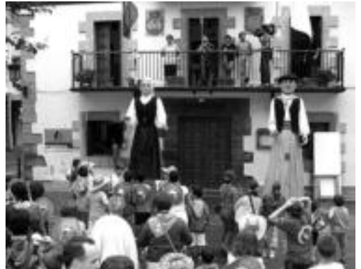
Gaur hasiko dira Irurako San Migel jaiak. HITZA

Herensugeak, suziariak, pregoiak eta zanpantzarrek emango diete hasiera festei