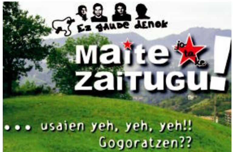
ZORIONAK Hurrengo irteeran gurekin izan zaituzten borrokatuko dugu! Muxu handi bat! Jo ta ke! Ibarra Gazte Asanblada.