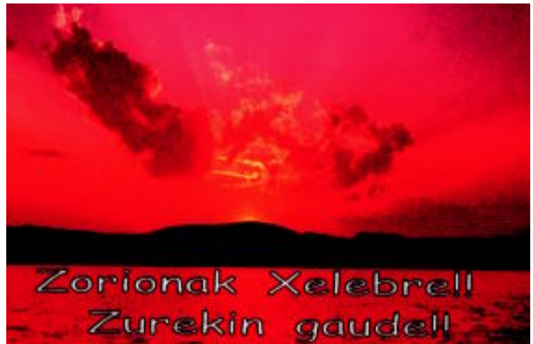
ZORIONAK Horrelako iluntzeak elkarrekin pasatuko ditugulakoan... Animo ta segi aurrera! Gora Euskal Herri gorria! Zure koadrila.