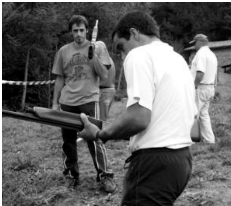
Plater-hausketa lehiaketa herrikoa Aldabako jaietako usadiozko ekitaldia bihurtu da. D.GIBELALDE

Bihar, etzi eta asteazkenean, irailaren 29an, izango dira jaietako ekitaldiak; gauak trikitixa taldeek alaituko dituzte