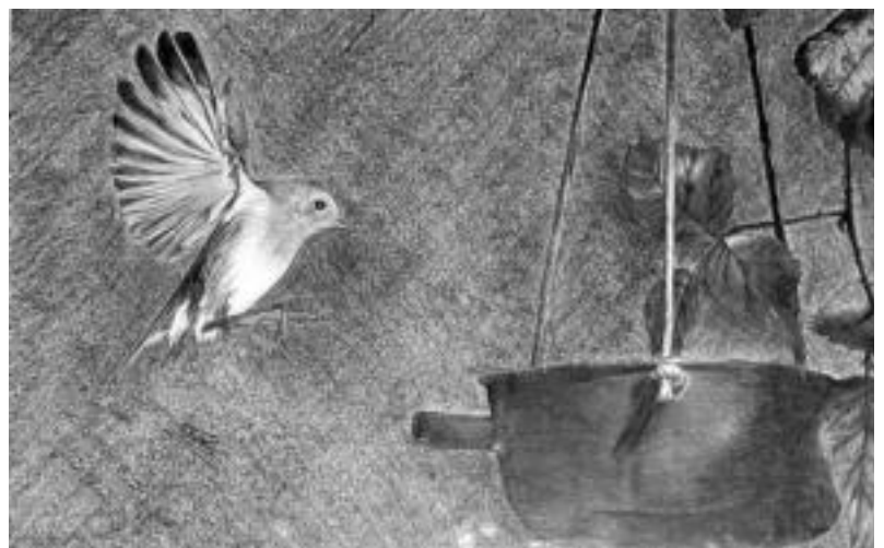
Lehenago amaitzea. Hasiera batean urriaren 9a arte zen egotekoa erakusketa Aranburun; baina hezetan eta ur jarioek aretoetan sortu dituzte arazoak direla medio, bihar amaituko da. LEIRE MONTES