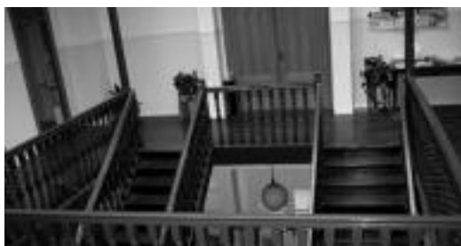
Leitzako udaletxeko bulegoetako sarrera. JAIONE ASTIBIA

Tramitezko gaiak dira eztabaidagai, hamabost egun baitira bestea eginik