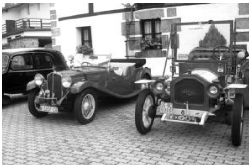
lazo azokan, garai bateko autoen erakusketak interes berezia sortu zuen bertaratu zirengan . O.ESKITXABEL

XV. Kultur Asteari hasiera emango dio ekitaldiak; Goiatzeko plazan, artisauak, nekazariak... bilduko dira