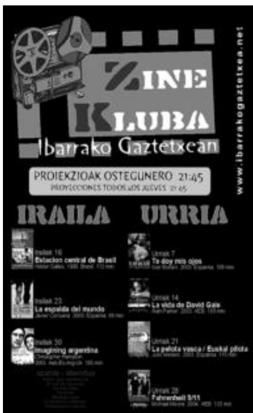
Ibarrrako Zine-klubeko kartela.

Gaur egungo filmak ikusteko aukera ematen du Ibarrrako Zine-klubak Gaztetxean, ostegunetan 21:45ean.