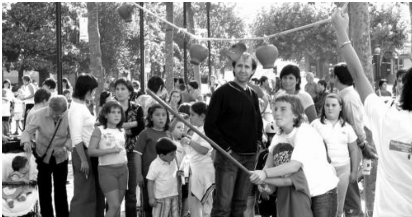
Tolosan, Trianguloan eta Euskal Herria plazan egin zituzten ekintzak: haur liburutegia, bizikleta jokoak, herri jolasak —argazkian—, txokolata jatea... Jende asko bildu zen.

Kutsadura murriztea, oinezkoen eskubideak aldarrikatzea, garraio publikoaren erabilera indartzea... Helburu horiek ditu Autorik Gabeko Eguna. Batzuk diote urtean egun bakarra izateak zentzurik ez duela eta autoen erabilera gutxitzeak eguneroko lana izan behar duela; ados daude beste batzuk ekimenarekin. Eta bazen atzo Autorik Gabeko Eguna zela oharitu ez zenik ere.