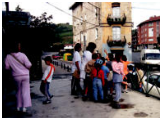
Zizurkil. Haurrak ginkanan ibili ziren goizean zehar jolasean, plazatik Ubare aldera. GARAZI AZKUE