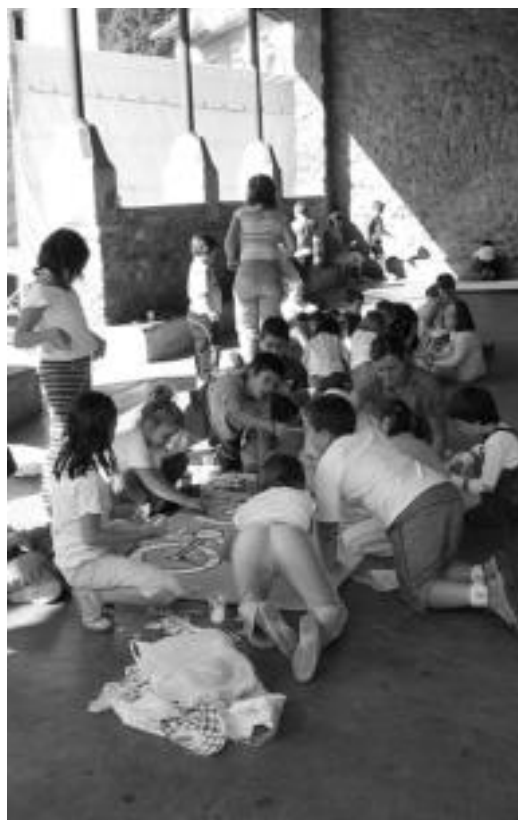
Iruan, muralak pintatzen jardun zuten Ikastolako ikasleek.

«Autorik Gabeko Eguna antolatzen dutenei zorionak emango nizkieke, bizikletaz jende gehiago ibiltzen delako jendea egun horretan, eta, gainera, gutxiago kutsatzen delako autorik ibiltzen ez denean. Bestalde, haurrek aukera handiagoa dute kaleko hainbat txokotan jolasteko, eta oso ondo pasatzen dugu. Urtean gehiagotan antolatu beharko lukete egun hori; aberasgarria da guztiarentzat».