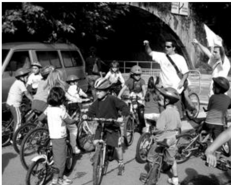
Zizurkilen, haur eta gaztetxo asko bildu ziren bizikleta jokoetan parte hartzeko. G. AZKUE