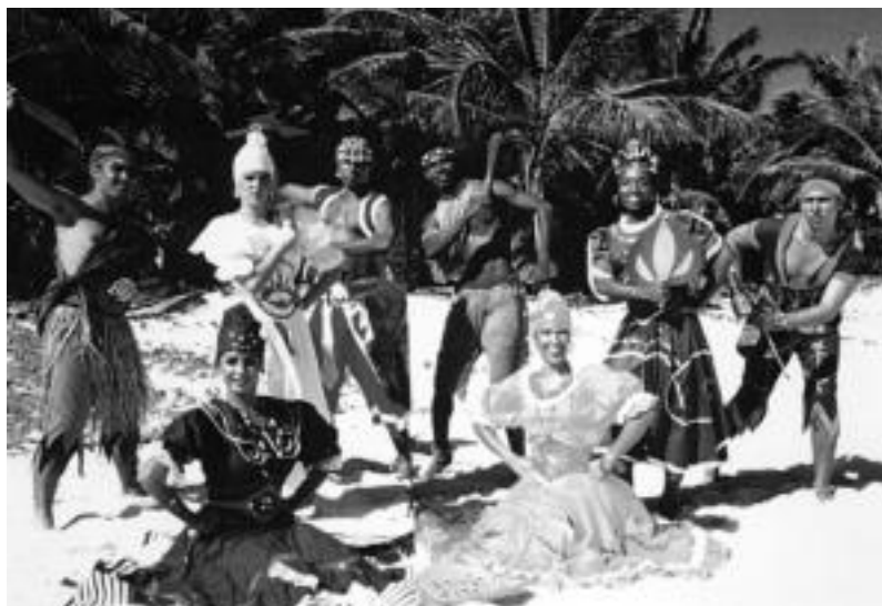
Hamasei lagunek osatzen dute Kubako Camagüey Balet Folklorikoa. TOLOSALDEKO ETA LEITZALDEKO HITZA

Kubako Camagüey Balet Folklorikoak emanaldia eskainiko du, bihar, Leidorren; lurralde hartako ohiturak eta tradizioa ezagutzera ematea du xede taldeak