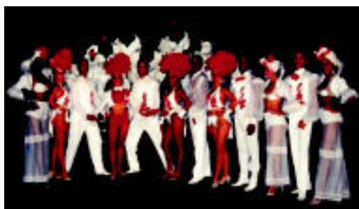
Europar zehar biran ari dira kubatarrak. HITZA

Bere ohiturak eta tradizioa eskainiko ditu Camagüey Balet Folkorikoak ▶ 4