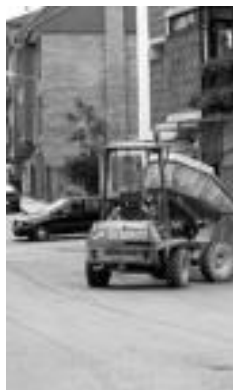
Hodiak zintzilikatzen.

Udalak igorri duen ohar baten arabera, Patxi Arrazola auzoan ura moztuko dute gaur, goizetik hasi eta arratsaldera arte, zehazki 9:00etatik, 15:00etara. Jakina da dagoeneko auzo horretako urbanizaketa eta zolaberritze lanak hasita daudela, eta hain zuzen ere horixe omen da ur-mozketa honen zergatia: nonbait hauek dirauten bitartean auzotarrek edateko uraren hornidura ziurtatua izan dezaten, beharrezkoa den hoditeria airetik jarri behar omen dute «auzotarrei ahalik eta eragopen gutxien sortzeko moduan» eta hori egin ahal izateko ura moztu beharrean aurkitu dira. Auzoan bertan egiaztatu denaren arabera, eraikuntza guztietan jada airean jarrita dago ura ibiliko den hoditeria hori, apeoekin. Orain guztiak elkartu eta herriko ur-sareari lotzea faltako litzake, zerbitzua bermatuz.