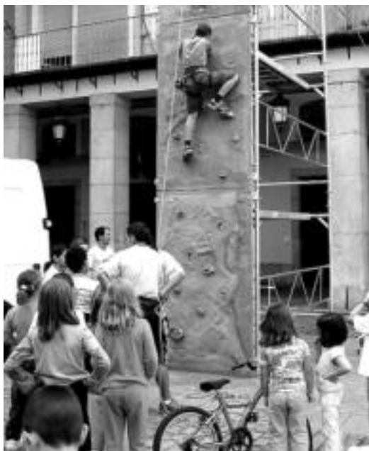
Tolosan, rokdromoa jarri zuten Euskal Herria plazan.