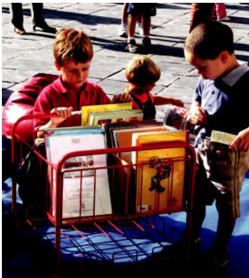
Tolosa. Trianguloan jokuak izan zituzten haurrek arratsaldean; txikienek liburuak irakurtzeko aukera izan zuten han bertan; Euskal Herria plazan bizikleta jokoak eta rokodromoa izan zuten. IRATXE ETXEBESTE

TRAFIKOA ▶ Kale eta plaza batzuk autoei itxita egon ziren, baina ohi baino auto gutxiago ez zen antzeman trafikoan ▶ 2,3