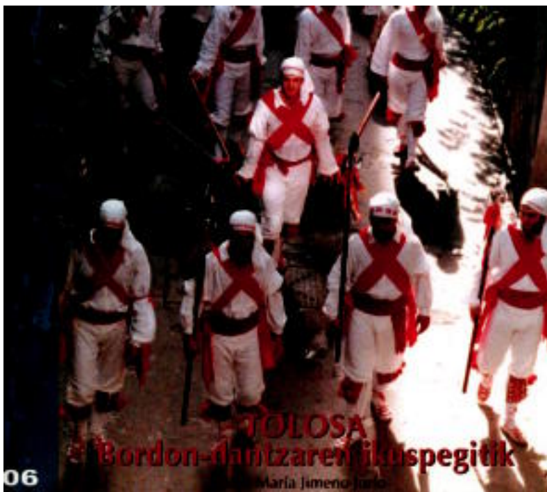
Argitara eman berri den liburuaren azala.