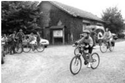
Leitzaldetik Lekunberrirantz, ibilaldiari ekinez edota ekitekotan, herriko parte hartzaile batzuk. Bakarrenetakoak. Bejondeiela!. J. A.