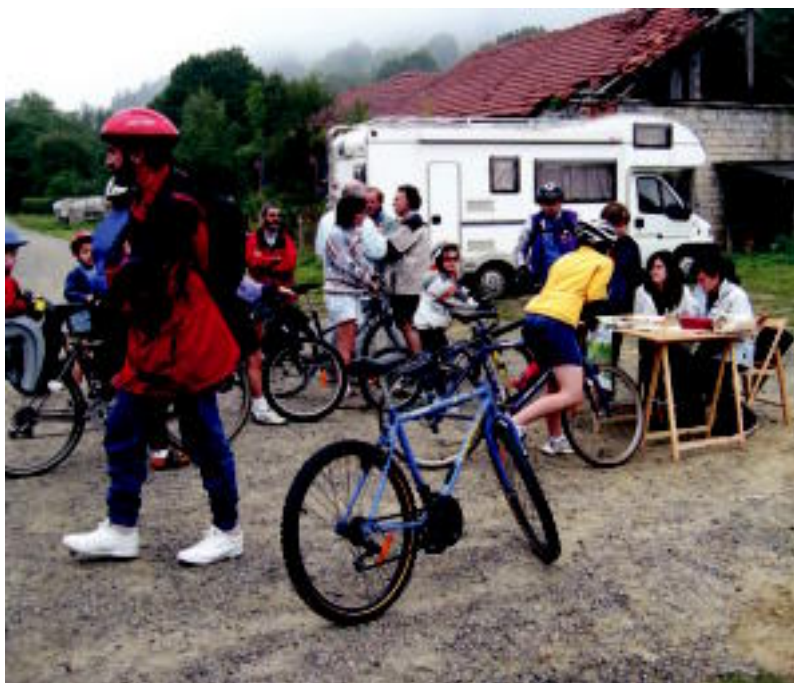
Bizikleta martxako parte-hartzaile batzuk Leitzaranen. JAIONE ASTIBIA

PARTAIDETZA ▶ Leitzaldeko parte-hartzaile gutxi samar izan ziren igandeko bizikleta martxan ▶ 7