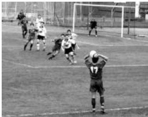
Ondo aritu ziren Tolosa CFko mutilak igandean Berazubin. JOXEMI SAIZAR

Indartsu irten zuten Zarautz-koek zelaira, eta haiek izan ziren uneoro partiduaren erritmoa ezarri zutenak. Hala ere, gol aukerarik ez zuten sortu ia, eta horrek galdu zituen. Etxekoek, ordea, sarritan lortu zuten baloia saretik gertu jartzea, eta Lasak eta Blancok, batez ere, ezinegona ekarri zuten behin baino gehiagotan kanpotan.