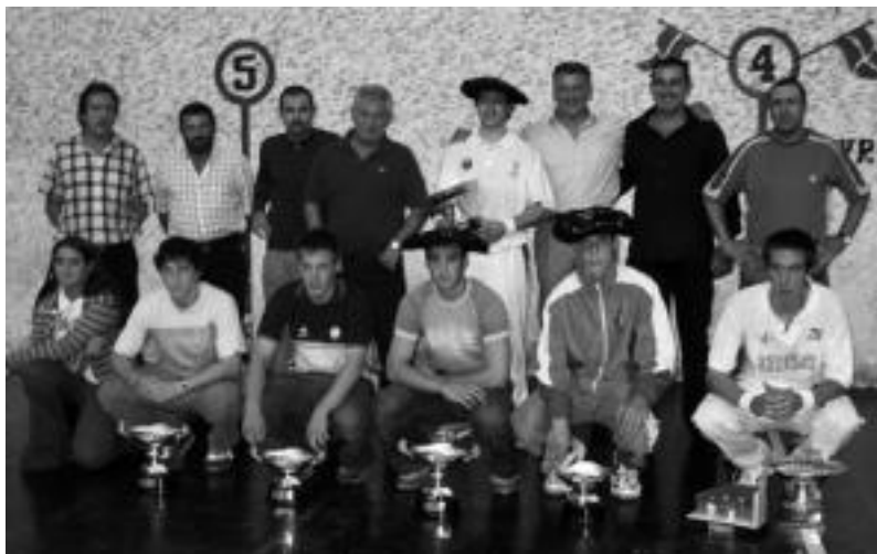
Antolatzaileak, txapelketako laguntzaileak eta finalen jokatuak pilotariak. O.ESKIXABEL