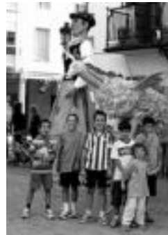
Ostiralean hasiko dira San Migel jaiak. A. IPINTZA

11:00. Meza nagusia abestia, Perossiren II. Pontifikala. 12:30. Gorritiren abereak haurrentzat.