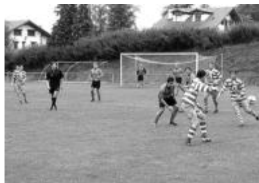
Aurrerak eraso ugari egin zituen lehendabiziko zatian. J. A.

Partidu hasiera aterrunearekin batera suertatu bazen ere, lehendabiziko denbora tartea aurrera joan ahala, bixi-bixi eraso zion langarrak, Leitzako taldeak ere modu berean egiten ziolarik eraso, aurkarien