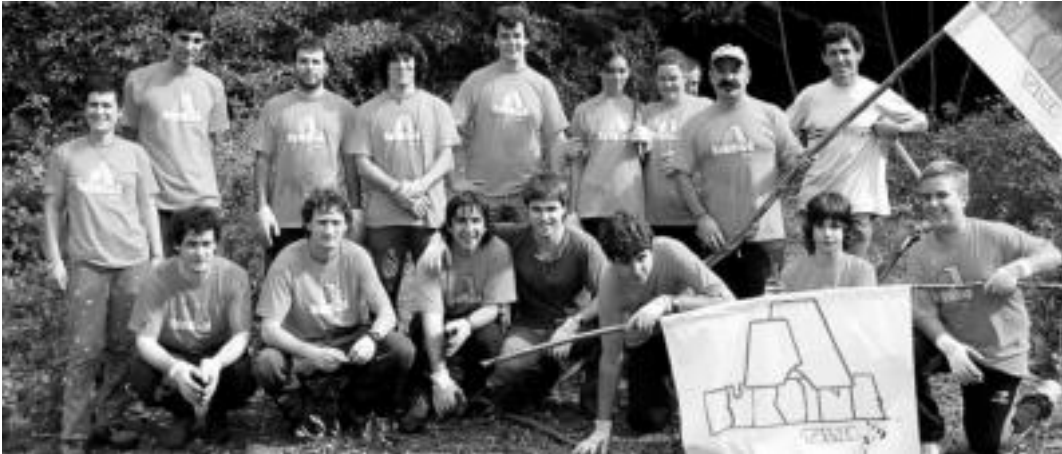
Burdina taldea aritu da uda honetan Bizkotx meategia berritzen. HITZA