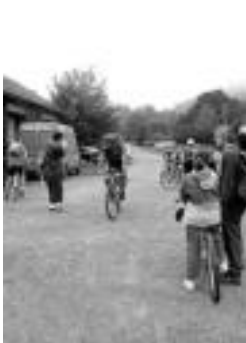
Batzuk izena ematen eta besteak abiatzeko zain. J. ASTIBIA.

Eguraldi goibela goizetik, gerora argiuneak zabalduz eta Leitzaldeko parte-hartzaile gutxi samar igandeko martxan