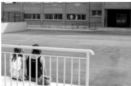
Alegian. Institutuko ikasleek aurkezpena izan zuten atzokoan; kontu txikiak esaten ere aritu ziren batzuk eskolako jolastokian. MADDI SOROA

Atzo edo gaur hasi, udako oporraldia amaitu da eskualdeko ikasle guztientzat. Ikastetxetara itzuli dira. Eta, aizue, gehienak barrez ikusi ditugu.