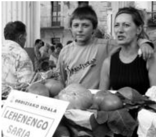
Lehenak. Iaz bezala Ibarako Montes baserriak irabazi zuen Plaza Nagusiko fruitu eta barazki lehiaketa.