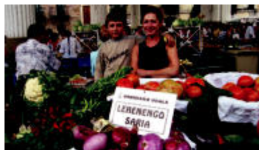
Montes familiak lehen saria irabazi zuen barazkiekin. JAIONE ASTIBIA

Ibarrako Montes izan da irabazle barazkietan; Baliarraingo Mujika eta Jauregi eta Ibarrako Aristi, sarituen artean ▶ 6-7