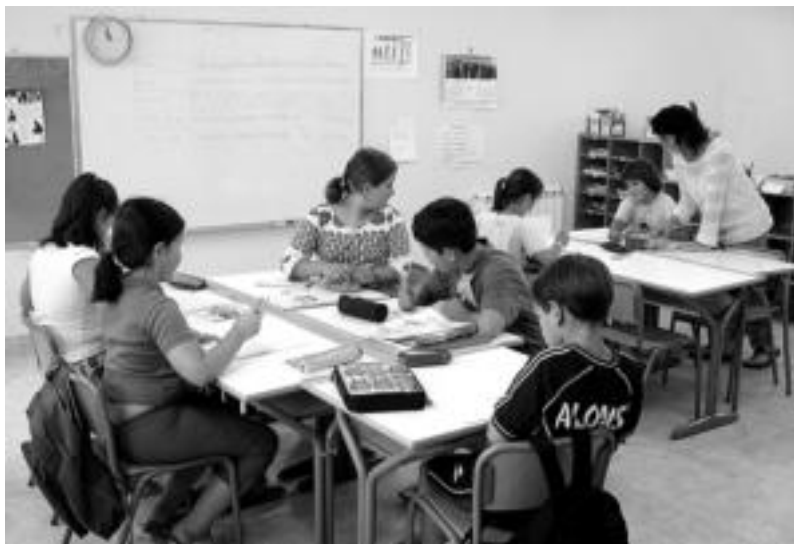
Aitzon. Haur eta gaztekoek goizetik eguerdira izan zituzten eskolak atzo; oporretako gora beherak elkarri kontatu ostean, ikasurteko ordutegia zehaztu zuten 3, 4 eta 5. mailako ikasleek irakaslearekin. MADDI SOROA

ten dutenak. Egokitzapen hori ahalik eta xamurren izan dadin, gutxinaka gehitzen dizkiete ikasleei ikastetxean pasatu beharreko orduak. Lehen astean ordu gutxi batzuk baino ez dituzte ematen bertan, eta bigarren edo hirugarrenetik aurrera goizez eta arratsaldez izaten dituzte eskolak.