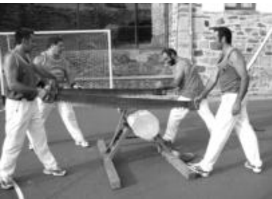
Elduainean herri kirolak ikusteko parada izan zuten bertaratu zirenek; argazkian, trontzalariak herriko plazan. I. TERRADILLOS

Alkizan, Zizurkilen eta Bediaion atzo hasi ziren herriko jaiak igandera arte; Elduainean, berriz, hurrengo urtera arte agurtu zituzten herriko festak