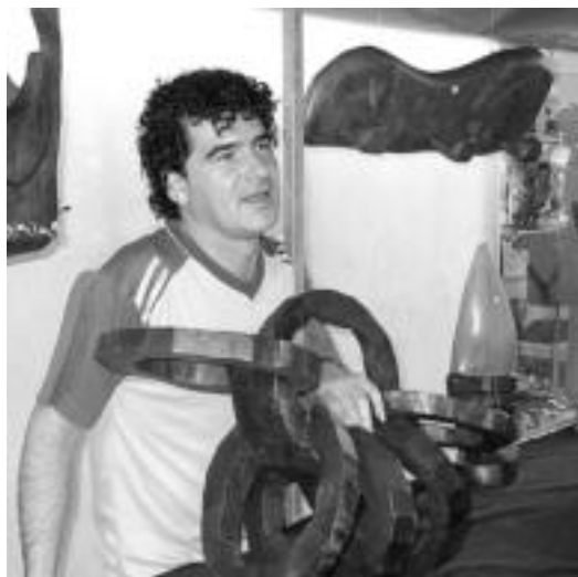
Eskulanak. Larraulgo Karlos Irazuk eskulanak erakutsi zituen. J. ASTIBIA

pena daukagu eta lan hori egin behar izaten dugu. 06:00etan jaiki eta 6:40ak aldera Ordiziara iritsi gara. Eta iristen azkenegoa izaten naiz, hortik pen-tsa. ◀