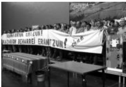
Ordiziako pilotalekuan burutu zuen kontzentrazioa EHNEK. HITZA

Lehen sektorerako laguntzak eskatzeko kontzentrazioa egin zuen EHNE sindikatuak