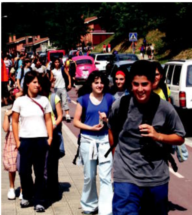
Tolosa. Laskorain ikastolako DBHko ikasle batzuk ikastetxetik irtetzen, ikasturteko lehen eguna pasatu ondoren. Lehen egunetan behintzat arratsaldez jai izango dute. IRATXE ETXEBESTE

LANA ETA JOLASA ▶ Aurpegi alaiak ikusten ziren haurren artean; ikasketarekin batera, jolaserako ere aprobetxatu zuten eguna ▶ 2-3