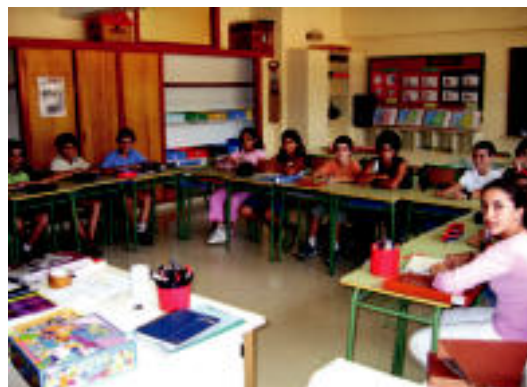
Zizurkil. Otaño eskolako ikasleak gelan, lehen egunean. Ez zuten pena handirik oporrak amaitu zaizkielako. MADDI SOROA