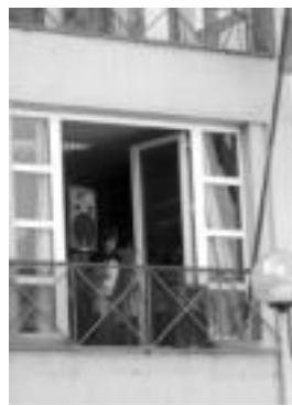
Haurrek bota zuten festetako lehen bupinazoa Zizurkilen.

daion, adin gurutzetarako hainbat ekitaldi antolatu direlarik. Zizurkilen, 16.30erako plaza bete haur eta gazte zegoen atzo, festak hasieraz zuden eta nabari zen hori giroan. Egitarauko lehen ekintza haurrek burutu zuten, oportunitate euskarazko ibiliko gaztekoek eguneko lehen txupinazoa bota zuten, bertsoez lagunduta.