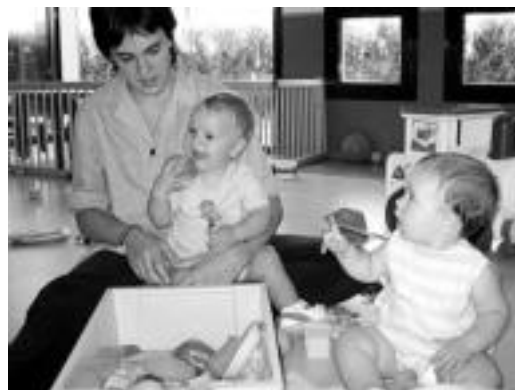
Ibarran. Haur Eskolakoak egokitzapen garaian daude. MADDI SOROA

Ibarrako Haur Eskolan irailaren 1ean hasi zuten ikasurtea, eta honezkero bigarren astean sartu dira. Oraindik, baina, ez dira ohiko ordutegiarekin hasi: lehenengo asteak haurraren egokitzapenerako izaten dira, eta «gurasoak haiekin egoten dira hemen». Munduarekin duten lehen harremana da.