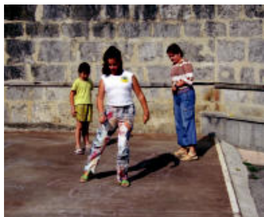
Altzo. Jolaserako denbora ere izan zuten ikasturteko lehen egunean Altzoko eskolako hurrek. MADDI SOROA