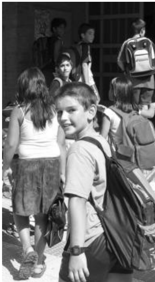
Zizurkilen. Pedro Mari Otaño ikastetxeko ikasleek gustura ekin zioten atzo ikasurteari. Oporretan hobeto egoten omen da, hala ere.