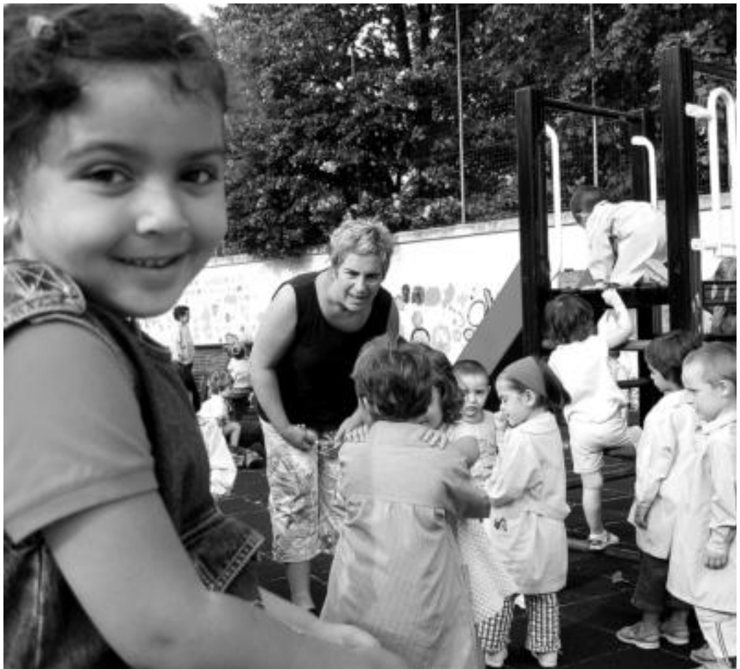
Tolosan. Laskorain ikastolako ikasleek jolasean eman zuten goiza atzo Sakramentinoetako jolaslekuan; gustura joan ziren gehienak. MADDI SOROA

Egun gutxi barru ohikora itzuliko badira ere, ikasleek egokitu egin behar izaten dute udako oporren ostean eskolara edo ikastolara. Baita irakasleek ere, eta, txikienen kasuan, gurasoak dira, ez bairrik gabe, egokitzapen gehien behar iza-