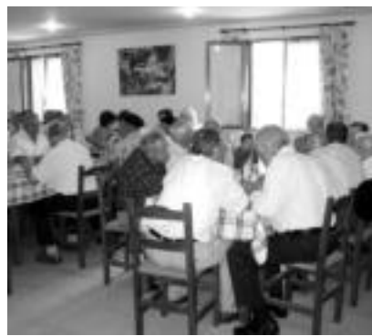
50 bat jubilatu bidu ziren Alkizako Otsamendi jatean bazkaltzeko. G. AZKUE

Elduainean jaiak datoren urterarte agurtu esaten baitzen, atzo eman zieten ongiroterria Bediaion herriko jaiak ohiko suziri jaurtitzeko. Meza nagusiaren ondoren, berriz, elkartean bildu ziren herrikoak hamaiketako egiteko. Giro polita nabari zen bertan, eta jaietarako zuten oratidiki, bazkaria ere elkartean bertan egin baitzuten. Arratsaldean, pilota partidak izan ziren nagusi, eta ondoren, giroa Laja eta Landakandak jarri zuten pandero eta trikiti doinuekin. Igandera bertarke festa giroa itzango da Bediaion.