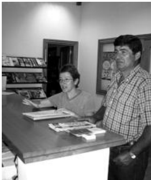
Ekainaren 17an sartu zituzten sinadurak erregistroan. J. ASTIBIA

Sinadurak aurkezterakoan Herri Kontsultaren Aldeko Talde Sustatzaileak adierazi zuten «eman beharreko pauso guztiak Foru Lege horren arabera egin ditugu eta ez dugu