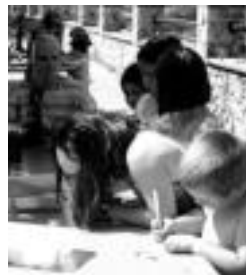
Aurten ere marrazki lehiaketa egingo da. M. JAUREGI

Gauean, gainera, Kauta talde andoiaindarra eta Aguraingo