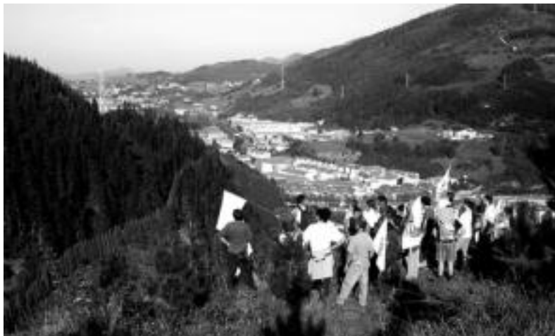
lazo urrian antolatutako AHTren Aurkako Astearen baitan, mendi ibilaldia egin zuten Elkarlanekoek eta herritarrek, kaltetutako inguruak aurrez aurre ezagutzeko. HITZA

Zundaketa lanen aurreran Udalak hartutako jarrera ere kritikatu dute taldekoek. Haien esanetan, aurreko Udalak, «beste udal eta lurjabeekin batera eta udal aparejadorearen iritzian oinarriturik» ez zien baimenik eman lanei. Egungo Udalarekin jarrera aldatu egin dela adierazi dute, era berean: «Agintean ditugun araberak,