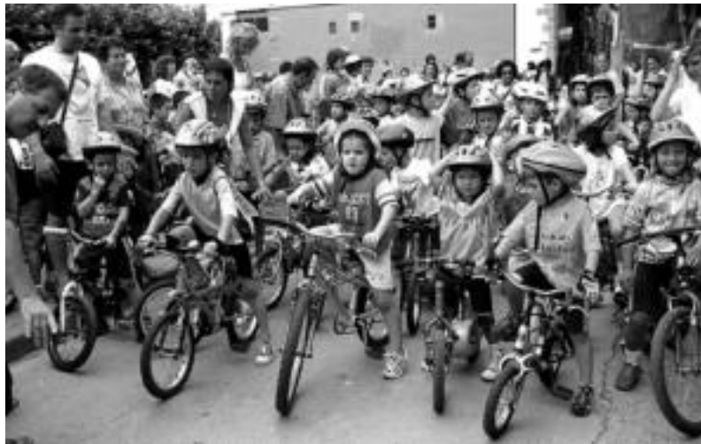
Herriko txikitxoek abiatu ziren lehenengo Errebote plazatik. G. AZKUE