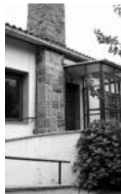
Patxi Arrazolako egoitza. J. ASTIBIA

Baina abuztuaren 9tik aurrera, jada egoitza berrian, berriz ere ohiko zerbitzuak emateari berrekinen omen diete. Nahiz eta lekuz aldatu,