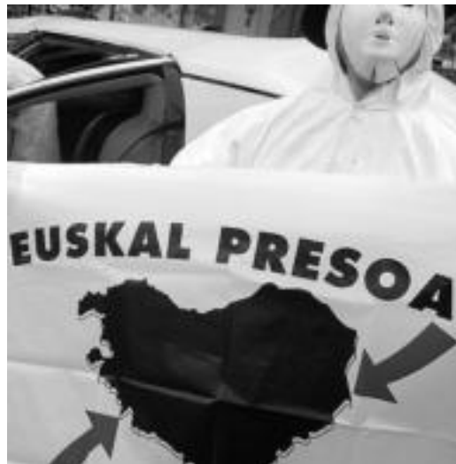
Presoen Euskal Herriratzera eskatuko du udan ere Etterat-ek. HITZA

Nazio mailako udako bi ekimen horiek —eta, batik bat,