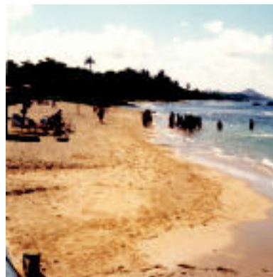
Mendia, hondartza, atzerria, etxea... Argazkietan: Venezia, Pirinioak, Irlanda eta Karibe. HITZA