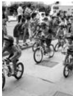
Ederki moldatu ziren txikiak txirrinduariekin. G. AZKUE

11:00etatik 13:30era. Gorritiren haur jaialdia izango da Errebote plazan. 14:30. Koadrilen arteko bazkaria Etxe-Ondon. Ondoren. Kalejira Incansables