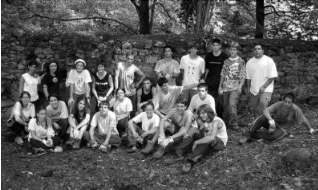
Goizero, astelehenetik ostiralera Plazaolako auzolanean landaretza garbitzen lanean aritzen diren hogeitaz gazteak. D. GIBELALDE