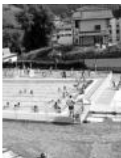
Bilera igerilekuan eginen da. J. A.

Jarduera hau antolatzeko diru laguntza, herriko hamaika denda eta lantokik eman dutela adierazi dute ere.