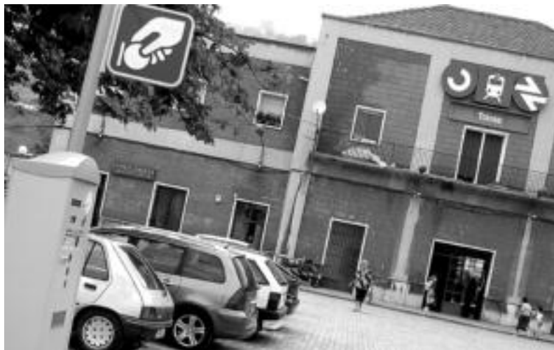
TAOgune berdeetan —Zumardi Txikian eta Geltokialdean— tarifikak jaitsi ditu Udalak. IRATXE ETXEBESTE

Langile autonomoek eta enpresek banakako parkimetroak lortu ahal izango dituzte; prezioa jaitsi dute gune berdeetan