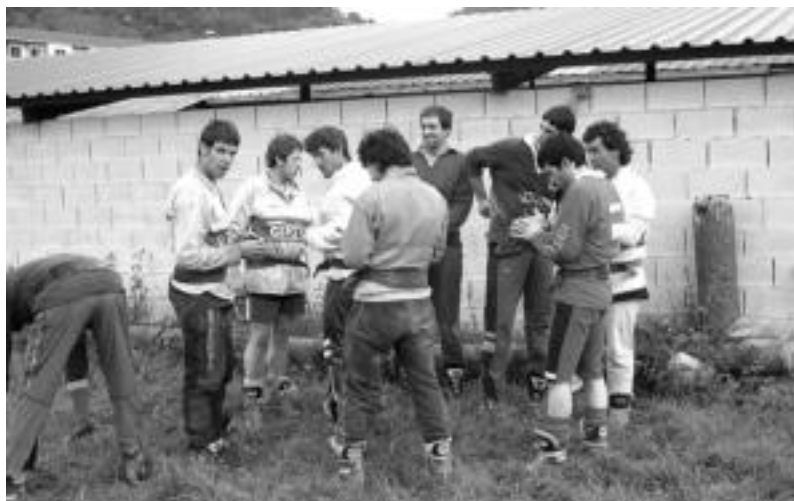
Aresoko sokatiralariek entrenamendu saioan, jarraitu beharreko plangintzaz hizketan. JAIONE ASTIBIA

Pisu handikoen finala jokatuko da Azpeitian; Leitzan Haur Igeriketaren XVII. Bileran burutuko da bihar igerilekuan