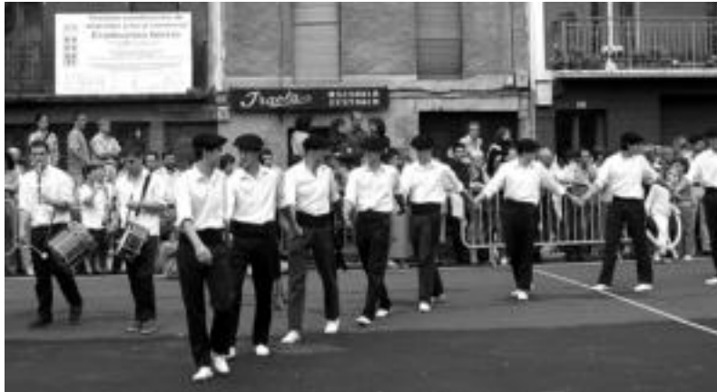
Soka dantza aurten ere eskainiko dute Erreboten plazan Santio egunean arratsaldean.

Alde batetik Villabona-Hazparne lehen errebote partidaren 75. urtemuga izanik, omenaldi eta ekitaldi berezia izango da 31n. Haurrei zuzendutako ekitaldiak ere aipatzekoak dira, ia egunero baitago zer-bait. Onddo gazte asanbladaren partaidetza ere azpimarratu behar da, «bereziki» hartu