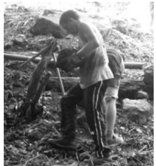
Landaretza garbitzen lan handia egiten dute gazteek. D. GIBELALDE

Auzolandegiko bultzatzaileen asmoa «pixkanaka-pixkanaka ondare historikoa berreskuratzen hastea da. Panel informatiboak jartzeko asmoa dugu inguru honetan, bertako historia azalduz eta elementu desberdinekin, jendeak zer dagoen eta zer nolako balioa duen jakiteko».