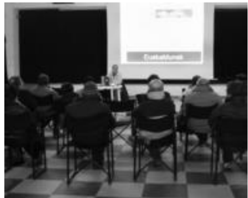
Eskualdeko hainbat herritan izan dira Nabarraldeko kideak.