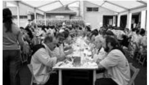
Koadrilen Eguneko bazkarirako une bat.

Hilaren 22an eta abuztuaren 5ean ipiniko dituzte salgai Sendi Ekintzan, 20:00etan