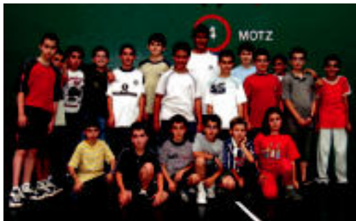
Pilota eskolako arratsaldeko taldea Beotibarren. JOXEMI SAIZAR