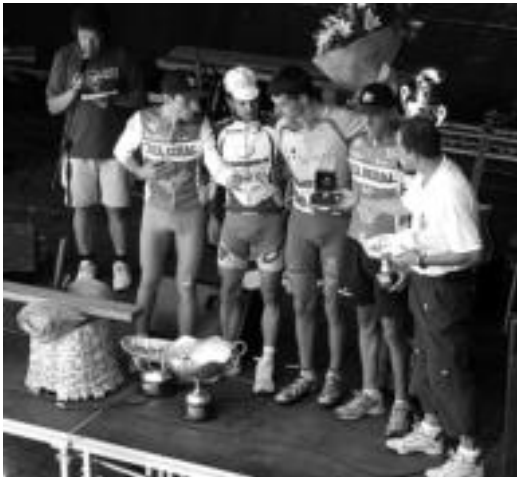
Probako lehenengo hiruk ezetik mendian hoberen ibili zen txirrindulariari ere eman zioten saria. O.ESKITSABEL

Bizkaitarrak Ruiz de Larrinaga eta Josu Agirre utzi zituen atzean esprintean