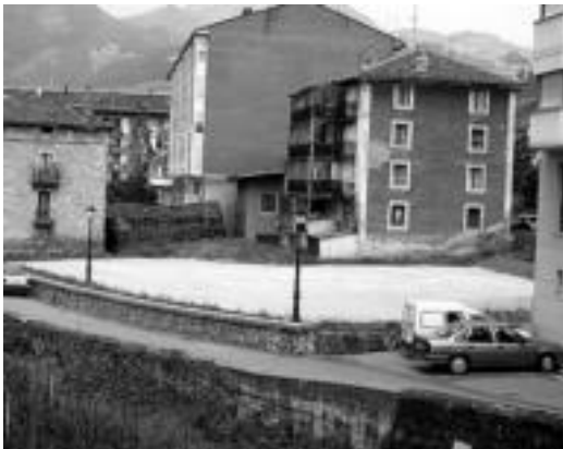
Beheko-bideko zelaian autoak aparkatzeko egokitu dute. JOXEMI SAIZAR

«Edozein hormatan» kartelak jartzen direla eta neurriak hartuko ditu Udalak; taulak jarriko dituzte kartelak jartzeko