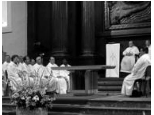
Uriarterekin batera, apaiz ugari ikus zitezkeen aldrearen. O.ESKIXABEL