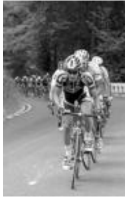
Talde nagusia maldan gora. HITZA

Ordiziara bi joan-etorri burutu zituzten, hirugarrenean Zaldibiatik Larraitzeko mendatea igotzeko. Ondoren, berriz ere Ordiziara joan eta itzultzerakoan Orendaingo mendatea igo zuten bitan bigarren igo eraren ostean Alegiara itzuli eta bertan helmugarazteko.