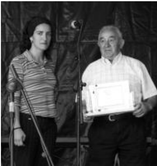
Orbegozok herriko alkatearen eskutik jaso zuen oroigarria. O.ESKIXABEL

Herriko alkateak oroigarria eman zion; Beltranek eta bere taldeak Intxaustiri 'Kontradantza' abestia eskaini zioten