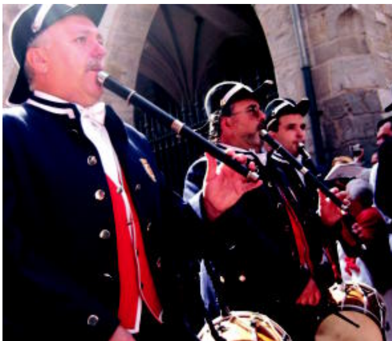
Udal Txistulari Bandako kidean San Fermin eguneko prozesioan. JOXEMI SAIZAR

IRUÑA ▶ Tolosako Udal Txistulari Banda eta Incansables eta Iraunkorrek txarangak egunero aritzen dira sanferminei musika jartzen