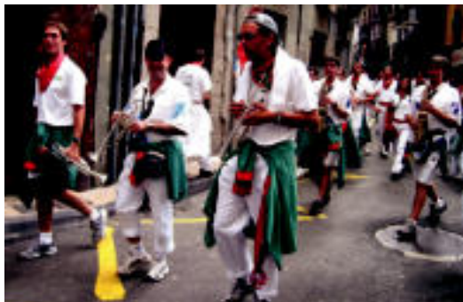
Incansables txaranga zezen-plazarako kalejiran. J.SAIZAR

Tolosa. Los Veracruz. 22:30ean, Plaza Berrian. Gau Giro-ren baitan.