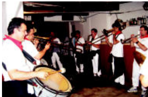
Iraunkorrek txaranga peña batean jotzen. J.SAIZAR