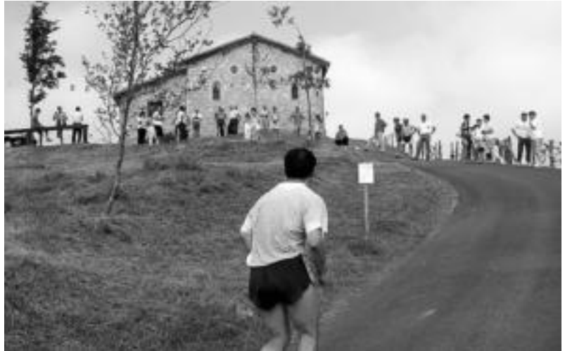
Aurtien Santamañako igoeraren laugarren saioa izango da; argazkian, iazko saioa.