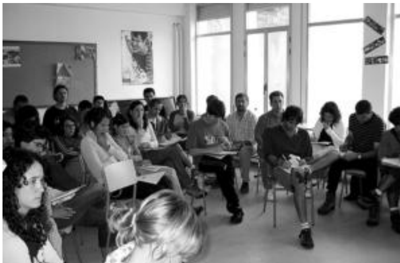
Leitzako barnetegiko ikasleak adi-adi, gaztagintzari buruzko bideo bat ikusten ari zirelarik. JAIONE ASTIBIA

Barnetegian, inguru euskaldunaz baliatuz, euskaraz biziz, euskara bera ikasten edo hobetzen dihardute