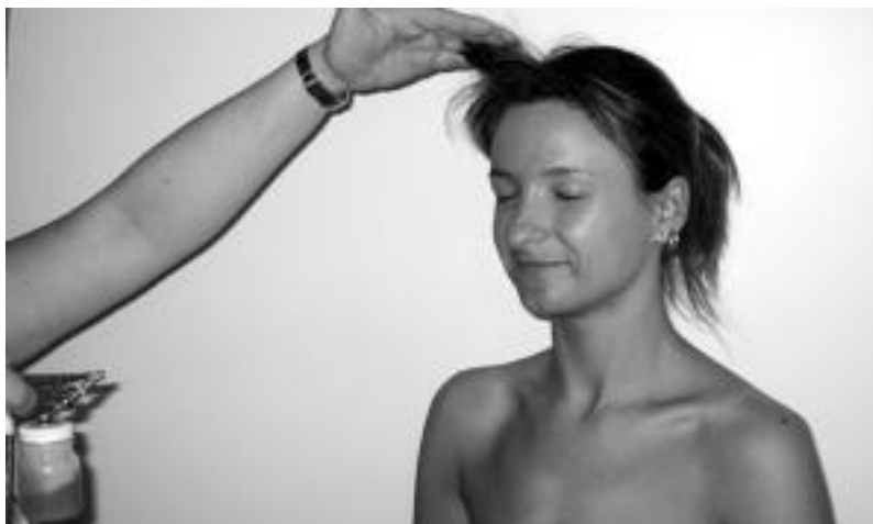
Azukre kainabera hautsezko tratamendua benetan atsegina dela diote bezereok. I.Asensio

AEBetik etorri berri den asmakuntza honek, azukre kainabera bidez belzten du azala inongo arriskurik gabe