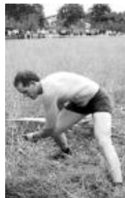
Igandean arituko da Urki. HITZA

Aurreko igandean Azkaraten (Nafarroa) izandako kanporaketa proban, besteak beste, Aranalde gazteluarra sailkatu