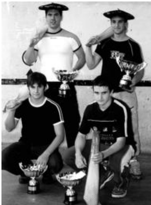
Txapela, Kopa eta urdaiazpiko bana lortu zuten Usurbilen.

Gaur Antiguako txapelketan izango dira; bertan irabaziz gero, final-laurdenetarako sailkatuko dira. «Finalera iristeko esperantza eta gogoia behintzat ez zaizkigu falta», dio Galarragak. Uztailaren 14ean, bestalde, Oretetako txapelketan finalerdiko partida jokatuko dute.