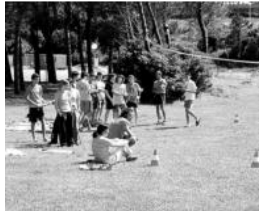
Gorlizeko aterpetxean egongo dira gazteak. TROKA ABENTURA

Bigarren egunetik aurrera, goizero, surf ikastaroak antolatu dituzte gaztetxoentzat. Arratsaldean, lehen egunean, surf ikastaro teorikoa antolatu dute; bigarren egunean taulen tailerrera joango dira. Hirugarren egunean kanoetan zeharkaldia egingo dute eta bosgarren egunerako eskalada eta