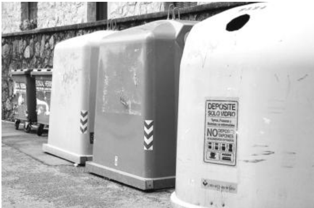
Gaikako bilketarako edukiontzia: zaborra botatzekoa, ontziak botatzekoa, paperena eta beirarena.