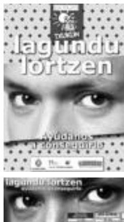
Goian, informazio liburuxkaren azala; behean, pegatina. HITZA

Bestela, 20:00etatik 21:00etara utzi behar dira edukiontzi urdinen alboan, astegunetan soilik; asteburutan ezin dira kartoiak osorik kalean utzi. Olioak eta beste hondakin arriskutsuak. Hilabete bakoitzeko azken larunbatean jasotzen dituzte Triangulo plazan, 09:00etatik 13:00etara. Altzariak eta tamaina handiko tresneria. Tolosaldeko garbigunera eraman daitezke —Anoeta eta Alkiza arteko errepidean—. Edo, bestela, edukiontziaren alboan utzi, asteazkenetan, 20:00etatik aurrera; horretarako, 902 11