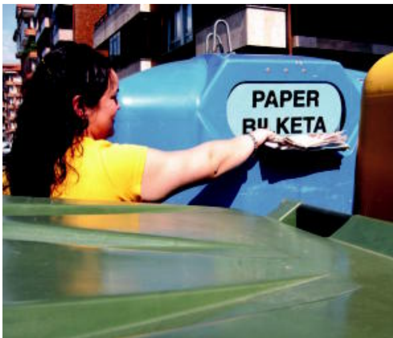
Zaborrak ateratzeko ordutegia jarri dute; bakoitza dagokion edukiontzian bota behar da. LEIRE MONTES

ISUNAK ▶ Zaborra ateratzeko eta birziklatzeko arauak jarri dituzte; betetzen ez dituenak isunak izango ditu ▶ 2