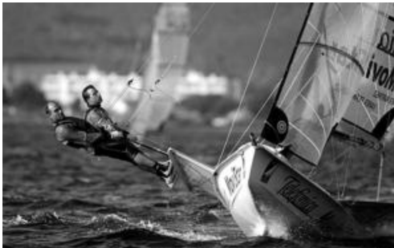
Xabi Fernandez eta Iker Martinez de Lizardui, aurreko proba batean.

Txapelketan ontzia irauli eta Iker Martinez de Lizarduik eskuan min hartu du