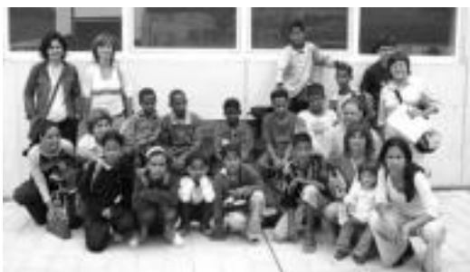
Zonaldera etorri diren saharar umeak, Leitzara iritsitakoan.

Astearte goizean atera eta atzo eguerdian iritsi ziren Saharako kanpamentuetatik udako bi hilabetetarako