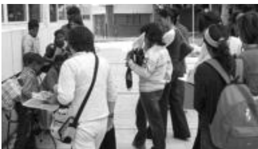
Hemengo familiekin elkartu zireneko unea. J. ASTIBIA