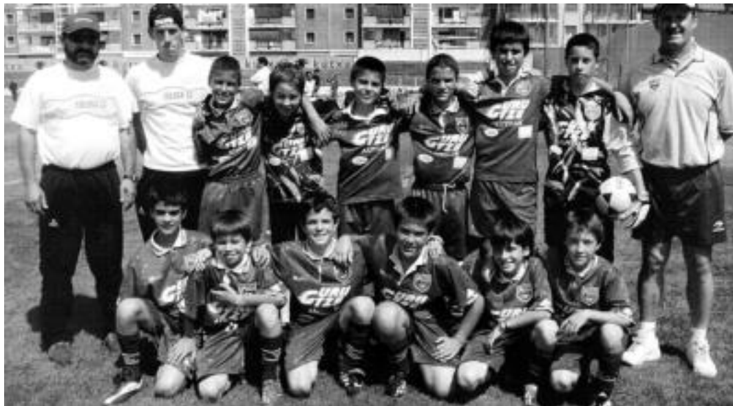
Tolosa CFko alebin mailako mutilak bigarren sailkatu ziren Sanjoanetako futbol txapelketan, Realaren atzetik. HITZA

Tolosa CFko mutilek bigarren postua lortu zuten Berazubín jokatu zuten lehiak; nesketan ere Reala izan zen irabazle, taldearen estreinuan finala erraz irabazita