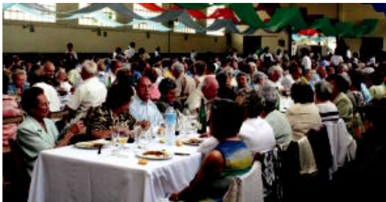
Igandeko bazkariko irudi bat, ehunka jubilatuta Ferialekuan bazkaltzen.

TOLOSA ▶ Igandean egin zuten urteroko bazkaria Ferialekuan Harizpe eta Iturriza elkarteek antolatuta Udalaren babesarekin