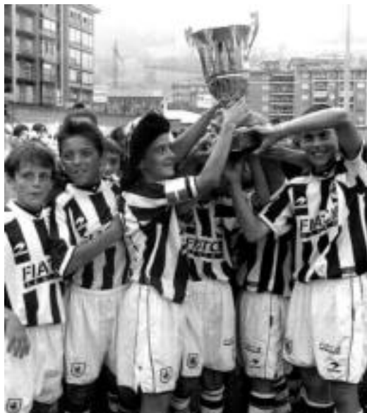
Reala izan da aurtengo txapelketako irabazle. HITZA

Igande arratsaldean iritsi zen txapelketaren interes handieneko momentua, bi finalak heldu zirenean. Alebin mutilen finalean Tolosak eta Realak neurtu zituzten indarrak, donostiarrek 5-0eko garaipena lortu zutelarik. Nesketan, berriz, Reala eta Athletic aritu ziren nor baino nor, berriz ere donostiarrek 5-0ekoa lortuz. Honela, Realak garaipen bikoitza erdietsi du aurtengoan. Ai-