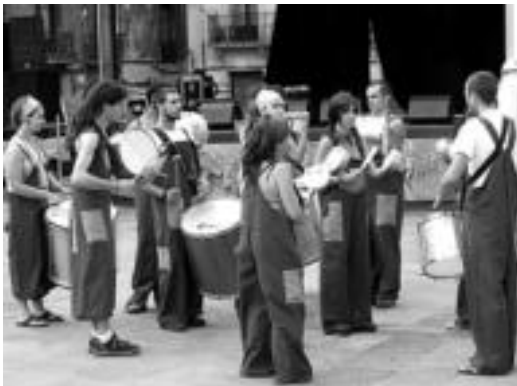
Mulambo taldea. Perkusio erritmoek hartu zuten lekukoa Koadrilen arteko bazkariaren ondoren; hamar lagun inguruko taldea Plaza Berritik abiatu zen eta herriko kaleak alaitu zituzten. IÑIGO TERRADILLOS