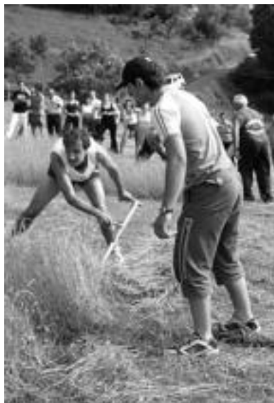
Segalariak lehiatu ziren Belauntzan. D. GIBELALDE