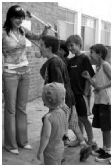
Belauntzan jolastu ziren haurrak. D. GIBELALDE