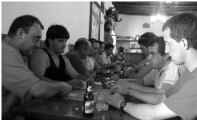
Hemezortzi bikotek eman zuten izena Abaltzisketako II. Mus Txapelketa herrikoian. OLAIA ESKITXABEL

Belauntzan atzo amaitu ziren jaiak eta Abaltzisketan gaur; Leaburuko sanpedroetan gaur herri kirolak izango dira