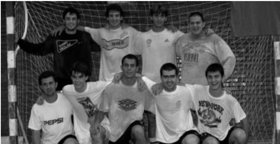
Tolosa Kup. Berazubiko kiroldegian jokatu zen atzo eguerdian Tolosa Kup-eko finala. Kupelzaleak taldeko kideak izan ziren aurtengo txapelketako irabazleak; Santos harategia taldeko jokalarien aurka jokatu zuten. Argazkian, Kupelzaleak taldeko jokalaria. IÑIGO TERRADILLOS