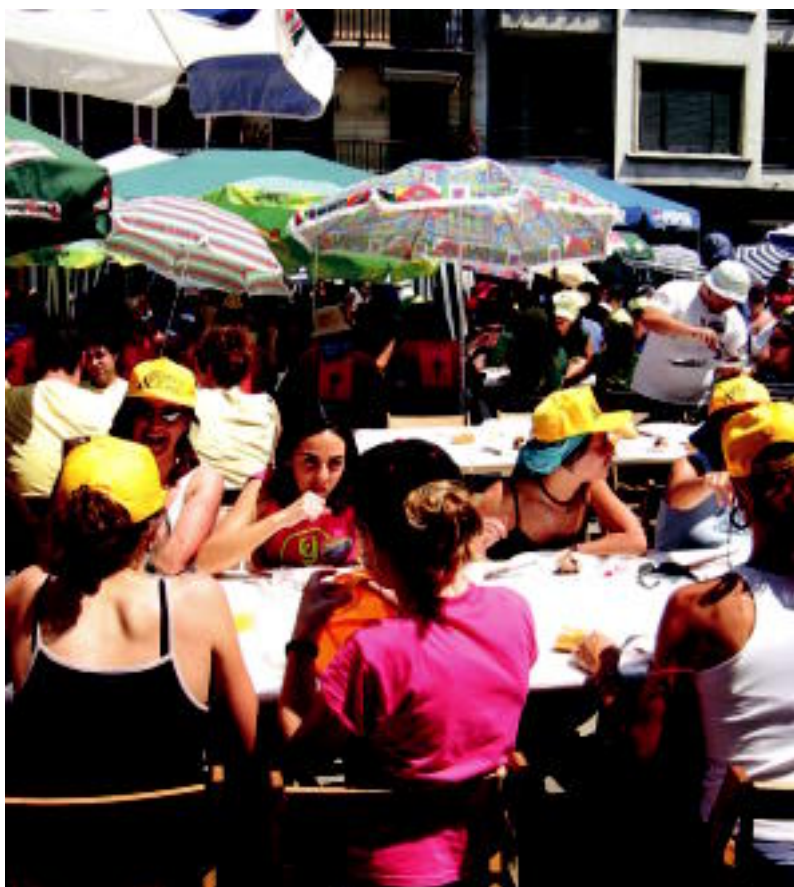
Bazkaria. Jende asko bildu zen Plaza Berrian Koadrilen Eguneko bazkarian. Eguzkiaz babesteko guardasol ugari jarri behar izan zituzten koadrilek. IÑIGO TERRADILLOS

KIROLA ▶ Tenisean Aldazek irabazi zuen, txirindularitzan Julen Gonzalezek eta Tolosa Kup-en Kupelzaleak taldeak ▶ 4-5