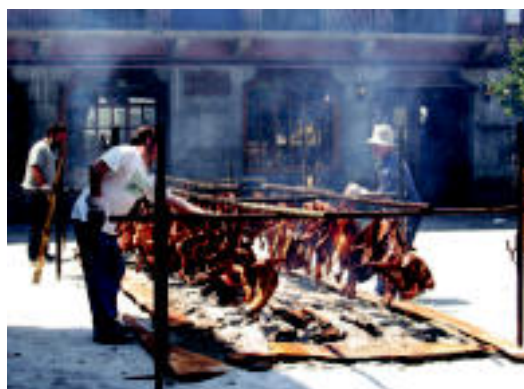
Zikiroa. Koadrilen Eguneko bazkarian zikiro jatea izan zuten. Goiz osoan zehar aritu zen talde bat zikiroa prestatzen. IÑIGO TERRADILLOS