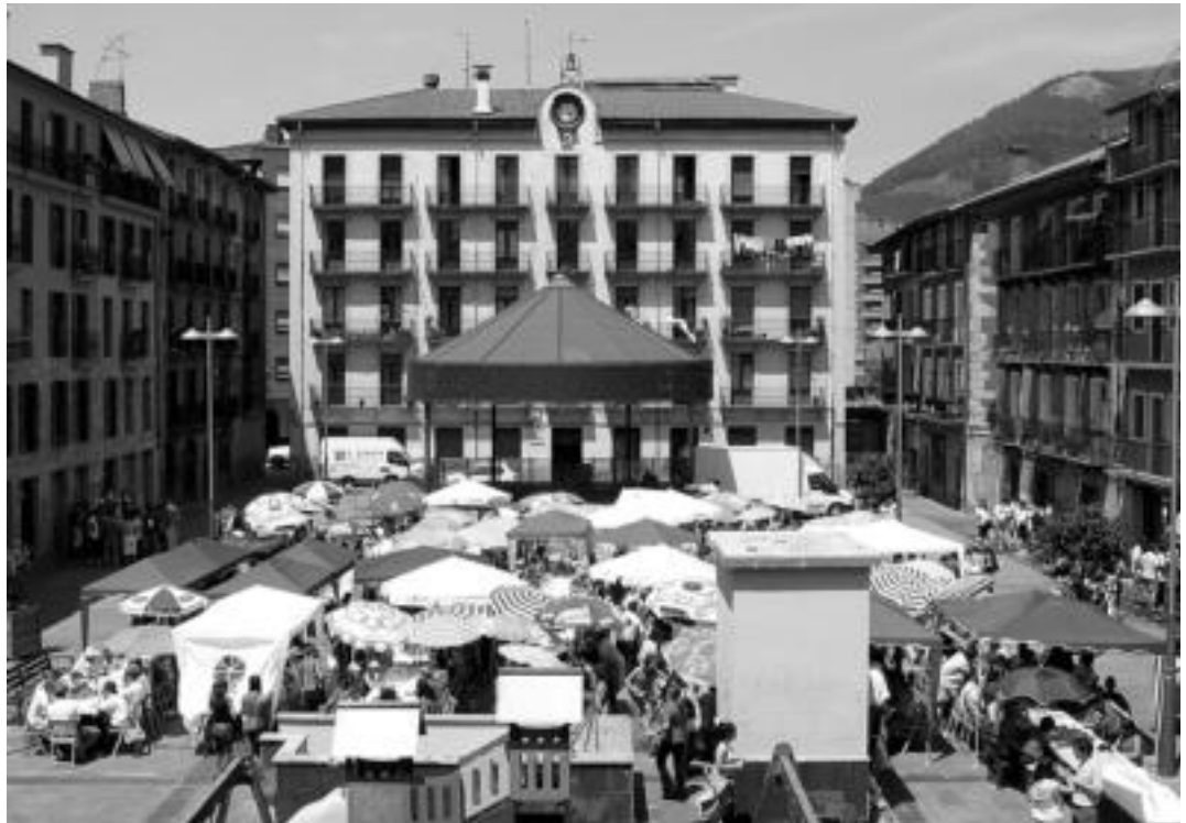
Harerik gabeko hondartza zirudien atzokoan Plaza Berriak koadrilen arteko bazkarian eguzkitako eta itzalkinez bete baitzen.