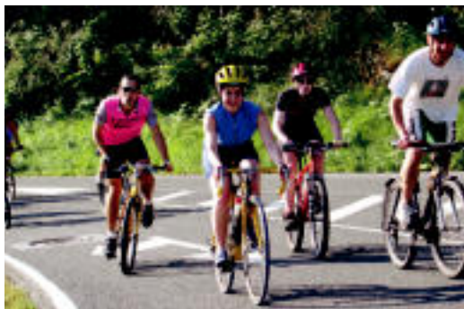
Tolosaldeko lagun batzuk Albizturko igogera. JOXEMI SAIZAR

TOLOSA-ONDARROA ▶ Bi herrietako lagunek Dina Bilbao izan zuten gogoan bizikleta martxarekin; kamiseta lehiaketan eskualdeko ordezkariak izan ziren