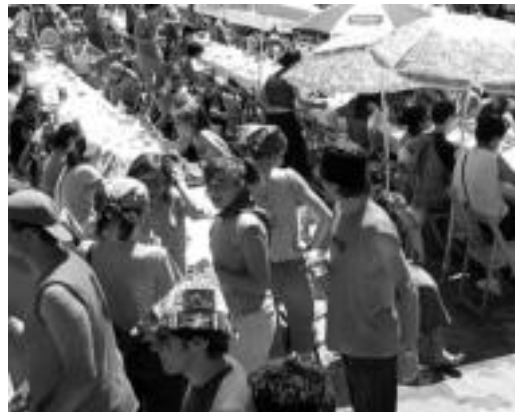
Koadrilen Eguneko bazkaria izango da gaur Plaza Berrian. I. ETXEBESTE

Berez eguerdian hasiko dute Koadrilen Eguna. Eguerdian Berazubín bilduko dira denak, bakoitza bere blusa edo kamisetarekin, eta guztiek Koadrilen Eguneko zapi urdina lepotik zintzilak dutela. Jokoak, txiste, irrinti eta bertso lehiaketa, kalejira, dantzaldia... ekitaldi asko dituzte prestatuta Koadri-