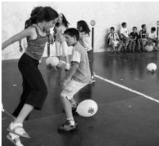
Puxikak zapaltzen jolastu ziren gaztetxoak Abaltzisketan. O.ESKIXABEL

San Joan jaien baitan Abaltzisketan haur jolasak izan ziren eta Belauntzan jolasez gain pailazoekin eta Eriz magoaren ikuskizunarekin gozatu zuten; gaurkoan ere ekitaldi ugari izango dira bi herrietan