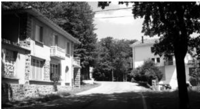
Gorritarango egunean jendez eta festaz beteko dira errepideak ez ezik txokoak ere. JAIONE ASTIBIA

Ekaineko azken igandea izaki, San Pedro eguna aitzaki hartuta, egun beteko festa antolatu dute auzotarrek