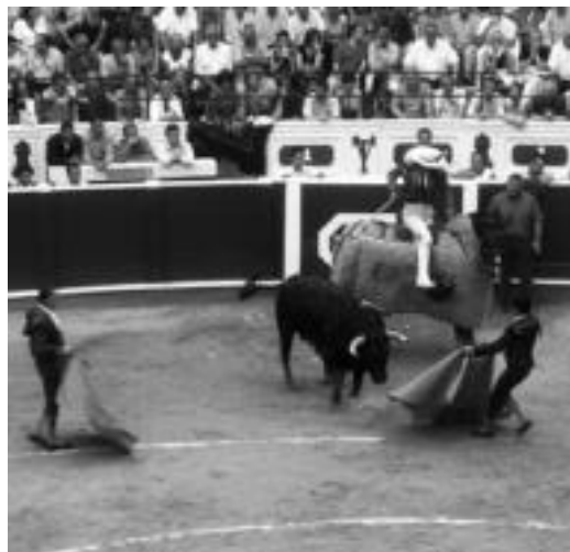
luz, Tolosako zezen-plazan izan zen zezenketako irudi bat. JOXEMI SAIZAR

Zezenketarako txartelak salgai dira Triangulo kafetegian, Asteasuarra eta 66 tabernetan eta Orue erretegian. Bihar zezen-plazan bakarrik salduko dituzte 10:00etatik aurrera. 12 eurotik 400 eurora balio dezakete, gerizpearen edo eguzkia-ren eta lekuaren arabera.