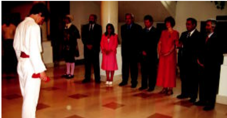
Ekitaldiaren hasieran, dantzariak Agurra eskaini zien agintariei Gorosabel zaharrean.