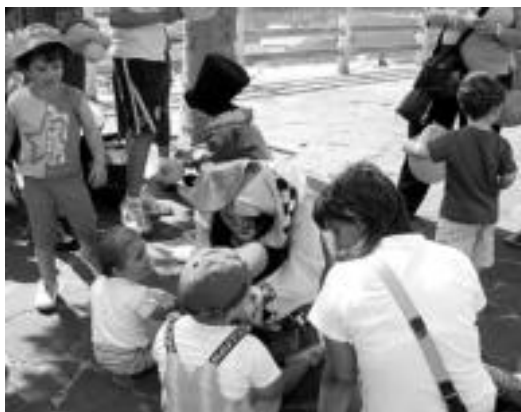
Pailazoak haurrekin aritu ziren jolasean Belauntzan. D. GIBELALDE