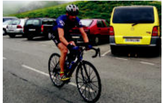
Ibartar ugari ikus zitekeen Quebrantahuesos proban. LEIRE MONTES