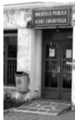
Leitzako frogen lekua. J. ASTIBIA

Langile berri horren izendapena, hurrengo udal batzarrean egingen omen dute, adituzera eman dutenez.