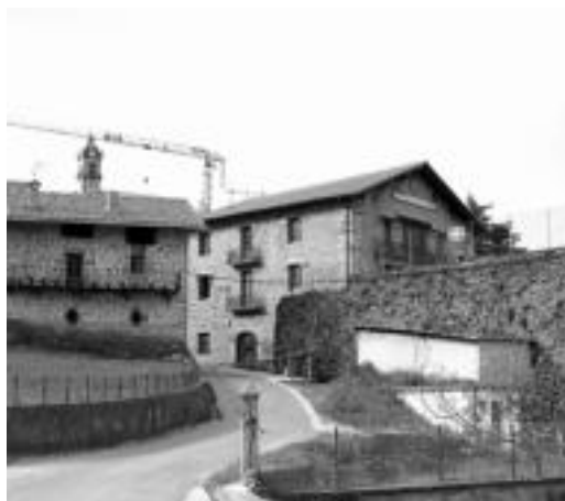
Aresoko Udaleko langile izanen da albintea. JAIONE ASTIBIA