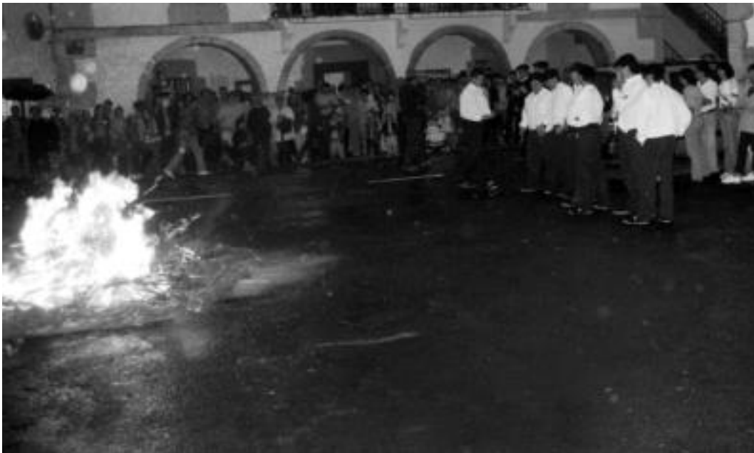
Eskualdeko herri askotan piztuko dute bihar gauen San Joan sua; askotan, herriko jaien hasieraren iragarpena izango da, gainera. MAIDER JAUREGI

Albatzisketan eta Belauntzan jaiak egingo dituzte; Alegian, Amasan, Anoetan, Areson, Leitzan, Villabonan eta Zizurkilen ere ekitaldiak izango dira