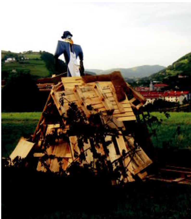
Leku askotan San Joan sua prestatzen aritu dira egun hauetan. Argazkian, San Blas auzoan. JOXEMI SAIZAR

JAIK ▶ Abaltzisketan, Belauntzan eta Tolosan herriko jaien hasiera izango da; igandera bitarte luzatuko dira ▶ 2-5