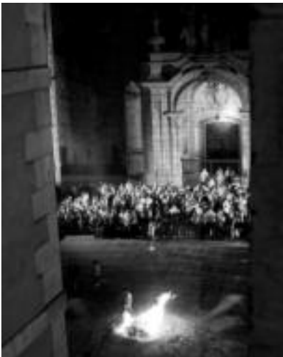
Jende ugari bilduko da gaur San Joan suaren bueltan; argazkian, lasio ekitaldia. «eta.coucou»

Urteko gaurik motzenezan izango da gaurkoa. San Joan bezpera. Usadioak hala dio: San Joan suak igurtitu txarrak usadiozko balio duela. Dimean alferrik ziren tramankuluak pilan jarri eta erre egiten zizuten garai batean. Egun ere plaitzen dituzte sua ahalik eta handien izan dadin. Batzuk su garren gainean egiten dute sailto, eta besteak aski dute haien begirtze arekin. Eskualdeko herri guztietan bezala, Tolosan ere modu berezian ospatuko dute gaur San Joan bezpera. 22:00etan hasiko da San Joan sua laguntzen duen ekitaldia. Ordu horretan San Joan martxa joko du Tolosako Udal Musika Bandak oholtra gaitetik, eta herriko musikariek dotu hori jotzen ari diren bitartean piztuko dute sua Santa Mariako plazan. Tolosako Udalako agintariek bertan direla, bertarrek suaren inguruan sailto egiteko aukera izango dute handik aurrera otorduak edo eta behin sua izaituta dagonean Udaberri Dantzari Taldearen emanaldia hasiko da. San Joan zortzoko jo ondoren, kalez kale ibiltzera abiatuko da Tolosako Musika Banda. Zortzi dantza eskainiko dituzte Udaberri neskak eta mutilak 22:25ean hasita. Urdain, Agurra, Zinta dantza, Broketa dantza, Mexi handi, Urtai Txiki dantza, Jorrai dantza eta San Joan dantza , hain zuzen ere Txistulariek jotako dot.