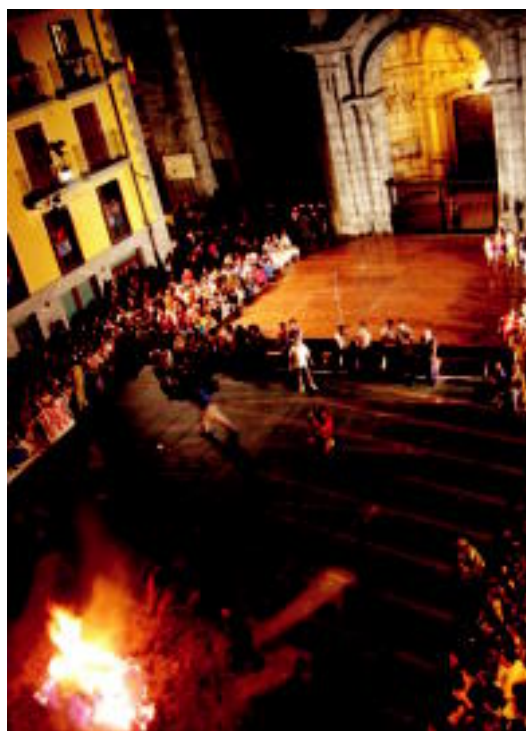
Urteroko ohitura berrituko da Tolosako Santa Maria plazan.