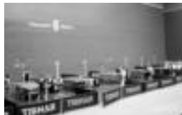
Hainbat parte-hartzaile, lehiatu, Beotibar pilotalekuan. «eta.coucou»

30 gaztetxok hartu dute parte; mahai-tenisa sustatzea eta ezagutzera ematea, gakoa