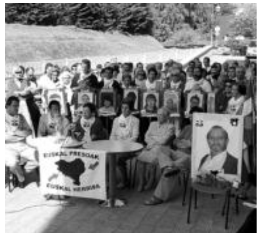
Senitartekoak eta Etixerat-eko ordezkariak, agerraldian. D. GIBELALDE

Gogoetarako deia luzatu zieten Euskal Herriko eragileei, «jada 67 lagun baitira sakabanaketak eragindako istripuak jasan dituztenak eta 15 politikak horrek hildakoak».