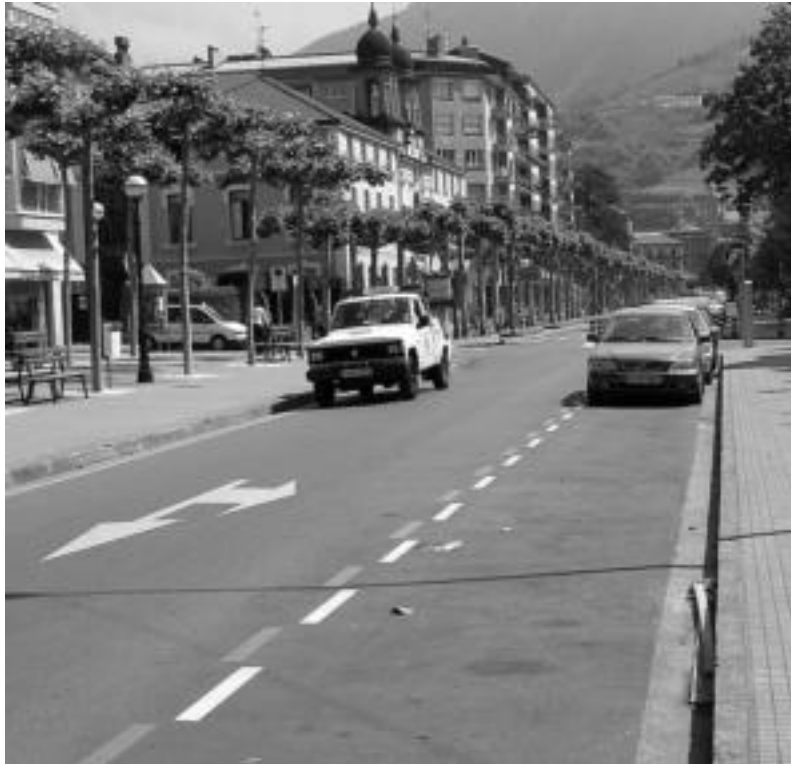
Aparkaleku mugatua dagoen orduetan lekua soberan egoten da TAO ezarrita dagoen guneean. I. TERRADILLOS

TAO hedatu izanak ondorio onak izan dituela eta hasierako helburuak bete dituela azpimarratu dute, onura hauek ekarri bestea beste: jende gehiago gerturatzen da orain Tolosara bai erosketak egitera bai bestelako eginbeharrak burutzera. Honek trafikoa han-