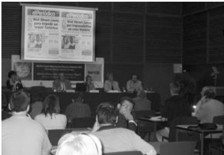
Ikusmin handia sortu zuen HITZAREN proiektuak. JON MARTIN