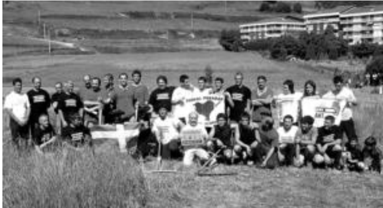
Sega apustuan aritutako lehiakide, zorrotzatzaile, belar biltzaile eta epaileak, atzo. DANI GIBELALDE

Egitarau ofizialari dagokionez, VII. Pilota Txapelketako finalak jokatu ziren atzo. Goiz nahiz arratsaldean, herriko artisten erakusketa eta Basagaingo burdin aroko herrixkari buruzko erakusketa izan ziren udaletxean. Orain dela 2.500 urte inguru, giza talde bat kokatu zen Basagain mendialdean. Oria bailarako kaskoetan. Giza talde hark barruti bat harresiz itxi eta harresiz barrura herrixka bat eraiki zuen, egur