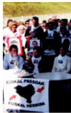
Tanatorio atarian, atzo.