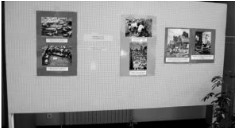
Basagain burdin aroko herrixkari buruzko erakusketa ikusgai izan zean atzo udaletxean. D. GIBELALDE

eta buztinezko etxeekin. Abeltzantzan eta nekazaritzan aritzen ziren, eta burdina erabiltzen zuten estreinakoz laborantzarako tresnak eta beste-lako erremintak egiteko. Orduko bizimodua gogora ekarri eta agertu nahi izan dute Basa-