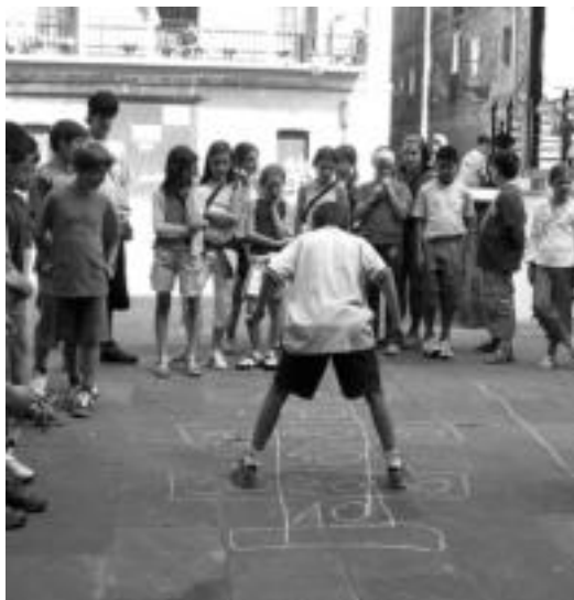
Besteak beste, lurrean margotutako txingoan jolastu zuten . HITZA

Gaur, bazkaria egingo dute Eskolapioetan. 14:00etarako egin dute hitzordua, eta gisa horretara emango diete urteurrenreko ekitaldiei bukaera.