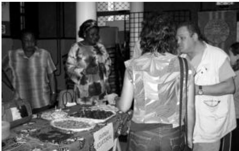
Gineako Errepublikako jantziak soinean, bertako ebafoa prestatu zuten jendeak dastatzeko.