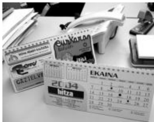
Sustapeneko hainbat produktu: egutegi-agenda, dendetako beherapenak, zozketak (Shuynako sari irabazlea) eta mahaiko egutegia. HITZA

HITZAREN harpidedun laguntzailea izateak baditu bere abantailak.