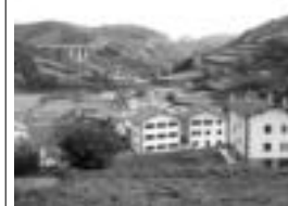
Aresoko herria; Leizaldean hasi da banatzen HITZA.

Maiatzaren 21etik jasotzen ditu HITZA Leizaldeko herriak eta bertan banatzen da doan asteartetetik igandera. Leizak 2.955 biztanle ditu eta %90a euskaldunak dira. Aresok berri. 294 biztanle ditu eta %98a euskalduna da. Lehen aste hauetan Leizta eta Aresoko buzoi guztietan banatzen da, beraz 1.000 ale in-