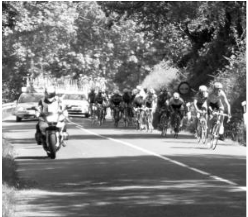
Bidegoian zeharkatu ondoren, Errezil aldera abiatu ziren bixirrindulariak.