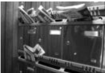
Harpidedunek etxeko buzoian jasotzen dute egunero HITZA. JAKINE ASPIBIA

deko eguneroko informazioak ez zuten etenik izan. Galtzaundi mantentzea erabiliz, lehen egunetan aldizkari neurrian eta ondoren egunkari neurrian. 2003ko martxoaren 25etik Tolosaldeko HITZA izenez kalearatu zen eskualdeko herri informazioa. Gaur egun Tolosaldean