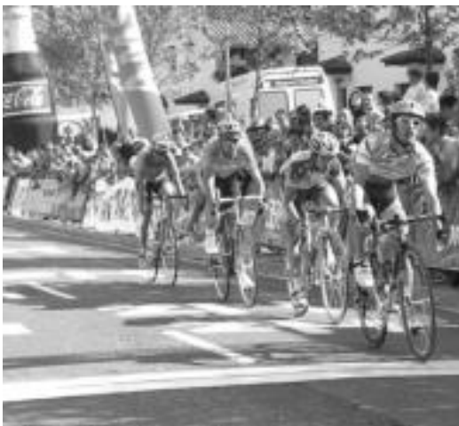
Irabazleen ondoren helmugara iritsitako laukotea. O.ESKITXABEL

troko ibilbidea egingo dute. Arratsaldean, berriz, Elorrio eta Matiena artean izango da erlojupekoa. Bihar amaituko da aurtengo Euskal Bizikletako edizioa.