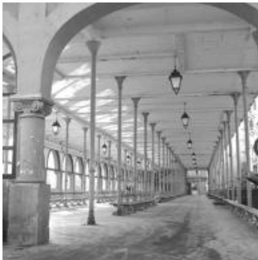
Zerkausian egiten den azokaren egoera hobetu nahi du Udalak. HITZA

Jasotako erantzunak askotarikoak dira, baina zenbait esparrutan adostasun maila altua lortu dute. Parte-hartzaileen gehiengoak uste du premiazkoa dela Zerkausiari erosotasun handiagoa ematea tolosarren bilgune bilakatu bada, eta bere ohiko erabilera-erako estalkia egokitu behar dela irizten diotenak ere asko dira: 102 lagun, hain zuzen. Ala-