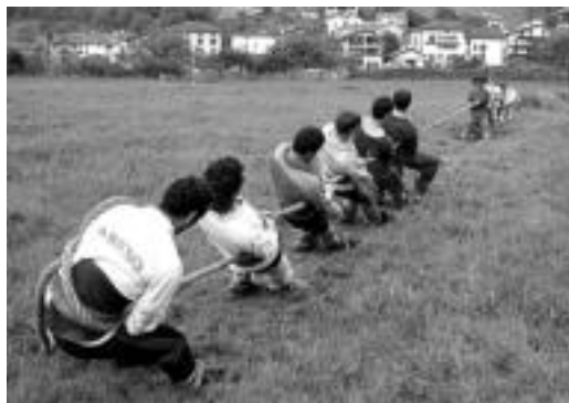
Aresoko Soka Tira taldea prestatketetan. JAIONE ASTIBIA

Negu guztian prestatzen aritu ondoren, orain fruituak jasotzeko tenorea iritsi da