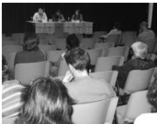
Asteazkeneko mahai-ingurua interes handiz jarraitu zuten. JOXEMI SAIZAR

Astea bukatzeko, bihar Irazkiko kide eta lagunen arteko bazkari multikulturala izango da.