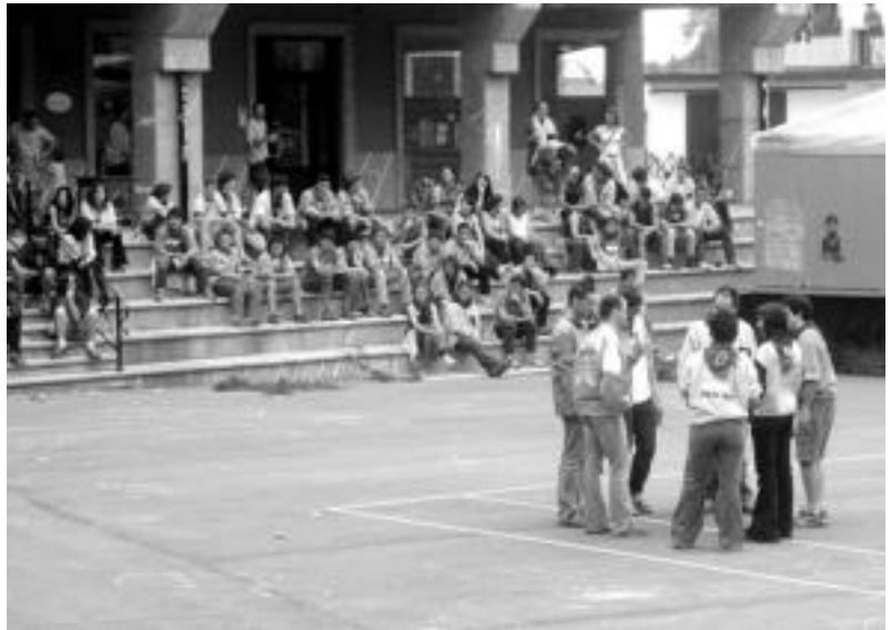
Txosnagunean eta plazan izango dira festetako ekintza gehienak. HITZA

Festek hurrengo igandera bitarte iraungo dute, ekainaren 13ra arte. Hala ere, Sanjoanetan ere izango da zer ikusi eta zertan parte hartu Anoetan, hilaren bukaeran.