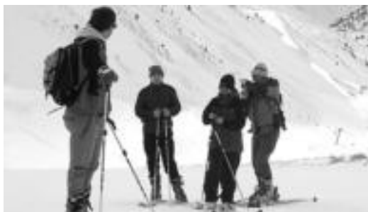
HaitzetanRaju mendi taldearen aurreko irteera bat. HITZA

Ibarrik plazatik abiatuko dira parte-hartzaileak. Ibilaldia oso lasaia izango da, lau ordu ingurukoa, eta Gorritin bazkaria prest izango dute. «Ez nolana nahiko bazkaria gainera, arku-mea jateko aukera izango baitugu, sagardo eta ardo freskoaz lagunduta. Giroa alaitzeko, Sudupe eta Baxerrik beraien txalaparta erakustaldia ere eskainiko digute. Hala, lagun giroan barre ugari botatzeko aukera izango dugu».