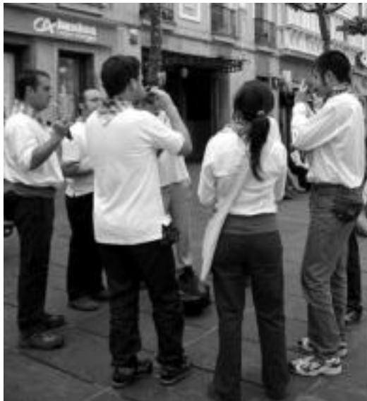
Albokalariek, Trianguloan eskaini zuten saioan.

Musikariek elkarrekin bazkaldu zuten ondoren.