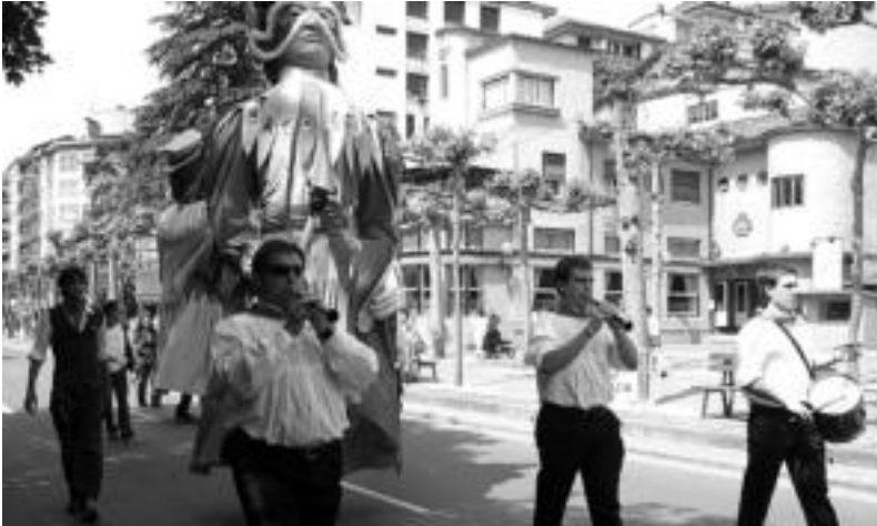
Herriko kaleetan zehar ibili ziren dultzaineroak eta erraldoiak, buruhandiak aurretik zituztela. O.ESKITXABEL