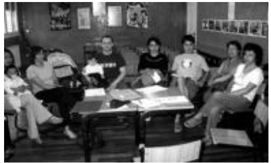
Irazkiko kide batzuk ekitaldien aurkezpenean. JOXEMI SAIZAR

Larunbatean hainbat herrialdeetako plater tipikoak eskainiko dituzte Irazkiko lagunek: Gineako ebafonoa , Saharako cuscus , Marokoko tea, Argentinako enpanadak, Brasilgo cojinha , Mexikoko pozole, Dominikar Errepublikako ogi budina, Euskal Herriko euskal tarta eta txistorra, Ekuadorreko ceviche , Venezuelako arepas , Kolonbiako platano tarta eta Peruko papas a la guancaína . Sarrera gisa bi euroko pezioa jarri dute. Plateren errezeptak ere emango dituzte.