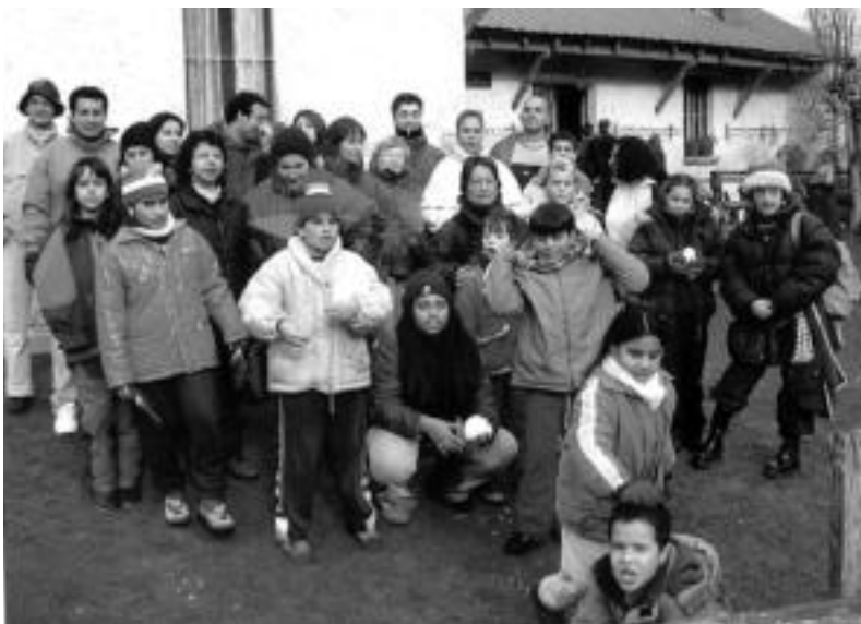
Irazki elkarteak hainbat irteera antolatu du Euskal Herria ezagutzeko. Argazkian, San Migelen. HITZA

Bazkaria. Kulturazduna. Eskolapioen ikastetxean 14:00etan.