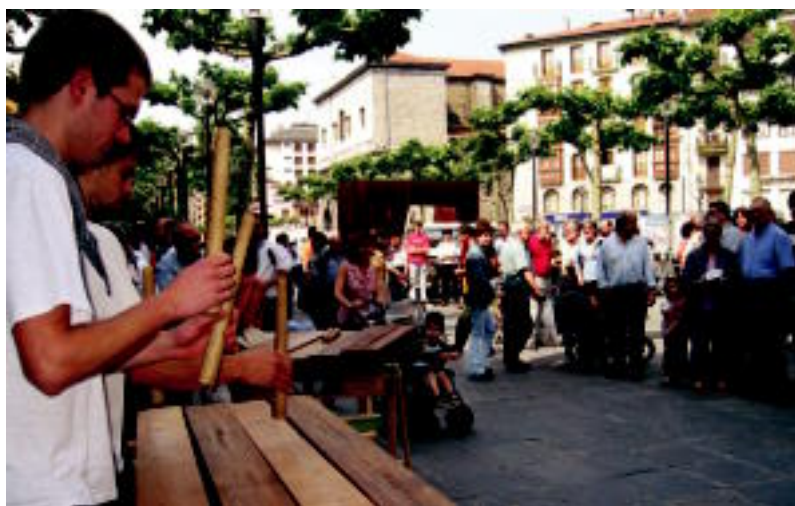
Ibarrako txalapartarien saioa Triangulo plazan atzo eguerdian. OLAIJA ESKITXABEL

DENETIK ▶ Txalaparta, dultzaina, alboka eta trikitixa entzun ahal izan ziren Musikaria astea amaitzeko ▶ 6