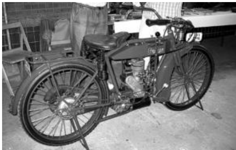
Indian K Featherweight motoa 1918an iritsi zen Iruñera. JAIONE ASTIBIA

Erakusketako izarren dizdirapean, lehenengo mendeko garai desberdinetako ibilgailuak daude erakusgai eta salgai ere