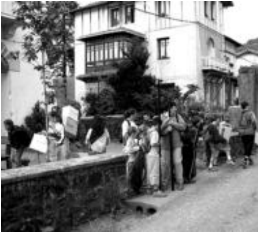
Aresoko eskolako umeak abiatzeko prest. JAIONE ASTIBIA