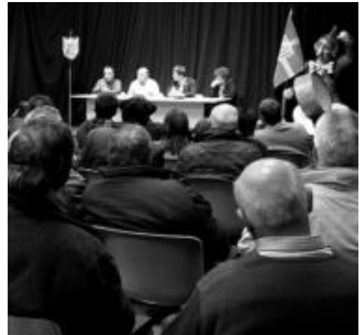
Ero-Etxe elkarteak Inauterietan kaleratu zuen diskoaren aurkezpena, Kultur Etxean. OLALIA ESKITXABEL

Betizu taldea Leidorren eskaintzekoa zen kontzertua ekainaren 12ra atzeratu egin da