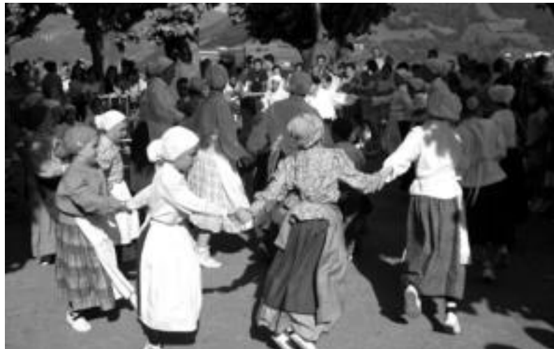
Alurr dantza taldeko gaztebakekoen saioko une bati, iazko Izaskungo jaietan.

Sega txikiko txapelketa berezia jokatu da bihar auzoko belazeetan; etzi bertsolariak eta dantzariak izango dira