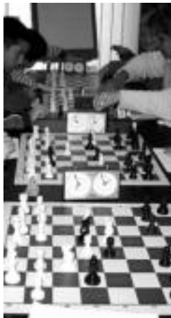
Xake erakustaldia. O. ESKITXABEL

Bihar izango da, aurreko astean Iruran egin zuten moduan, xake erakustaldia Anoetan. 16:30etik 18:00etara arituko dira LH-tik aurrerako 40 ume inguru. Gaztetxoak, Anoetako Herri Ikastolan bilduko dira. Irurako saioa «arrakastatsua» izan zen bertako antolatzaileen esanetan. Erakustaldi honen baitan erabakiko dute hurrengo urterako tailerra eratu den edo ez.