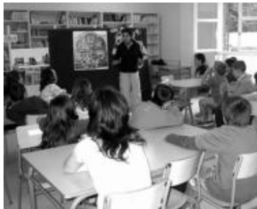
Anoetako Ikastolako talde bat supermerkatua tailerlean.