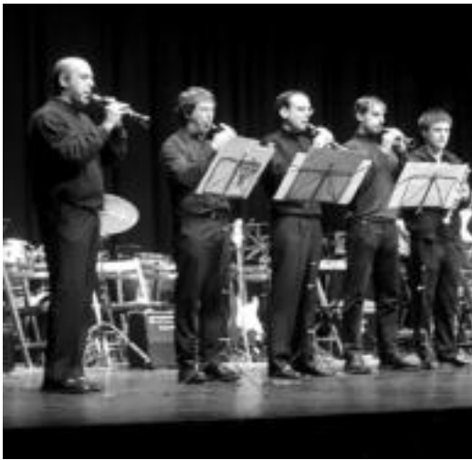
Giroarte dultzainari taldekoak, emanaldi batean, Leidorren. J. SAIZAR