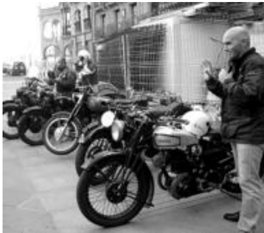
Motoak jendaurrean ikusgai jarri zituzten abiatu aurretik. LEIRE MONTES

Rolls Royce autoaren ehungarren urtemuga dela eta, modelo batzuk ikusgai izango dira Ferialekuan; besteak beste, 1937ko Coupe de Ville bat eta 1950ko Silver Pray bat. Bestalde, AEBetan 1916an egin zen Indian K. Featherweigh motoa ere izango da ikusgai; jabea nafarra da, eta motoa 1918an iritsi zen Iruñera.