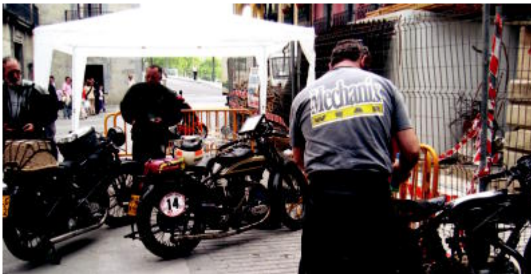
Non stop probako motozale batzuk atzo arratsaldean plaza Zaharrean. JOXEMI SAIZAR

PROBA ▶ Atzo abiatu zen moto proba gaur amaituko da, mila kilometro egin ondoren ▶ 2