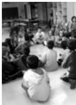
Herri askotan izango dira udaleku irekiak. G. AZKUE

Zizurkilgo ere izango dira udaleku irekiak, ekainaren 28tik uztailaren 23ra bitarte. Begiraleak aukeratzeko deialdia egin dute, beraz. Zizurkilgo erroldatuta egon behar dute, 18 urte beteta eduki behar dituzte. Euskara ere ondo menperatu behar dute aurkezten direnek, eta azterketa teoriko-