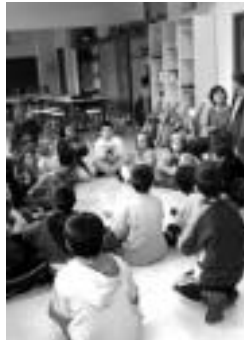
Herri askotan izango dira udaleku irekiak.

Zizurkilgo ere izango dira udaleku irekiak, ekainaren 28tik uztailearen 23ra bitarte. Begiraleak aukeratzeko deialdia egin dute, beraz. Zizurkilgo erroldatuta egon behar dute, 18 urte beteta eduki behar dituzte. Euskara ere ondo menperatu behar dute aurkezten direnek, eta azterketa teoriko-