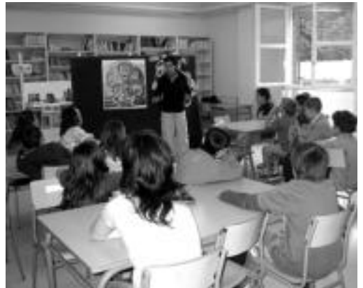
Anoetako Ikastolako talde bat supermerkatua tailerlean. G. AZKUE