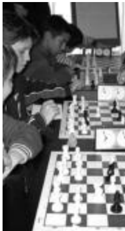
Xake erakustaldia. O. ESKITXABEL

Bihar izango da, aurreko astean Iruran egin zuten moduan, xake erakustaldia Anoetan. 16:30etik 18:00etara ariko dira LH-tik aurrerako 40 ume inguru. Gaztetxoak, Anoetako Herri Ikastolan bilduko dira. Irurako saioa «arrakastatsua» izan zen bertako antolatzaileen esanetan. Erakustaldi honen baitan erabakiko dute hurrengo urterako tailerra eratu den edo ez.