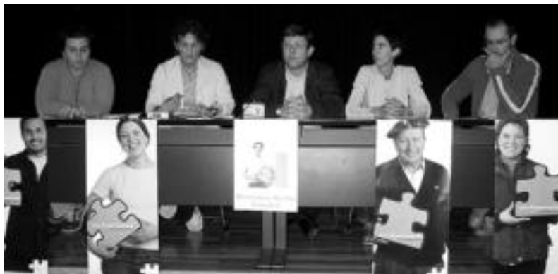
Konpromisoa hartu duten lagunetako hiru lagun, Bai Euskarari taldekoekin, herenegun Ibarra. D. GIBELALDE

Kontseiluak abian jarritako dinamika berriarekin bat egin dute eskualdeko lanbide desberdinetako norbanakoei