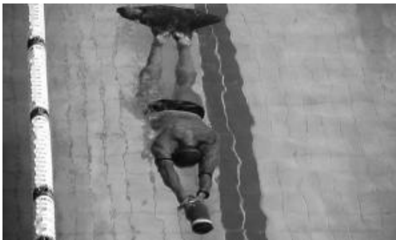
Igarondo Urpekoak taldeko igerilari bat, txapelketa batean.