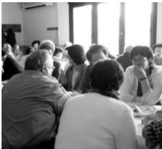
Elkarteko mahai guztiak bete ziren hamaiketako garaian. HITZA

Bertsolariek herritarren irriak sortarazi zituzten bertsoekin eta txisteekin