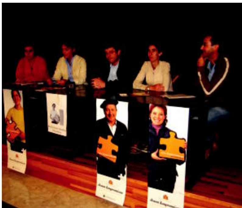
Konpromisoa hartu duten hainbat lagun eta Bai Euskarari taldeko kideak herenegun Ibarra. DANI GIBELALDE

HELBURUAK ▶ Konpromisoak hartu, sarea sortu eta oztopoak gainditzea dira Kontseiluaren helburuak ▶ 6