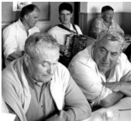
Bertsolariek eta trikitilariak alaitu zuten atzoko eguna.