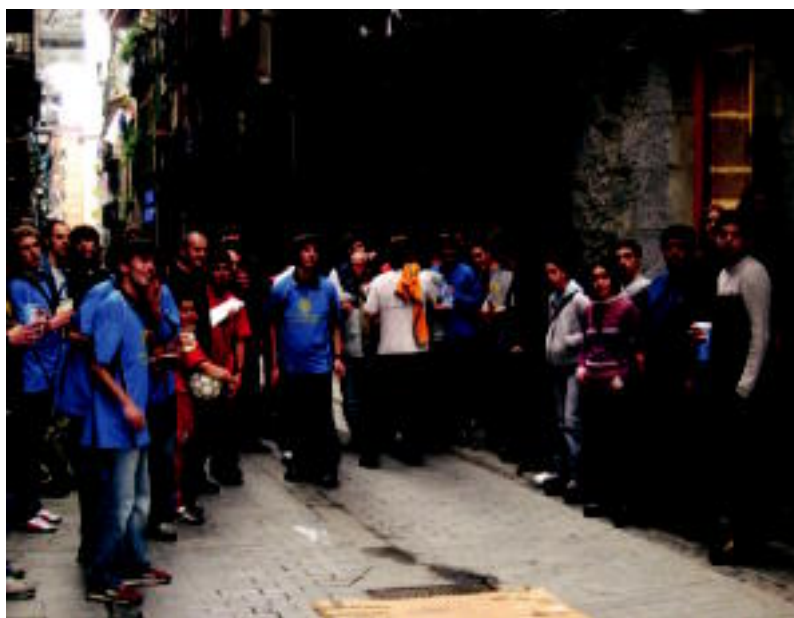
Tolosa Kup festan lagun ugari bildu ziren atzo; argazkian, gazte batzuk token jokatzeko. DANI GIBELALDE

GIROA ▶ 400 bat lagun bildu ziren Plaza Berrian bazkaltzeko; herriko DJek jardun zuten ondoren ▶ 7