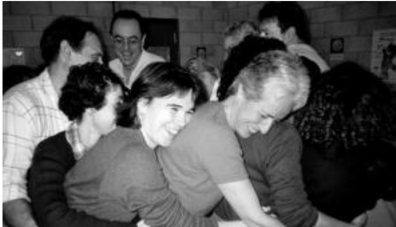
Kontaktu fisikoaren garrantzia azpimarratzen dute barrearen tailerreko irakasleek. HITZA

Saioak alderdi teoriko bat du, jendeari barreak dakartzion onurei buruz hitz egiteko; alderdi praktikoa, berriz, barrea eragiteak, kontaktu fisikoak, pentsamendu positiboa eta umore ona zabaltzeko eta talde jokoak osatzen dute, besteak beste. Saio bakoitzak gutxienez