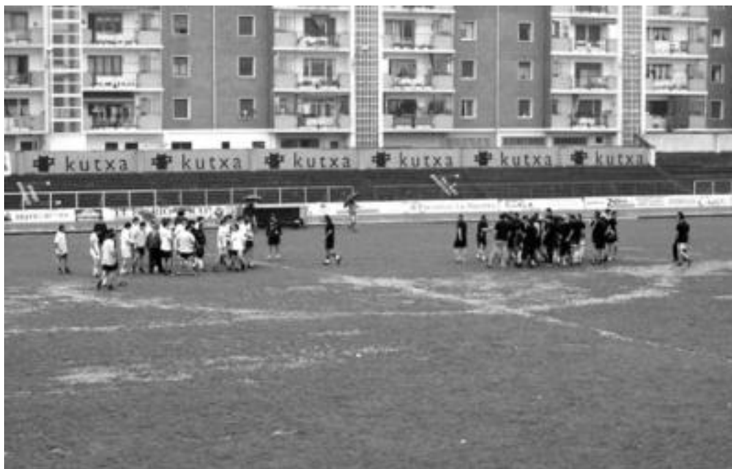
Bi taldeen jarraitzaile ugari bildu ziren Berazubín; argazkian, partida hasi aurrero uneak zelaian. G. AZKUE

Plaza Berrian 400 lagun elkartu ziren bazkaltzeko; ondoren, DJak izan ziren