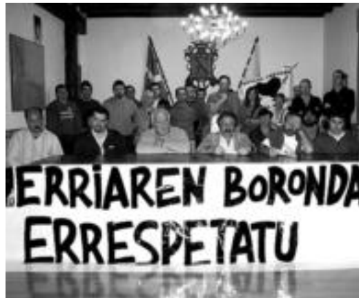
Bailarako ezker abertzaleko hautetsi ugari, atzo Lizartzan. D. GIBELALDE

dizkioten herriari hiritarren bozkaz aukeratutako zinegotzi eta alkateak». Gainera, alderdi horiek «ezker abertzaletik behin eta berriro iristen zaizkien elkarrizketa eta konponbiderako deien aurrean entzungor» jartzen direla salatu zuten, eta «PP eta PSOE bezalako alderdiekin ilegalizazioaren emaitzen tarta elektorala banatzen» dutela, «putreak bailiran». Ezker abertzalekoak udaletxean egon diren denbora guztian «lana herriaren zerbitzura, bere garapenaren mesedetan» egin dutela aipatu zuten, eta «harro» daudela lortutako emaitzekin. Besteak beste, «zintotasunez jokatzeko, esku-bide nazionalen, langileen, eta herritarren alde, etxebizitza politika eraginkorrek bultzatzea, errepresaliatuei arreta, aurrerapenetan izandako adorea, herri eraikuntzan, norta-