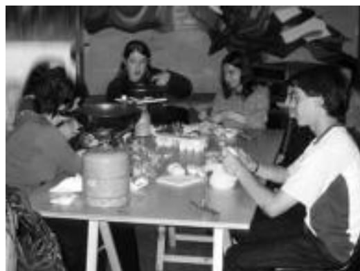
Tortila txapelketan gazte ugari hartu zuen parte.

karroi jatean ere. Arratsaldean trikipotea egin zuten, eta iluntzean afaria Gaztetxean. Gauean, Nekin eta Izeba Pilarren ilobak taldeekin kontzertuak izan ziren. Gaur amaituko dira ekitaldiak, Gaztetxean egingo den mus txapelketarekin.