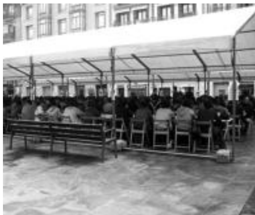
Plaza Berrian izan zen bazkari jendetsua. G. AZKUE

Bazkariaren ondoren, mahaiak eta aulkiak jaso eta dantzaleku bilakatu zuten bai kar-