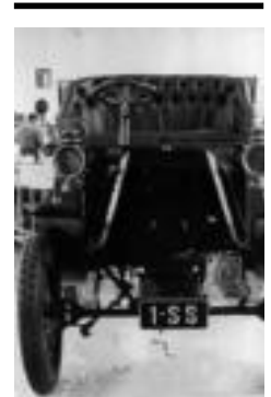
Donostiako lehen autoa. HITZA

Ibilgailu Klasikoen Elkarteak 1995. urtean Tolosan I. Ibilgailu Klasikoen Erakusketa antolatu zuenetik, urtetik urtera indarra hartuz joan da. Motorren inguruko erakusketen artean leku egin du, adituek galtzen ez duten zita bihurtu delarik.