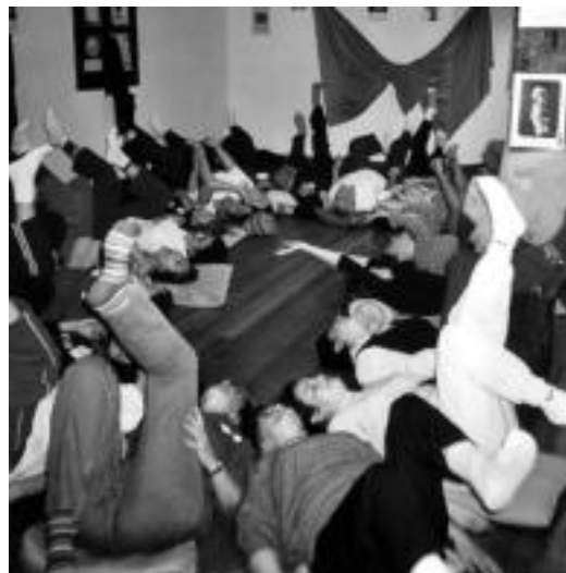
Barrea eragiteko modu desberdinak lantzen dituzte tailerrean. HITZA

Galdutako barre hori berreskuratu nahi dutenentzat zuzendua dago; norberak duen one-na ateratzen laguntzen du eta, modu horretara, besteekin ba-