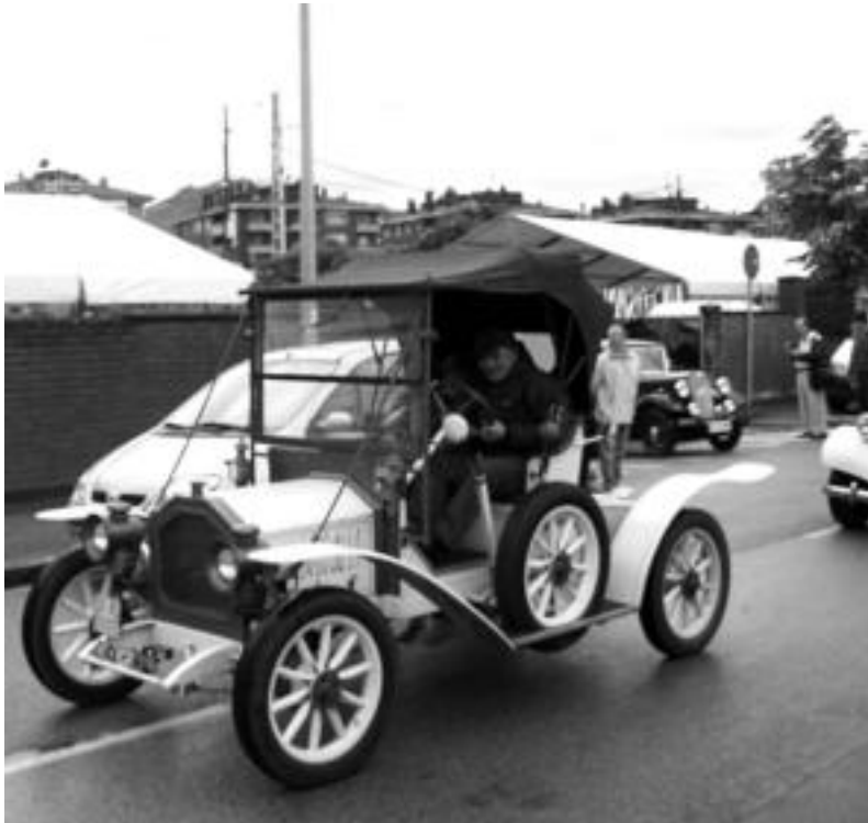
Horrelako autoak ikusi ahal izango dira Tolosako ferialekuan datorren asteburuan. UNAI URREAGA

Indian K Featherweight moto bat izango da ikusgai. 1916an egin zen AEBetan eta 1918an iritsi zen Iruñera. Gaur egun, motoaren jabea nafarra da.